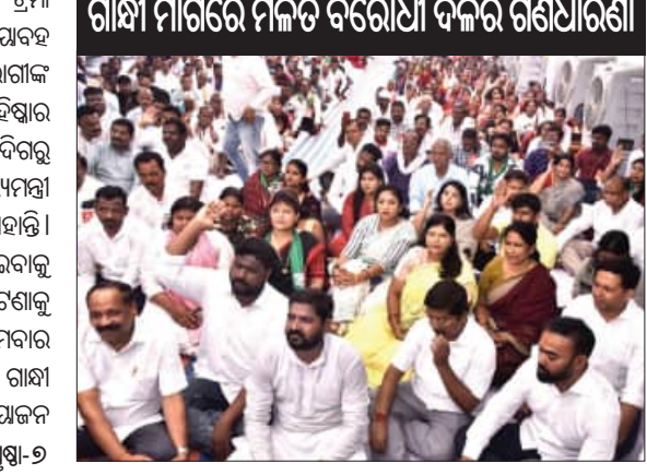
ଗାନ୍ଧୀ ମାର୍ଗରେ ମିଳିତ ବିରୋଧୀ ଦଳର ଗଣଧାରଣା

■ ଭୁବନେଶ୍ୱର, ୩୦ ମାର୍ଚ୍ଚ (ଏକେଡ୍): ଏସ୍‌ସିବି ଟ୍ରମା କେନ୍ଦ୍ରର ଆଇସିୟୁରେ ଘଟିଥିବା ଭୟାନକ ଅଗ୍ନିକାଣ୍ଡରେ ୧୩ ଜଣ ନିରାହ ରୋଗୀଙ୍କ ମୃତ୍ୟୁ ଘଟଣାରେ ସ୍ୱାସ୍ଥ୍ୟମନ୍ତ୍ରୀଙ୍କ ବହିଷ୍କାର ଦାବି ତେଜିବାରେ ଲାଗିଛି । ବିଭିନ୍ନ ଦିଗରୁ ସରକାରଙ୍କ ଉପରେ ଚାପ ସୃଷ୍ଟି ସ୍ୱାସ୍ଥ୍ୟମନ୍ତ୍ରୀ ଏହି ଘଟଣାରେ ଉତ୍ତର ଦେବାକୁ ପଡ଼ିବ । ମୁଖ୍ୟମନ୍ତ୍ରୀ ମଧ୍ୟ ତାଙ୍କୁ ମହିଳାଶକ୍ତିରୁ ହଟାଇବାକୁ ପଦକ୍ଷେପ ନେବାକୁ ହେବ । ଏହି ଘଟଣାକୁ ଆହୁରି ଜୋରଦାର କରିବାକୁ ସୋମବାର ମିଳିତ ବିରୋଧୀ ଦଳଗୁଡ଼ିକ ପକ୍ଷରୁ ଗାନ୍ଧୀ ମାର୍ଗରେ ଏକ ବିଶାଳ ଗଣଧାରଣା ଆୟୋଜନ ହୋଇଛି । ଏହି ଧାରଣାରେ