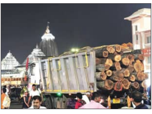
ନୟାଗଡ଼, ବୌଦ୍ଧ, ଖୋର୍ଦ୍ଧା ପୁରୀ ରଥଖଳାରେ ପହଞ୍ଚିଲା ତୃତୀୟ ପର୍ଯ୍ୟାୟ ରଥକାଠ

ପୁରୀ, ୨୬ ମାର୍ଚ୍ଚ (ସମ୍ପାଦକ): ଘୋଷଯାତ୍ରା ପାଇଁ ଗୁରୁବାର ବୌଦ୍ଧ ମାଧ୍ୟମର ବନଖଣ୍ଡରୁ ତୃତୀୟ ପର୍ଯ୍ୟାୟ ରଥକାଠ ଆସି ପହଞ୍ଚିଛି । ଗୋଟିଏ ଟ୍ରକ୍‌ରେ ୨୮ ଖଣ୍ଡ ଅସନ କାଠ ପହଞ୍ଚିଥିବାବେଳେ ତତୁଧରୁ ୧୨ ପୁଟିଆ ୯ ଖଣ୍ଡ, ୨୦ ପୁଟିଆ ୧୯ ଖଣ୍ଡ କାଠ ରହିଛି । ଗ୍ରୀଷ୍ମମଣ୍ଡଳରେ ମହାପ୍ରଭୁଙ୍କ ତିନି ରଥର କାଠ ଅନୁକୂଳ ପୂଜା ହୋଇ ସାରିଛି । ୩ଟି ୧୨ ପୁଟିଆ ଧଉଳା କାଠ ରଥକାଠ ଅନୁକୂଳ ପର୍ବରେ ପୂଜା କରାଯାଇଥିଲା । ଏବେ ଅକ୍ଷୟ ତୃତୀୟକୁ ଅପେକ୍ଷା କରାଯାଇଛି । ଏହି ଚିଥିରେ ମହାପ୍ରଭୁଙ୍କ ତିନି ରଥର ନିର୍ମାଣ ଅନୁକୂଳ ପର୍ବ ସମ୍ପନ୍ନ ହେବ । ତା' ପୂର୍ବରୁ ତିନି ରଥ ପ୍ରାଥମିକ ପର୍ଯ୍ୟାୟରେ ଆବଶ୍ୟକ ରଥ କାଠ ୪ଟି ଜିଲ୍ଲା ଗଞ୍ଜାମ,