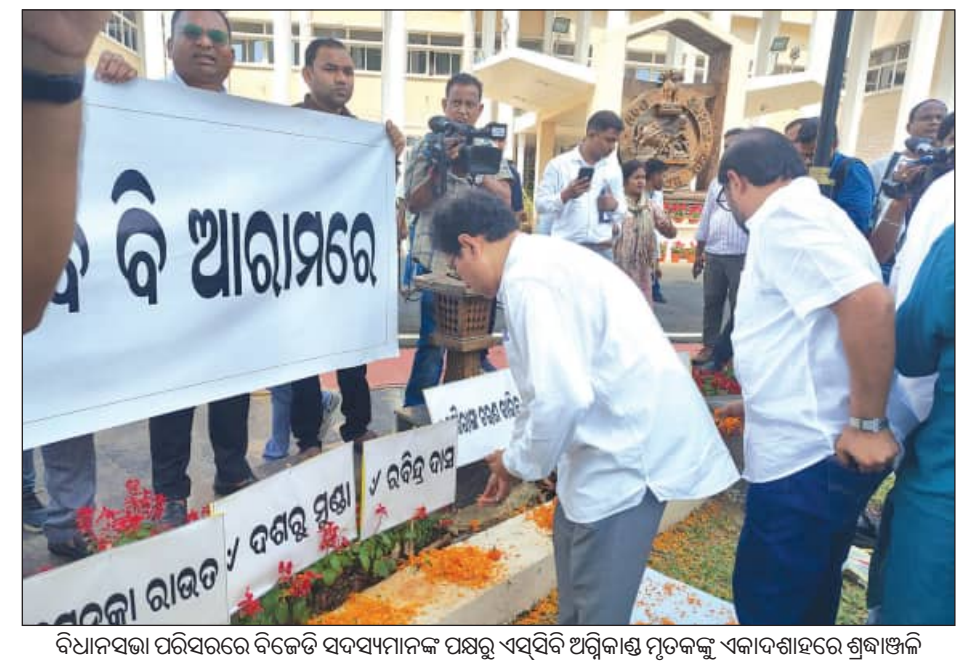
ବିଧାନସଭା ପରିସରରେ ବିଜେଡି ସଦସ୍ୟମାନଙ୍କ ପକ୍ଷରୁ ଏସସିବି ଅଗ୍ନିକାଣ୍ଡ ମୃତକଙ୍କୁ ଏକାଦଶାହରେ ଶ୍ରଦ୍ଧାଞ୍ଜଳି

ଓ ସେମାନଙ୍କ ସମ୍ପର୍କରେ ସୂଚନା ଦେବା ପାଇଁ ରିଅଲ୍-ଟାଇମ୍ ଡିଜିଟାଲ୍ ଡିଭିଜନ୍ ସ୍ଥାପନ କରିବାକୁ କୁହାଯାଇଛି । ଏହି କାର୍ଯ୍ୟର ଅଗ୍ରଗତି ନେଇ ମୋ' ୭ତାରିଖ ସୁଦ୍ଧା ଆପିଡିଭିଜନ୍ ଦାଖଲ କରିବାକୁ ସରକାରଙ୍କୁ କୁହାଯାଇଛି । ଅନ୍ୟପକ୍ଷରେ, ମେଡିକାଲରେ କେନ୍ଦ୍ରୀୟ ଉପକ୍ରମଣକରେ ସ୍ୱାସ୍ଥ୍ୟକର ପରିବେଶ ଏବଂ ସ୍ୱଚ୍ଛତା ବଜାୟ ରଖିବା ପାଇଁ ପ୍ରଶାସନ ପକ୍ଷରୁ ଲୁହା କାଲି ଗେଟ୍ ଲଗାଯାଇଥିବା ସୂଚନାକୁ କୋର୍ଟ ଗ୍ରହଣ କରିଛନ୍ତି । ଏହି ବ୍ୟବସ୍ଥା ପ୍ରକୃତରେ କେତେ ପ୍ରଭାବଶାଳୀ ହୋଇଛି, ତାହାର ସ୍ୱଳ୍ପବେଶ ଅନୁଧ୍ୟାନ କରି ମୋ' ୧୪ ସୁଦ୍ଧା ରିପୋର୍ଟ ଦେବାକୁ ଆଡଭୋକେଟ୍ କମିଟିକୁ ନିର୍ଦ୍ଦେଶ ଦିଆଯାଇଛି । ହାଇକୋର୍ଟଙ୍କ ଏହି କଠୋର ଆଜିମୁଖ୍ୟ ପରେ ଏସସିବିରେ ଦୀର୍ଘ ଦିନରୁ ଅଟକି ରହିଥିବା ଅନେକ ଜନହିତକର କାର୍ଯ୍ୟ ଦ୍ରବୀକୃତ ହେବାର ଆଶା ସୃଷ୍ଟି ହୋଇଛି ।