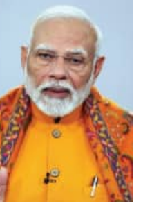
୨୦୦୧ରୁ ୨୦୧୪ ଗୁଜରାଟ ମୁଖ୍ୟମନ୍ତ୍ରୀ ୨୦୧୪ରୁ କୁମ୍ଭାରତ ତିନିଥର ପ୍ରଧାନମନ୍ତ୍ରୀ

■ ନୂଆଦିଲ୍ଲୀ, ୨୨।୩ (ଏକେଡି): ପ୍ରଧାନମନ୍ତ୍ରୀ ନରେନ୍ଦ୍ର ମୋଦୀ ଭାରତୀୟ ରାଜନୀତିରେ ରବିବାର ଆଇ-ଏକ ମାଲକ୍ଷୁଷ୍ଟ ଅତିକ୍ରମ କରି ଇତିହାସ ସୃଷ୍ଟି କରିଛନ୍ତି। ସେ ସରକାରୀ ମୁଖ୍ୟ ଭାବେ ୮, ୯୩୧ ଦିନ ପୂରଣ କରି ଭାରତର ଦୀର୍ଘତମ ସମୟର ଶାସନକର୍ତ୍ତା ହେବାର ଗୌରବ ଅର୍ଜନ କରିଛନ୍ତି। ଏହି କ୍ରମରେ ସେ ସିକିମର ପୂର୍ବତନ ମୁଖ୍ୟମନ୍ତ୍ରୀ ପବନ କୁମାର ଗାମ୍ଲିଙ୍କ ୮, ୯୩୦ ଦିନର ରେକର୍ଡକୁ ଅତିକ୍ରମ କରିଛନ୍ତି। ମୋଦୀଙ୍କ