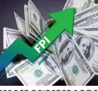
୨୦୨୨ରେ ଉଠାଇନେଲେ ୧ ଲକ୍ଷ କୋଟି ଚାପଗ୍ରସ୍ତ ଭାରତୀୟ ସେୟାର ବଜାର

ମୁମ୍ବାଇ, ୨୨ମାର୍ଚ୍ଚ (ଏକେନ୍ଦ୍ରି): ଭାରତୀୟ ଷ୍ଟକ୍ ବଜାରରେ ବିଦେଶୀ ନିବେଶକଙ୍କ ବିକ୍ରି ଚାପ ବୃଦ୍ଧି ପାଇବାର ଲାଗିଛି। ଚଳିତବର୍ଷ ଏ ପର୍ଯ୍ୟନ୍ତ, ବିଦେଶୀ ଯୋଗଦାନ ଓ ନିବେଶକ (ଏସିଆର) ଭାରତୀୟ ଷ୍ଟକ୍ ବଜାରରୁ ୧ ଲକ୍ଷ କୋଟି ଟଙ୍କା ପ୍ରତ୍ୟାହାର କରିଛନ୍ତି। ସେଥିରୁ କେବଳ ମାର୍ଚ୍ଚ ମାସରେ ଏ ପର୍ଯ୍ୟନ୍ତ ବଜାର ୮୮,୧୮୦ କୋଟି ଟଙ୍କା ଉଠାଇନେଇଛି। ଏ ପୂର୍ଣ୍ଣ ଏସିଆରେ ବହୁଥବା ଉଦ୍ଭେଦନା, ଟଙ୍କା ମୂଲ୍ୟ ଦୁର୍ବଳ ହେବା ଏବଂ ଅଗୋଧୂତ ତୈଳ ମୂଲ୍ୟ ବୃଦ୍ଧି ଏହି ବିପ୍ଳବ ବିକ୍ରି ପଛରେ ମୁଖ୍ୟ କାରଣ ବୋଲି ବିଶ୍ୱାସ କରାଯାଉଛି। ତିସାକ୍ଷରେ ତଥ୍ୟ ଅନୁଯାୟୀ, ମାର୍ଚ୍ଚ ମାସର ପ୍ରଥମ ତିନି ସପ୍ତାହରେ ପ୍ରତ୍ୟେକ ବ୍ୟବସାୟିକ ଦିନରେ ଏସିଆର ମାନେ ନିବେଶ କରିଥିଲେ। ଯଦିଓ ଏହି ପ୍ରତ୍ୟାହାର ୨୦୨୪ ଅକ୍ଟୋବରରେ ରେକର୍ଡ୍ ୯୪,୦୧୨ କୋଟି ଟଙ୍କାର ପ୍ରତ୍ୟାହାର ରୁକ୍ଷରେ ସାମାନ୍ୟ କମ୍, ବର୍ତ୍ତମାନର ପରିସ୍ଥିତି ନିବେଶକଙ୍କ ଚିନ୍ତା ବଢ଼ାଇବା ପାଇଁ ଯଥେଷ୍ଟ। ଆଖ୍ୟାୟିକନକ ଭାବରେ, ଫେଡ଼େରାରେ ବିଦେଶୀ ନିବେଶକମାନେ ଭାରତୀୟ ବଜାରରେ ଏକ ଦୃଢ଼ ପ୍ରତ୍ୟାବର୍ତ୍ତନ କରିଥିଲେ। ସେହି ସମୟରେ