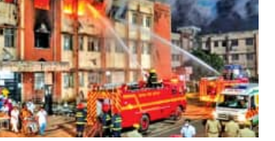
ହସ୍ପିଟାଲରେ ଅଗ୍ନି ନିରାପତ୍ତାର ହେବ ନିୟମିତ ଯାଞ୍ଚ

■ ଭୁବନେଶ୍ୱର, ୨୨।୩ (ସମ୍ପାଦକ): ଏସ୍‌ସିବି ଅଗ୍ନିଶାଳା ଯୋଗୁଁ ୧୩ ଜଣ ରୋଗୀଙ୍କ ମୃତ୍ୟୁ ଘଟଣା ସାରା ରାଜ୍ୟରେ ଆଲୋଚନା ସୃଷ୍ଟି କରିଛି। ବିଜେଡି ଓ କଂଗ୍ରେସ ସ୍ୱାସ୍ଥ୍ୟମନ୍ତ୍ରୀଙ୍କ ଇସ୍ତଫା ଦାବିରେ ଅଡ଼ି ବସିଛନ୍ତି। ଏସ୍‌ସିବି ନିଆଁ ଚାରିଦିନ ବିଧାନସଭା ବି ଗରମ ହୋଇଛି। ଗଲା ୩ ଦିନ