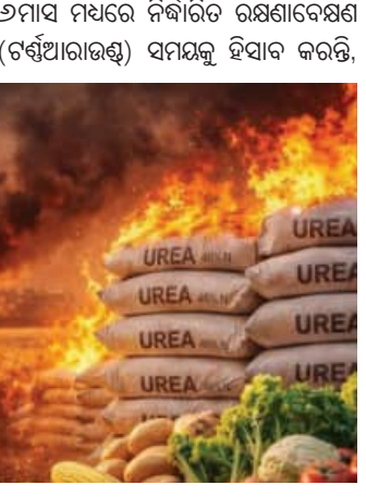
ୟୁନିଆ ଦ୍ୱାଖଣ୍ଡରେ ଅଧା ହୋଇ ଚାଲିଛି ଉତ୍ପାଦନ

ନୂଆଦିଲ୍ଲୀ, ୨୨ମାର୍ଚ୍ଚ (ଏକେନ୍ଦ୍ରି): ପୂର୍ଣ୍ଣ ଏସିଆରେ ବିନିର୍ମିତ ଭାରତକୁ ଯଥେଷ୍ଟ ଖର୍ଚ୍ଚ ପହଞ୍ଚାଇବାରେ ଲାଗିଛି। ହରମୁଜ୍ ପ୍ରଣାଳୀ ଦେଇ ଗ୍ୟାସ୍ (ଏଲପିଜି) ଯୋଗାଣରେ ବାଧା ଏକ ପ୍ରମୁଖ ଚିନ୍ତା କାରଣ ପାଲଟିଛି। ଇନ୍ଦନ ଉପଲବ୍ଧତା ହ୍ରାସ ହେତୁ ଭାରତୀୟ ଯୁନିଆ ଦ୍ୱାଖଣ୍ଡର ସେମାନଙ୍କର ଉତ୍ପାଦନ ପ୍ରାୟ ଅଧା ହୋଇ ଚାଲିଛି। ଏହି ଦ୍ୱାଖଣ୍ଡକୁ ଗ୍ୟାସ୍ ଯୋଗାଣ ୬୦-୬୫% ହ୍ରାସ ପାଇଛି। ଏହି ପରିସ୍ଥିତି ଭାରତ ପାଇଁ ଅତ୍ୟନ୍ତ ବିପଜ୍ଜନକ। କାରଣ ଅଗାଧ ଏଲପିଜି କୃଷି କ୍ଷେତ୍ରକୁ ପ୍ରଭାବିତ କରିପାରେ। ଭାରତ ବିଶ୍ୱରେ ଯୁନିଆର ସର୍ବବୃହତ୍ ଗ୍ରାହକ। ହରମୁଜ୍ ପ୍ରଣାଳୀ ଦେଇ ପରିବହନ କରୁଥିବା କାର୍ଗୋ ବାଧାପ୍ରାପ୍ତ ହୋଇଛି। ପରବର୍ତ୍ତୀ ସମୟରେ, ଅପସ୍ଥିତ ଯୋଗାଣକାରୀମାନେ ଫୋର୍ସ ମାଜିୟର (ଅପରିହାର୍ଯ୍ୟ ପରିସ୍ଥିତି ଯୋଗୁଁ ବୃଦ୍ଧି ଛାଡ଼ି) ବ୍ୟବହାର କରିଥିଲେ। ଏହା ଦ୍ରୁତ ଗତିରେ ସମଗ୍ର ଯୋଗାଣ ଶୃଙ୍ଖଳାକୁ ପ୍ରଭାବିତ କରିଥିଲା। ରାସବାସ୍ୟା ଯୁନିଆରୁ ଅନୁଯାୟୀ କାର୍ଯ୍ୟ କରୁଥିବା ସରକାରୀ ବାଧାପ୍ରାପ୍ତ ହୋଇଛି। ପରବର୍ତ୍ତୀ ସମୟରେ, ଅପସ୍ଥିତ ଯୋଗାଣ କର୍ତ୍ତୃପକ୍ଷରେ (ଆଇଓସି), ଏବଂ ଭାରତ ପେଟ୍ରୋଲିୟମ୍ କର୍ପୋରେସନ୍ ଗ୍ୟାସ୍ ଯୋଗାଣ ହ୍ରାସ କରିଛନ୍ତି। ଜଣେ ବରିଷ୍ଠ ଶିଳ୍ପ ଅଧିକାରୀ କହିଛନ୍ତି, ସାତାଦିକ ସ୍ତରର ପ୍ରାୟ ୬୦-୬୫ ପ୍ରତିଶତ ଗ୍ୟାସ୍ ଯୋଗାଣ ହ୍ରାସ ପାଇଛି। ସେ ଆହୁରି ମଧ୍ୟ କହିଛନ୍ତି