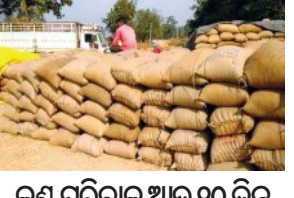
କଣ୍ଠ ପୂରିବାକୁ ଆଉ ୧୦ ଦିନ ବିକ୍ରି ନ ହୋଇ ରହିବ ୩୦ ଲକ୍ଷ ମେଟ୍ରିକ ଟନ୍ ବଳକା ଧାନ

■ ଭୁବନେଶ୍ୱର, ୨୦୩୩ (ସମିସ): ଖରିଦ୍ ରତ୍ନରେ ୭୩ ଲକ୍ଷ ଟନ୍ ଧାନ କିଣିବାକୁ ସରକାର ଲକ୍ଷ୍ୟ ଧାର୍ଯ୍ୟ କରିଥିଲେ। ବର୍ତ୍ତମାନ ଯର୍ଯ୍ୟତ୍ନ ୭୧ ଲକ୍ଷ ମେଟ୍ରିକ ଟନ୍ ଧାନ କିଣାଯାଇଥିବା ସରକାର ଦାବି କରୁଛନ୍ତି ଓ ଅବଶିଷ୍ଟ ୧୦ ଦିନରେ ଏହି ୨ ଲକ୍ଷ ଧାନ କିଣା ସରିବ। ମାତ୍ର ଏହା ପରେ ବିକ୍ରି ପାଇଁ ମଣ୍ଡିରେ ୩୦ ଲକ୍ଷ ଟନ୍ ଧାନ ଧରି ବସିଥିବା ୩ ଲକ୍ଷ ଚାଷୀ କ'ଣ କରିବେ, ତାହା ସରୁରୁ