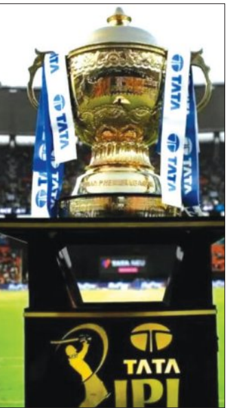
ବାହାରର ଖେଳାଳିମାନଙ୍କୁ ଉପଯୁକ୍ତ ଅର୍ଥରାଶି ଦେଇ ଦଳରେ ସାମିଲ କରାଯାଉଛି। ଏହା ପକ୍‌ରେ ଆଇପିଏଲରେ ଯେପରି ନବାଗତ ଖେଳାଳି ସୃଷ୍ଟି ହେଉଛି, ଠିକ୍ ସେହିପରି ପ୍ରତିଦ୍ୱନ୍ଦ୍ୱିତାର ମାନରେ ବୃଦ୍ଧି ହେଉଛି। ଏହାକୁ ଆଖିଆନ୍ତରେ ରଖି ପାକିସ୍ତାନ କ୍ରିକେଟ ବୋର୍ଡ କିଛି ଶିକ୍ଷା ଲାଭ କରୁ ବୋଲି ସେହବାଦୀ କହିଛନ୍ତି।

ଅନ୍ୟ ପକ୍ଷରେ ପାକିସ୍ତାନ ସୁପର ଲିଗ୍‌ରେ କିଛି ଅବସରପ୍ରାପ୍ତ ଖେଳାଳି ଓ କମେଣ୍ଟେଟରଙ୍କୁ ସୁଯୋଗ ଦେଇ ପାକିସ୍ତାନ କ୍ରିକେଟ ବୋର୍ଡ ସେମାନଙ୍କୁ ସୁପରଷ୍ଟାର କରୁଛି। ସେହବାଦୀଙ୍କ ମତରେ ଗତ ୮ ବର୍ଷ ପୂର୍ବେ ବୋର୍ଡ ୬ରୁ ୬ କଣ ଖେଳାଳିଙ୍କ ଉପରେ ଦେଶ ଭରସା କରିଥିଲା। ସେମାନଙ୍କୁ ପ୍ରଚୁର ଅର୍ଥ ଦେଲା ଓ ବିଭିନ୍ନ ପ୍ରାଞ୍ଚାଳକର ନେତୃତ୍ୱରେ ଅନ୍ତର୍ଜାତୀୟ କ୍ରିକେଟ ଲାଗି ପ୍ରସ୍ତୁତ କରାଗଲା। ପକ୍ କ'ଣ ମିଳିଲା?