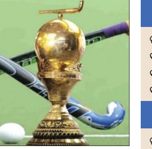
ଚାନ୍, ୧୮ରେ ଦକ୍ଷିଣ ଆଫ୍ରିକା ଓ ୨୦ରେ ଜର୍ମାନୀ ସହ ଖେଳିବାର କାର୍ଯ୍ୟସୂଚୀରୁ ଜଣାଯାଇଛି।

ନୂଆଦିଲ୍ଲୀ, ୧୯ ମାର୍ଚ୍ଚ (ଏକେଡ଼ି): ନେଦରଲାଣ୍ଡସ୍ ଓ ଦେଲଜିମ୍‌ସ୍‌ରେ ଅଗଷ୍ଟ ୧୫ରୁ ୩୦ ତାରିଖଯାଏ ଖେଳାଯିବାକୁ ଥିବା ହକି ବିଶ୍ୱକପ୍‌ରେ ଖେଳସୂଚୀ ପ୍ରକାଶ ପାଇଛି। ଗୁପ୍‌ତି'ରେ ସ୍ଥାନ ପାଇଥିବା ପୁରୁଷ ଦଳ ଅଗଷ୍ଟ ୧୫ରେ ଖେଳୁ, ୧୬ରେ ଜର୍ମାନୀ ଓ ୧୯ରେ ପାକିସ୍ତାନ ସହ ଖେଳିବାକୁ କାର୍ଯ୍ୟସୂଚୀ ପ୍ରକାଶ ପାଇଛି। ସେହିପରି ମହିଳା ଦଳ ମଧ୍ୟ ଗୁପ୍‌ତି'ରେ ସ୍ଥାନ ପାଇଛି। ଅଗଷ୍ଟ ୧୬ରେ ମହିଳା ଦଳ ପ୍ରଥମ ମ୍ୟାଚ୍‌ରେ