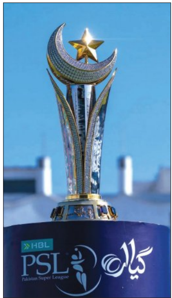
କରିଛନ୍ତି। ଆଇପିଏଲରେ ପ୍ରଚୁର ପରିମାଣରେ ଅର୍ଥ ବିନିଯୋଗ କରାଯାଉଛି। ନୂଆ ଖେଳାଳିଙ୍କୁ ଉପଯୁକ୍ତ ପ୍ରଶିକ୍ଷଣ ଓ ପ୍ରୋତ୍ସାହନ ଯୋଗାଇ ଦିଆଯାଉଛି ଓ ଦେଶ ଭରସା କରିଥିଲା। ସେମାନଙ୍କୁ ପ୍ରଚୁର ଅର୍ଥ ଦେଲା ଓ ବିଭିନ୍ନ ପ୍ରାଞ୍ଚାଳକର ନେତୃତ୍ୱରେ ଅନ୍ତର୍ଜାତୀୟ କ୍ରିକେଟ ଲାଗି ପ୍ରସ୍ତୁତ କରାଗଲା। ପକ୍ କ'ଣ ମିଳିଲା?