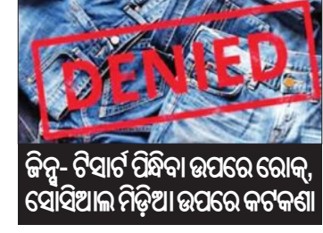
କିନ୍ତୁ ଟିଏର୍ସ ପିକିଆ ଉପରେ ରୋକ୍, ସୋସିଆଲ ମିଡ଼ିଆ ଉପରେ କଟକଣା

ସିମଲା, ୧୮ ମାର୍ଚ୍ଚ (ଏକେନ୍ଦ୍ରି): ହିମାଚଳ ସରକାର ନିଜ କର୍ମଚାରୀଙ୍କ ପାଇଁ ଏକ କଠୋର ନିୟମାବଳୀ ଜାରି କରିଛନ୍ତି। ଏଣିକି ସରକାରୀ କାର୍ଯ୍ୟାଳୟରେ କର୍ମଚାରୀମାନେ କିନ୍ତୁ, ଟିଏର୍ସ କିମ୍ବା ପାର୍ଟି ଓୟାର ପିନ୍ଧି ପାରିବେ ନାହିଁ। କର୍ମଚାରୀ ବିଭାଗ ପକ୍ଷରୁ ଜାରି ହୋଇଥିବା ଏହି ନିର୍ଦ୍ଦେଶନାମାରେ ଡ୍ରେସ କୋଡ୍ ସହ ସୋସିଆଲ ମିଡ଼ିଆ ବ୍ୟବହାର ଉପରେ ମଧ୍ୟ କଟକଣା ଲଗାଯାଇଛି। ପୁରୁଷ କର୍ମଚାରୀମାନେ କେବଳ ଫର୍ମାଲ୍ ସାର୍ଟ, ପ୍ୟାଣ୍ଟ ଓ ଟ୍ରାଉଜର ପିନ୍ଧି ଆସିବାକୁ ନିର୍ଦ୍ଦେଶ ଦିଆଯାଇଛି। ସେହିପରି ମହିଳା କର୍ମଚାରୀମାନଙ୍କ ପାଇଁ ଶାଢ଼ି, ସାଲ୍‌ଖାର- ସୁଟ୍ ଓ ଅନ୍ୟାନ୍ୟ ଫର୍ମାଲ୍ ପୋଷାକ ନିର୍ଦ୍ଦିଷ୍ଟ କରାଯାଇଛି। ସରକାରୀ କାର୍ଯ୍ୟାଳୟରେ ଅନୁଶାସନ, ଗାରିମା ଓ ପେସାଦାର ଭାବପୂର୍ଣ୍ଣ ବ୍ୟବହାର ପାଇଁ ଏହି ପଦକ୍ଷେପ ନିଆଯାଇଛି ବୋଲି କୁହାଯାଇଛି। ଡ୍ରେସ କୋଡ୍ ସହିତ ସରକାର ସୋସିଆଲ ମିଡ଼ିଆ ବ୍ୟବହାର ପାଇଁ ସ୍ପଷ୍ଟ ନିର୍ଦ୍ଦେଶ ଦେଇଛନ୍ତି। କୌଣସି ସରକାରୀ ନାଟି ଉପରେ କର୍ମଚାରୀମାନେ ସର୍ବସାଧାରଣରେ ନିଜର ବ୍ୟକ୍ତିଗତ ମତାମତ ଦେଇପାରିବେ ନାହିଁ। ରାଜନୈତିକ କିମ୍ବା ଧାର୍ମିକ ବିତର୍କକୁ ଦୂରରେ ରହିବାକୁ ନିର୍ଦ୍ଦେଶ ଦିଆଯାଇଛି। ସରକାର କିମ୍ବା ଅନୁଷ୍ଠାନର ଭାବପୂର୍ଣ୍ଣ ଖରାପ କରୁଥିବା ଭଳି କୌଣସି ପୋଷ୍ଟ କଲେ ଶୁଖିଳାଗତ କାର୍ଯ୍ୟାନୁଷ୍ଠାନ ଗ୍ରହଣ କରାଯିବ। ଏହାକୁ ପାଳନ ନ କଲେ କଡ଼ା କାର୍ଯ୍ୟାନୁଷ୍ଠାନ ଗ୍ରହଣ କରାଯିବ। ପୂର୍ବରୁ ୨୦୧୬ରେ ମଧ୍ୟ ଏଭଳି ନିର୍ଦ୍ଦେଶ ଦିଆଯାଇଥିଲା। କିନ୍ତୁ ଏହାର ଏହାକୁ ଆହୁରି କଡ଼ାକଡ଼ି କରାଯାଇଛି। ହିମାଚଳ ପ୍ରଦେଶରେ ମୋଟ ଉପରେ ପ୍ରାୟ ୨, ୨୦ ଲକ୍ଷ ସରକାରୀ କର୍ମଚାରୀ ରହିଛନ୍ତି।