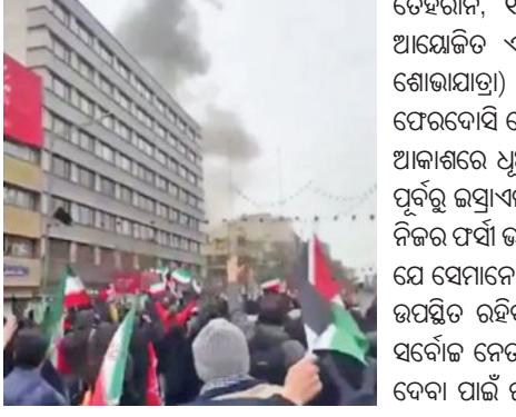
ତେହରାନ, ୧୩।୩(ଏକେନି): ଇରାନ ରାଜଧାନୀ ତେହରାନରେ ଆୟୋଜିତ ଏକ ସରକାରୀ ସମ୍ପର୍କ ପ୍ରଦର୍ଶନ (କୁଦ୍‌ସ ଦିବସ ଶୋଭାଯାତ୍ରା) ସମୟରେ ବିସ୍ଫୋରଣ ଘଟିଛି।