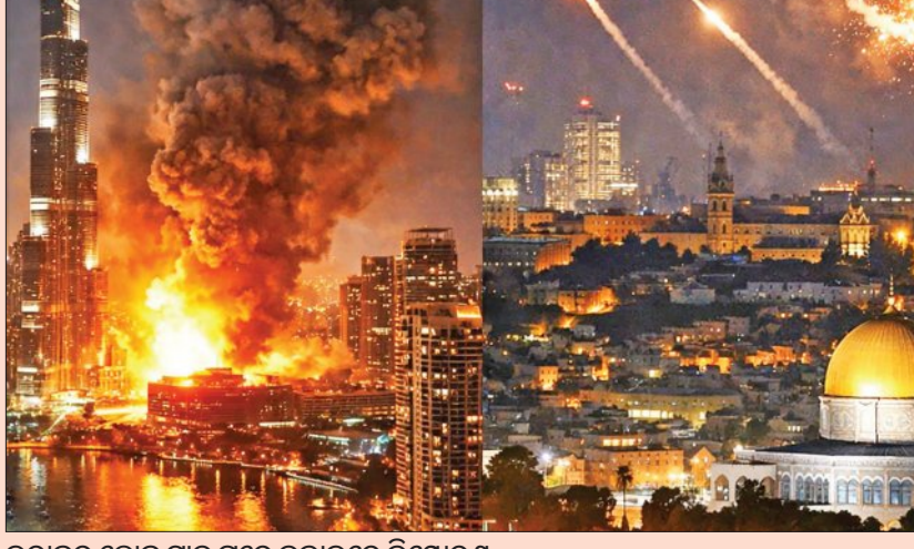
ଇରାନର ଡ୍ରୋନ୍ ମାଡ଼ ପରେ ଦୁବାଇରେ ବିସ୍ଫୋରଣ

ଦୁବାଇ, ୧୨।୩।(ଏକେନ୍ଦ୍ର): ମଧ୍ୟପ୍ରାନ୍ତରେ ଚାଲିଥିବା ଯୁଦ୍ଧ ମଧ୍ୟରେ ଇରାନ ପକ୍ଷରୁ ଉପସାହାରୀୟ ଦେଶଗୁଡ଼ିକ ଉପରେ ଆକ୍ରମଣ କାରି ରହିଛି । ଗୁରୁବାର ଦିନ ଦୁବାଇର ତାଉନଟାଉନ୍ ଅଞ୍ଚଳରେ ଏକ ଡ୍ରୋନ୍ ଆକ୍ରମଣ ହୋଇଥିଲା ସୂଚନା ମିଳିଛି । ବିସ୍ଫୋରଣ ପରେ ସେଠାରେ ଆକାଶରେ ଧୂଆଁ ଦେଖା ଦେଇଥିଲା । ତେବେ ଏଥିରେ କେହି ମୃତ୍ୟୁ ହୋଇ ନଥିବା ଦୁବାଇ ମିଡିଆ ଅପିଏ ତରଫରୁ କୁହାଯାଇଛି । ଏହାପୂର୍ବରୁ ଦୁବାଇ ଉପକୂଳରେ ଏକ କର୍ତ୍ତବ୍ୟର ଜାହାଜ ଉପରେ ଷ୍ଟେପୋଗ୍ରାଫି ମାଡ଼ କରାଯାଇଥିଲା, ଯାହା ଫଳରେ ଜାହାଜରେ ନିଆଁ ଲାଗିଯାଇଥିଲା । କିନ୍ତୁ ଜାହାଜର ସମସ୍ତ କର୍ମଚାରୀ ସୁରକ୍ଷିତ ଅଛନ୍ତି । ଇରାନର ଆକ୍ରମଣ ଯୋଗୁଁ ବାହାରିବ, ଅନ୍ତର୍ଜାତୀୟ ବିମାନବନ୍ଦନ ନିକଟରେ ଥିବା ଏକ ଦ୍ଵୀପରେ ଭୟଭୀତ ଅଗ୍ନିକାଣ୍ଡ ଘଟିଛି । ସେହିକରି କୁଏତ୍ ଏବଂ ଆବାସିକ ବିଶ୍ଵ ଉପରେ ଇରାନର ଡ୍ରୋନ୍ ମାଡ଼ ହୋଇଛି । ସାଉଦି ଆରବ ତାର ରାଜଧାନୀ ରିୟାଡ଼ ଏବଂ ପ୍ରମୁଖ ଟେକ୍ନୋଲୋଜି କ୍ଷେତ୍ରକୁ ଲକ୍ଷ୍ୟ କରି ଆସୁଥିବା ଡ୍ରୋନ୍ଗୁଡ଼ିକୁ ମଧ୍ୟ ଆକାଶରେ ଖସାଇ ଦେଇଛି । ଫେବୃଆରୀ ୨୮ରୁ ଆରମ୍ଭ ହୋଇଥିବା ଏହି ଯୁଦ୍ଧରେ ଉପସାହାରୀୟ ଅଞ୍ଚଳରେ ଏପର୍ଯ୍ୟନ୍ତ ୨୪ ଜଣ ପ୍ରାଣ ହରାଇଲେଣି । ସେପଟେ ଯୁଦ୍ଧ ନିଜର ଆକାଶମାର୍ଗକୁ ସୁରକ୍ଷିତ ରଖିବା ପାଇଁ ତାର ବାୟୁ ପ୍ରତିରକ୍ଷା ପ୍ରଣାଳୀକୁ ସକ୍ରିୟ କରିଛି ।