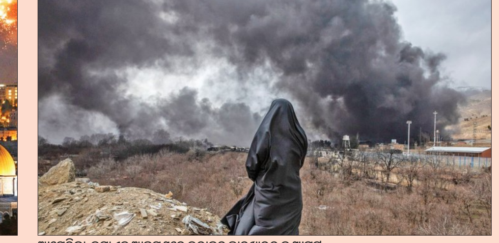
ଆମେରିକା-ଇସ୍ରାଏଲ ଆକ୍ରମଣରେ ଇରାନର ଛାଉଣୀରୁ ଦୃଶ୍ୟପଟ