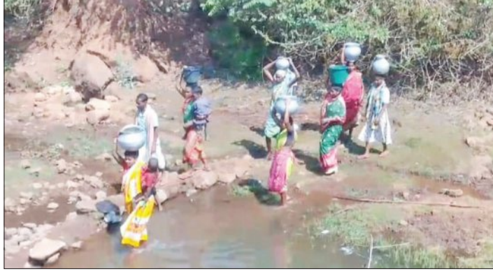
ସାଧାରଣ ଭାବରେ ପିଲା ଠାରୁ ବୟସ୍କ ଗାଁରେ ପିଇବା ପାଣି ସମସ୍ୟା ଲାଗି ରହିଛି। ଲୋକ ପର୍ଯ୍ୟନ୍ତ ବହୁ ଅସୁବିଧା ଭୋଗୁଛନ୍ତି।

ହେଉଛି ଗ୍ରାମବାସୀ। ବାଧ୍ୟ ହୋଇ ନାକ ଓ ବୁଆର ଦୃଷ୍ଟିର ପାଣି ପିଇଛନ୍ତି। ଏଭଳି ସମସ୍ୟା ଭୋଗୁଥିବା ଏକ ଗାଁ ହେଉଛି ପିରିଙ୍ଗିଆ ବ୍ଲକ ପାଇଁ ଉପରସାହି ପଞ୍ଚାୟତର ସବେରା ଗ୍ରାମ। ସବେରା ବ୍ଲକରେ ଏକ ଛୋଟ ପୋଲ କାହିଁକେଇଁ ନାକ ଓ ବୁଆର ଦୃଷ୍ଟିର ପାଣି ପିଇଛନ୍ତି। ତାହା ଭାଙ୍ଗି ଗଲାଣି। ପଲରେ ଆମ୍ବୁଲାଟୁ ସେବା ହେଉ ନି ପଞ୍ଚାୟତ କାର୍ଯ୍ୟାଳୟ ବ୍ଲକ କାର୍ଯ୍ୟାଳୟ, ସ୍କୁଲ କଲେଜ ଯିବାକୁ