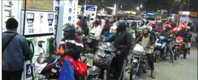
■ ୩ ଦିନ ହେବ ଗ୍ୟାସ୍ ବୁକିଂ ଠପ୍, ଅତୀତ ବକ୍ତିଗଲା ଦର ■ ଗୁଜରାଟ କହିଲେ ଯୋଗାଣ ମନ୍ତ୍ରୀ, ଭୟଭୀତ ନ ହେବାକୁ ପରାମର୍ଶ