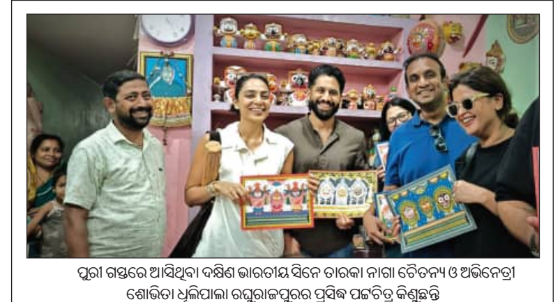
ପୁରୀ ଗସ୍ତରେ ଆସିଥିବା ଦକ୍ଷିଣ ଭାରତୀୟ ବିନେ ତାରକା ନାଗା ଚିତ୍ରନାଟ୍ୟ ଓ ଅଭିନେତ୍ରୀ ଶୋଭିତା ଧୂଳିପାଲ...