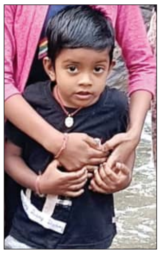
କାବନ ନେଇଗଲେ, ତାହା ଜଣାପଡ଼ି ନଥିବା ବେଳେ ପୁଲିସ୍ ବିଭିନ୍ନ ଦିଗକୁ...