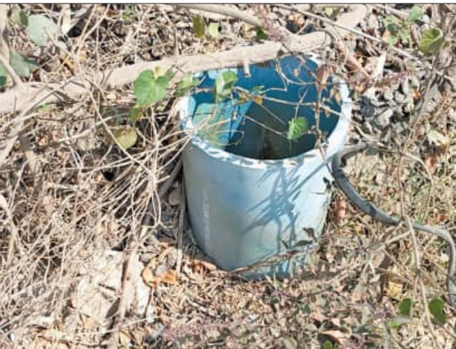
ପିଲିନଥିଲା । ଯାହାଫଳରେ ଏହି ଗ୍ରାମକୁ ନିକଟସ୍ଥ ଗ୍ରାମରେ ବୋରି ଖୋଳାଯାଇ ଜଳ ଯୋଗାଣ ହେଉଥିବା ବେଳେ କିଛିଦିନ ହେବ ମଟର ଖରାପ ହୋଇଯିବାରୁ ପାଣି ନ ପାଇ ଲୋକେ ଅସହ୍ୟ ହୋଇଛନ୍ତି । ଏହି ଗ୍ରାମରେ ବଡ଼ସାହି, ରାଧାକୃଷ୍ଣ ସାହି, ପଦିଆବର ସାହି, ହରିଜନ ସାହିରେ ୧୨ଶହରୁ ଅଧିକ ଲୋକ ବସବାସ କରୁଥିବା ବେଳେ ବର୍ତ୍ତମାନ ପାଣି ପାଇନାହାନ୍ତି । ସେପଟେ ଶାଳିଆ ଡାମ୍ବାମୂଳ ଜଳ ଯୋଗାଣ ପ୍ରକଳ୍ପ ପାଇପ ଲାଇନ ଏହି ଗ୍ରାମ ଦେଇ ଯାଇଥିବା ବେଳେ ଏହି ଗ୍ରାମକୁ ପାଇପ ଲାଇନ ପଡ଼ିବାପରେ ବିଲମ୍ବିତ ହେଉଛି । ପାଣି ପାଇବା ନେଇ ବିଲମ୍ବିତ ମନରେ ସନ୍ଦେହ ସୃଷ୍ଟି ହୋଇଛି ।

ବେଗୁନିଆପଡା, ୧୩ (ସମିପ): ଗ୍ରାସ୍ତ ଆରମ୍ଭରୁ ବିଭିନ୍ନ ସ୍ଥାନରେ ଆରମ୍ଭ ହେଲାଣି ଜଳକଣ୍ଠ । ବେଗୁନିଆପଡା ବ୍ଲକର ବିଭିନ୍ନ ଗ୍ରାମରେ ବର୍ତ୍ତମାନ ଜଳସ୍ତର ଯଥେଷ୍ଟ କମିଯାଇଥିବା ବେଳେ କୂଅ ଓ ପୋଖରୀ ଖୁଣ୍ଟିବାକୁ ବସିଲାଣି । ସେପଟେ ବସୁଥା ଯୋଜନାରେ ବିଭିନ୍ନ ଗ୍ରାମରେ ଜଳ ଯୋଗାଣ ଚାଲିଥିବା ବେଳେ ବେଗୁନିଆପଡା ବ୍ଲକର ଷଷ୍ଠମୂଳ ପଞ୍ଚାୟତରେ କେ. ଶାଳକଣ୍ଠ ଗ୍ରାମରେ ଜଳକଣ୍ଠ ଅସମ୍ଭବ ହୋଇଛି । ଦୀର୍ଘବର୍ଷ ଆଗରୁ ଏହି ଗ୍ରାମରେ ପାଣି ଯୋଗାଣ ହେଉନଥିବା ବେଳେ ଏବେ ମଧ୍ୟ ଏହି କଣ୍ଠ ଆରମ୍ଭ ହୋଇଛି । ଏଠାରେ ପାଣି ପାଇଁ ବହୁତ ବୋରି ଖୋଳା ଯାଇଥିଲେ ବି ସୁଫଳ