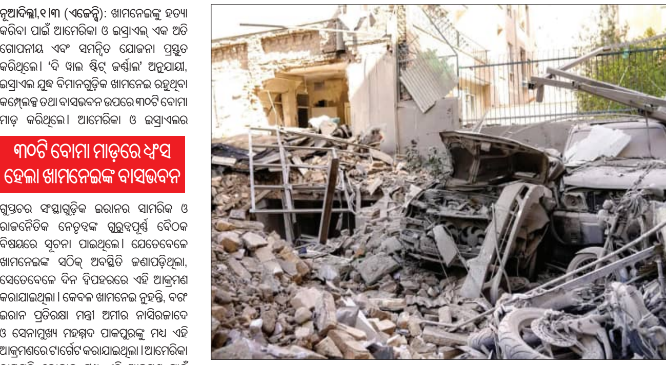
୩୦ଟି ବୋମା ମାଡ଼ରେ ଧ୍ୱସ୍ତ ହେଲା ଖାମନେଇଙ୍କ ବାସଭବନ

ନୁଆଦିଲ୍ଲା, ୧୩ (ଏକେନି): ଖାମନେଇଙ୍କୁ ହତ୍ୟା କରିବା ପାଇଁ ଆମେରିକା ଓ ଇସ୍ରାଏଲ ଏକ ଅତି ଗୋପନୀୟ ଏବଂ ସମ୍ପୂର୍ଣ୍ଣ ଯୋଜନା ପ୍ରସ୍ତୁତ କରିଥିଲେ । 'ଦି ଖାଲ ଷ୍ଟ୍ରିକ୍ ଡାଉନ୍' ଅନୁଯାୟୀ, ଇସ୍ରାଏଲ ଯୁଦ୍ଧ ବିପ୍ଳବଗୁଡ଼ିକ ଖାମନେଇଙ୍କୁ ଉଦ୍‌ଘୋଷଣା କଲେବଳ ତଥା ବାସଭବନ ଉପରେ ୩୦ଟି ବୋମା ମାଡ଼ କରିଥିଲେ । ଆମେରିକା ଓ ଇସ୍ରାଏଲର ଗୁପ୍ତଚର ସଂସ୍ଥାଗୁଡ଼ିକ ଇରାନର ସାମରିକ ଓ ରାଜନୈତିକ ନେତୃତ୍ୱକୁ ଗୁରୁତ୍ୱପୂର୍ଣ୍ଣ ବୈଠକ ବିଷୟରେ ସୂଚନା ପାଇଥିଲେ । ଯେତେବେଳେ ଖାମନେଇଙ୍କ ସଠିକ୍ ଅବସ୍ଥିତି ଜଣାପଡ଼ିଥିଲା, ସେତେବେଳେ ଦିନ ଦ୍ୱିପହରେ ଏହି ଆକ୍ରମଣ କରାଯାଇଥିଲା । କେବଳ ଖାମନେଇ ନୁହଁନ୍ତି, ବରଂ ଇରାନ ପ୍ରତିରକ୍ଷା ମନ୍ତ୍ରୀ ଅମୀନ ନାସିରଜାଦେ ଓ ସେନାମୁଖ୍ୟ ମହମ୍ମଦ ପାକପୁରକୁ ମଧ୍ୟ ଏହି ଆକ୍ରମଣରେ ଟାର୍ଗେଟ କରାଯାଇଥିଲା । ଆମେରିକା ରାଷ୍ଟ୍ରପତି ଡୋନାଲ୍ଡ ଟ୍ରମ୍ପ ଏହି ଆକ୍ରମଣ ପାଇଁ ନିର୍ଦ୍ଦେଶ ଦେଇଥିଲେ । ଗୁପ୍ତଚର ରିପୋର୍ଟ ମୁତାବକ, ଇରାନ ଆମେରିକା ଯାତ୍ରା ଉପରେ ଆକ୍ରମଣ ଯୋଜନା କରୁଥିଲା । ତାଙ୍କର ଆମେରିକା ଏହି ପଦକ୍ଷେପ ନେଇଥିଲା । ଇରାନ ଖାମନେଇଙ୍କ ମୃତ୍ୟୁକୁ ନିଶ୍ଚିତ କରିବା ସହ ୪୦ ଦିନିଆ କାତାୟ ଶୋକ ଘୋଷଣା କରିଛି । ଖାମନେଇଙ୍କ ମୃତ୍ୟୁ ପରେ ଇରାନ ପଶ୍ଚିମ ଏସିଆ ତଥା ମଧ୍ୟପ୍ରାଚ୍ୟରେ ଥିବା ଆମେରିକା ସାମରିକ ଯାତ୍ରାଗୁଡ଼ିକ ଉପରେ ଆକ୍ରମଣ କରିବାକୁ ଚେତାବନା ଦେଇଛି । ଏହାର ଜବାବରେ ଡୋନାଲ୍ଡ ଟ୍ରମ୍ପ କହିଛନ୍ତି ଯେ ଯଦି ଆମେରିକା ଓ ଇସ୍ରାଏଲ ଉପରେ ଆକ୍ରମଣ ହୁଏ, ତେବେ ଇରାନ ପୂର୍ବରୁ କେବେ ଦେଖି ନଥିବା ଭଳି ଭୟଙ୍କର ପରିଣାମ ଘୋଷଣା କରିବେ ।