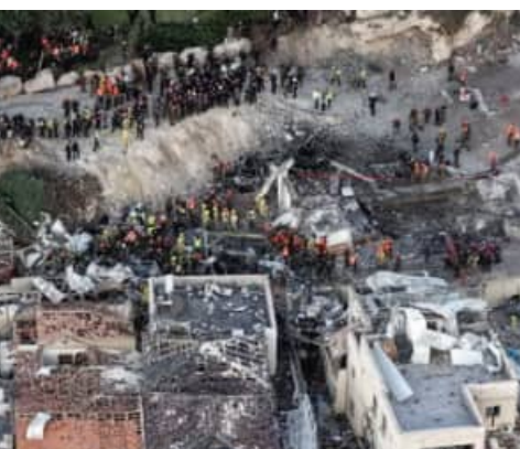
ଭୟଙ୍କର ଆକ୍ରମଣ ଅଭିଯାନ ଆରମ୍ଭ କରିବୁ: ଇରାନ ଯୁଦ୍ଧଯୋଗୁ 'ଆବାହାମ୍ ଲିକନ୍' ଉପରେ କ୍ଷେପଣାସ୍ତ୍ର ମାଡ଼ ଇରାନ ଉପରେ ଆକ୍ରମଣକୁ ଚୀନ, ରଷ୍ଟ୍ର, ଇ.କୋରିଆର ନିନ୍ଦା ଅନ୍ତରାଷ୍ଟ୍ରୀୟ ସମ୍ପର୍କକୁ ନଷ୍ଟ କରିଛି ଆମେରିକା: ଚୀନ ଖାମନେଇଙ୍କ ହତ୍ୟା ବିରୋଧରେ ବିଭିନ୍ନ ଦେଶରେ ବିକ୍ଷୋଭ