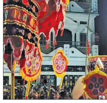
ରାତିରେ ସୁସଜ୍ଜିତ ଖରୁକିରେ ନିଜ ନିଜ ମନ୍ଦିରକୁ ବାହାରି ଗ୍ରାମର ପ୍ରତ୍ୟେକ ଦୁଆରୁ ଭୋଗ ଖାଇ ଯାତ୍ରାପଦାରେ ହରିହର ଭେଟ ହୋଇ ସମସ୍ତ ଗ୍ରାମ ପରିକ୍ରମା କରି

କୋଦଳା, ୧୩ (ସମିପ): କୋଦଳାରେ ଧୂଳି ଧାମରେ ଚାଲିଛି ଏତିହାସିକ ଦୋଳଯାତ୍ରା । ଫେବୃଆରୀ ୨୬ରୁ କୋଦଳା ବିଜେ ଆରାଧ୍ୟ ଦେବତା ବାବା ଦକ୍ଷିଣର ମହାଦେବ ଏବଂ ଜଗନ୍ନାଥ ପ୍ରତ୍ୟେକ ଦିନ ବିଲମ୍ବିତ ନିଜ ମନ୍ଦିରକୁ ଫେରୁଛନ୍ତି । ଆସନ୍ତାକାଲି ଗ୍ରହଣ ଏବଂ ଆଜି ପକ୍ଷିଭୋଗ ଲାଗିବା କାର୍ଯ୍ୟକ୍ରମ ଥିବାରୁ ମହାପ୍ରଭୁଙ୍କୁ ନିର୍ଦ୍ଦିଷ୍ଟ ସମୟ ପୂର୍ବରୁ ମନ୍ଦିରକୁ ବାହାରି ଗ୍ରାମ ପରିକ୍ରମା କରିବେ । ଭୋଗ ସମୟରେ ନିଜ ନିଜ ଜାଗାରେ ରାଜାଅଗ୍ନିରେ ଯୋଗଦେଇ ନିଜ ନିଜ ମନ୍ଦିରକୁ ଫେରିବା କାର୍ଯ୍ୟକ୍ରମ ସ୍ଥିର ହୋଇଛି । ବାଣ ପୁଟାଇବାରେ ପ୍ରଶାସନର କଟକଣା ଥିବାରୁ ଆଚରଣାବଳି ପ୍ରଦର୍ଶନ ବନ୍ଦ ରହିପାରେ । ତେବେ ବାଣଯାତ୍ରା ବନ୍ଦ ହୋଇଥିଲେ ମଧ୍ୟ