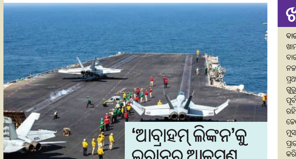
‘ଆବାହମ୍ ଲିଙ୍କନ’କୁ ଇରାନର ଆକ୍ରମଣ