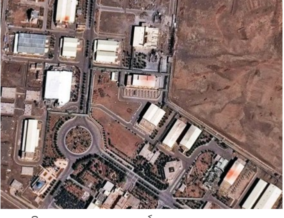
ଏହି କୁମ୍ଭାଗତ ଆକ୍ରମଣରେ ଏପର୍ଯ୍ୟନ୍ତ ୧, ୦୦୦ରୁ ଅଧିକ ଲୋକ ପ୍ରାଣ ହରାଇଛନ୍ତି। ସେହିପରି ୧୦ଲକ୍ଷରୁ ଅଧିକ ନିଜ ଘରଘାର ଛାଡ଼ି ବିସ୍ଥାପିତ ହୋଇଛନ୍ତି। ହିଜ୍‌କବୁଲ୍ଲା ମଧ୍ୟ ଇସ୍ରାଏଲ ଉପରକୁ ପଲଟା ରକେଟ୍ ମାଡ଼ କରିଛି।

■ ଲେବାନନରେ ଇସ୍ରାଏଲର ଭୟଙ୍କର ବୋମା ମାଡ଼ ■ ଆମେରିକା ସହାୟତା ମାଗିବା ଖବରକୁ ଭାରତର ପ୍ରତ୍ୟାଖ୍ୟାନ