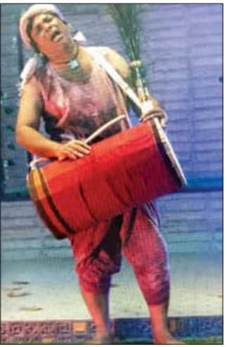
ରିପର୍ଟ ଅଧିକାର ପକ୍ଷରୁ ପ୍ରକୃତି ସହିତ ନାଟକର ଧର୍ମ ପ୍ରଦର୍ଶନ।

ବେଙ୍ଗାଳୀ, ୧୬ ମାର୍ଚ୍ଚ (ସମ୍ବିଧ): ଦେଓପଡ଼ାରେ ବାଜିଲା ଭୋଲିଆର ଭୋଲ।