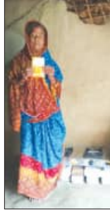
୮ ବର୍ଷର ସଂଗ୍ରାମ, ଦିନକରେ ସମାଧାନ

ଆଧାର କାର୍ଡ ଧରି ଜନସେବା କେନ୍ଦ୍ର ଯାଇ ଯାଞ୍ଚ କରିବା ବେଳେ ତାଙ୍କ ନାମରେ ୨୦୧୮ରୁ ଉତ୍ପାଦନା ଗ୍ୟାସ ହତୁପ ଘଟଣା ଖବର ପ୍ରକାଶ ପରେ ମିଳିଲା ସଂଯୋଗ। ଖବର ପ୍ରକାଶ ପରେ ମିଳିଲା ସଂଯୋଗ।