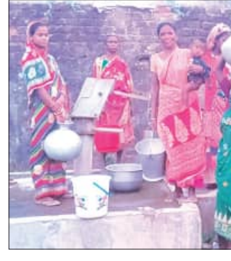
ସାହିକୁ ରାସ୍ତା ନାହିଁ କି ବିଦ୍ୟୁତ୍ ମଧ୍ୟ ନାହିଁ । ସାହିବାସୀ ଏକପ୍ରକାର ଅଧିକାଂଶ ଜିବନ ବିଚାରଛାଡ଼ି କହିଲେ ଅତ୍ୟନ୍ତ ହେବ ନାହିଁ । ସଂସାହେଲେ ସମଗ୍ର ଅଞ୍ଚଳଟି ଅନ୍ଧକାରରେ

ଜଳେଶ୍ୱର, ୩୦୩୩ (ସମ୍ପାଦକ) : ଗୋବରଦପା ଫର୍ମାଘର ଦଶହରା ପଡ଼ିଆ ଆଦିବାସୀ ସାହିରେ ନାହିଁ ପାନୀୟ ଜଳ ସୁବିଧା । ସମସ୍ତଙ୍କ ପାଇଁ ପାଣି ପାଣିର ବ୍ୟବସ୍ଥା କରାଯାଉଥିବା ବେଳେ ସେମାନଙ୍କ ଲାଗି ତାହା ସାତ ସପନ ।