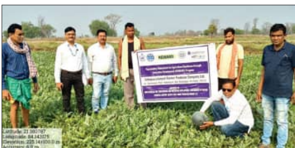
ସମ୍ବଲପୁର, ୨୬।୩। (ସମିପ)

ଏପିକିଟିଏ ଆଞ୍ଚଳିକ ମୁଖ୍ୟ ଓ ଅନ୍ୟ ଅଧିକାରୀମାନେ ଆଜି ସବୁଜ ସମାପନପାଳି କୃଷକ ଉପାଦାନ କମ୍ପାନୀ ଲିଃ (ଏପିପିସି)ର କ୍ଷେତ୍ର ପରିଦର୍ଶନ କରିବାସହ ରସାୟନ ସୁଯୋଗକୁ ନିଶ୍ଚିତ କରିଛନ୍ତି। ଏହି ଅଞ୍ଚଳର କୃଷି ସମାବଦାନକୁ ପ୍ରୋତ୍ସାହନ ସ୍ୱରୂପ, ଏପିକିଟିଏ ଆଞ୍ଚଳିକ ମୁଖ୍ୟ ସାତାକାନ୍ତ ମଣ୍ଡଳ, ଆଇଆଣ୍ଟିସି