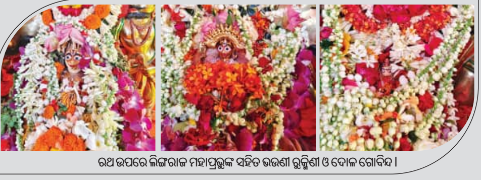
ରଥ ଉପରେ ଲିଙ୍ଗରାଜ ମହାପ୍ରଭୁଙ୍କ ସହିତ ଭକ୍ତମାନଙ୍କୁ ରୁକୁଣା ଓ ବୋକ ଗୋବିନ୍ଦ।