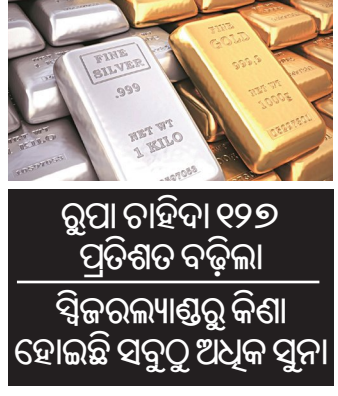
ରୁପା ବାହାର ୧୨୨ ପ୍ରତିଶତ ବଢ଼ିଲା ବିକ୍ରୟରୁ ଉପରେ ସୁନା ଆମଦାନୀରେ ୮୩% ପ୍ରତିଶତରୁ ଅଧିକ ବୃଦ୍ଧି ଦେଖିବାକୁ ମିଳିଛି।

ନୂଆଦିଲ୍ଲୀ, ୧୭/୨ (ଏକେନିଉ): ସୁନା ଓ ରୁପା ପ୍ରତି ଭାରତୀୟ ଦୁର୍ବଳତା ଘଟି ମଧ୍ୟରେ ବୃଦ୍ଧି ରେକର୍ଡ୍ ଭାଙ୍ଗିଛି। ଏକ ସରକାରୀ ତଥ୍ୟ ଅନୁସାରେ, ଜାତୀୟତାରେ ସୁନା ଆମଦାନୀ ୩୪୯.୨୨ ପ୍ରତିଶତ ବୃଦ୍ଧି ପାଇ ୧୨ ବିଲିୟନ ଡଲାର ହୋଇଛି। କେବଳ ସୁନା ନୁହେଁ, ଏହି ଅବସ୍ଥାରେ ରେକର୍ଡ୍ ପରିମାଣର ରୁପା ଆମଦାନୀ ମଧ୍ୟ ହୋଇଛି। ଜାତୀୟତାରେ ରୁପା ଆମଦାନୀ ୧୨୨ ପ୍ରତିଶତ ବୃଦ୍ଧି ପାଇ ୨ ବିଲିୟନ ଡଲାର ଅତିକ୍ରମ କରିଛି। ଏହି ପରିସଂଖ୍ୟାନ ସ୍ପଷ୍ଟ କରୁଛି ଯେ ବଜାରରେ ମୂଲ୍ୟବାନ ଧାତୁର ବାହାରରେ ଜବରଦସ୍ତ ବୃଦ୍ଧି ହୋଇଛି। ଏହି ବାହାର ବୃଦ୍ଧି ଯୋଗୁ ଦେଶର ବାଣିଜ୍ୟ ନିଅଣ୍ଟ ମଧ୍ୟ ବଢ଼ିଛି। ତଥ୍ୟ ଅନୁସାରେ ବିବାହ ଓ ନିବେଶ ପାଇଁ ଭାରତୀୟ ମଧ୍ୟରେ ମୂଲ୍ୟବାନ ଧାତୁର କ୍ରେୟ କମି ନାହିଁ। ସୁନା ଆମଦାନୀରେ ଭାରତର ସବୁଠୁ ଅଧିକ ଭରସା ବିକ୍ରୟରୁ ଉପରେ ରହିଛି। ଭାରତ ନିଜ ସୁନା ବାହାରକୁ ପୂରଣ କରିବା ପାଇଁ ବିକ୍ରୟରୁ ଉପରେ ସବୁଠୁ ଅଧିକ ନିର୍ଭର। ଜାତୀୟତା ମାସରେ ବିକ୍ରୟରୁ ଉପରେ ସୁନା ଆମଦାନୀରେ ୮୩% ପ୍ରତିଶତରୁ ଅଧିକ ବୃଦ୍ଧି ଦେଖିବାକୁ ମିଳିଛି। ବିଶେଷତା ମଧ୍ୟରେ ବିବାହ ରତ୍ନାମୟ ଓ ସୁରକ୍ଷିତ ନିବେଶର ବହୁତ୍ୱ ବାହାର ବାଣିଜ୍ୟ ବିଦେଶରୁ ଏବେ ପରିମାଣରେ ସୁନା-ରୁପା ଆମଦାନୀ କରାଯାଇଛି। ଭାରତ