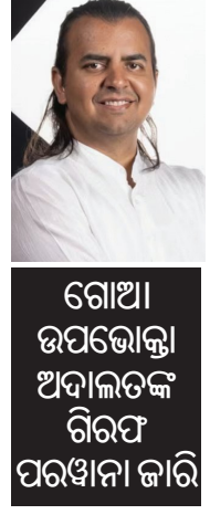
ଗୋଆ ଉପରୋକ୍ତ ଅପାତଳ ଗିରଫ ପରଖାମା କାରି