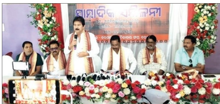
ବାଖଲ କରିବାକୁ ନିୟମ କରିଛନ୍ତି। ତେବେ ମଧ୍ୟ ସ୍ୱଳ୍ପ ସାଧନଧାରୀ ଠିକାଦାରଙ୍କ ପକ୍ଷେ କାମ କରିବା ଅସମ୍ଭବ ହୋଇ ପଡ଼ିବ।

ହାତେଇ ନିମ୍ନ ମାନର କାର୍ଯ୍ୟ ହେବା ସମ୍ଭାବନା ହୋଇଛି। ଯଦି ସରକାର ଏଥିପାଇଁ ଠିକାଦାର ମାନକୁ ବଳକା ମୂଲ୍ୟ ସରକାରଙ୍କ ପାଖେ