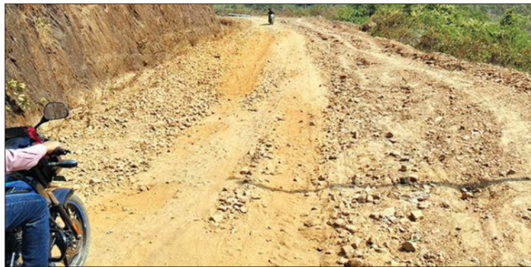
ବଫଲା ମାଳି ପ୍ରଭାବିତ ଅଞ୍ଚଳର ଦୟନୀୟ ଚିତ୍ର

ଦିନ ଥିଲା ସୂର୍ଯ୍ୟଗଡ଼ ଗାଁ ଏକ ଭୂଗର୍ଭ ମୁହଁ ଏକ ଅଭେଦ୍ୟ ଅଞ୍ଚଳ ଭାବେ ପରିଚିତ ଥିଲା। ବଞ୍ଚାଇବ ଭରା ବଫଲା ମାଳି ଏବଂ ଘଞ୍ଚ କଞ୍ଚଳ ବାହା ପରିବେଷିତ ଏହି ଗାଁରେ ସୂର୍ଯ୍ୟଲୋକ ବିଳମ୍ବରେ ପହଞ୍ଚିଥିବା ବେଳେ ସୂର୍ଯ୍ୟାସ୍ତ ମଧ୍ୟ ଶୀଘ୍ର ହୋଇଥିଲା।