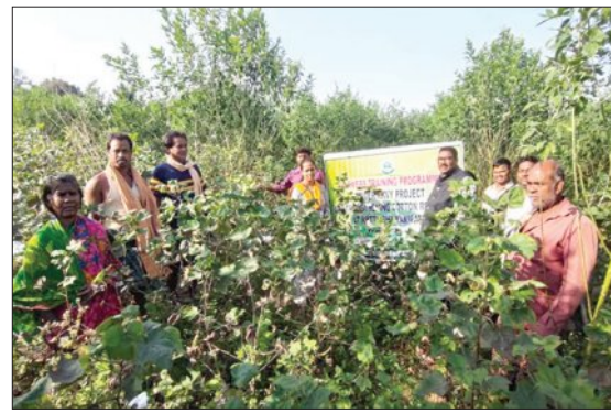
୧୦ଲକ୍ଷରୁ ଉର୍ଦ୍ଧ୍ୱ କୁଇଣ୍ଟାଲ ଚାଷୀଙ୍କ ୮ ଲକ୍ଷରୁ ଉର୍ଦ୍ଧ୍ୱ ପଡ଼ିଛି

ସିସିଆଇର ଅଧିକାରୀଙ୍କୁ ପରାବିରାକୁ ୨ଟି ମଣ୍ଡିରୁ ଏପର୍ଯ୍ୟନ୍ତ ୨ଲକ୍ଷ ୪୦ ହଜାର ୬୬୨ କୁଇଣ୍ଟାଲ କପା କିଣା ହୋଇଛି ବୋଲି କହିଥିଲେ। ସିସିଆଇ ପୋର୍ଟାଲ ଏବେ ମଧ୍ୟ ଖୋଲା ଅଛି ଚାଷୀମାନେ ପଞ୍ଜିକରଣ କରି ବିକ୍ରି କରିପାରିବେ। କିନ୍ତୁ ଆସନ୍ତା ଫେବୃଆରୀ ୨୭ତାରିଖରେ ଜିଲ୍ଲାରେ ମଣ୍ଡି ବନ୍ଦ ହେବାକୁ ସ୍ଥିର