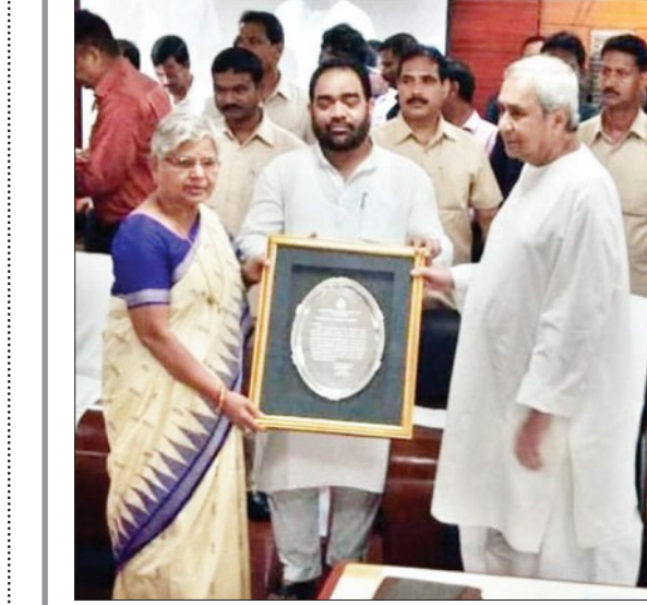
ଉତ୍କଳମଣୀ ପଣ୍ଡିତ ଗୋପବନ୍ଧୁ ସମ୍ମାନ ଗ୍ରହଣ ଅବସରରେ

ନିମନ୍ତେ ଏବଂ ଶୋକସନ୍ତପ୍ତ ପରିବାରକୁ ଆପଣ ଯଥାର୍ଥ୍ୟ ଓ ସାହସ ନିମନ୍ତେ ମୁଁ ସମଲେଖଣୀ ଓ ପ୍ରକ୍ତ ଜଗନ୍ନାଥଙ୍କ ନିକଟରେ ପ୍ରାର୍ଥନା କରୁଛି।