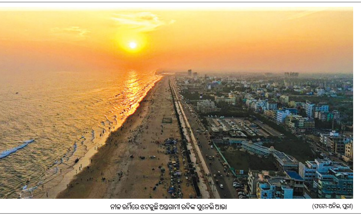
ନାଳ ଭର୍ମିରେ ଝେଙ୍କୁଛି ଅଷ୍ଟଗାମୀ ରବିକ ସୁନେଲି ଆବା

ତଦନୁଯାୟୀ ଦରମା ପ୍ରଦାନ କ୍ଷେତ୍ରରେ ଅତ୍ୟାଧିକାରୀ ସୃଷ୍ଟି ନେଇ ଶିକ୍ଷକ ଓ କର୍ମଚାରୀ ମହଲରେ ତୀବ୍ର ଅସନ୍ତୋଷ ପ୍ରକାଶ ପାଇଥିଲା। ଶିକ୍ଷକ କର୍ମଚାରୀଙ୍କ ସମକ୍ଷରେ ରାଜ୍ୟ ଶିକ୍ଷା ଟ୍ରିୟୁନାଲଙ୍କ ଆଦେଶ ବିରୋଧରେ ରାଜ୍ୟ ସରକାର ହାଇକୋର୍ଟଙ୍କ ଦ୍ଵାରରେ ଶତପଥାଳ ଅପାଳିତ ଉଚ୍ଚଅପିଲର ଶୁଣାଣି କରି ଗତ ୨୦୨୫ ମାର୍ଚ୍ଚ ୧୯ତମ ପ୍ରକାଶିତ ଆଦେଶକୁ ଆଧାର କରି ଦରମା, ପେନସନ୍ ଓ ଅନ୍ୟାନ୍ୟ ସୁବିଧା ଦେବାକୁ ଆଦେଶ ଦେଇଥିଲେ।