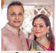
ବଡ଼ିଲା ଅନିଲ ଅମ୍ବାନୀଙ୍କ ଅଭିଯୋଗ