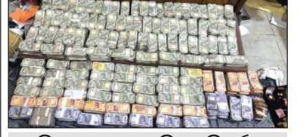
ଗିରଫ ହେଲେ ଖଣି ଉପନିର୍ଦ୍ଦେଶକ ଟଙ୍କା ଖଣି ଅଧିକାରୀ

ଶ୍ରୀ ମହାନ୍ତି ନିକଟରେ କାରୁଆରୀ ୭ ଚାରିଖରେ କଟକ ସର୍କଲର ଉପନିର୍ଦ୍ଦେଶକ ଭାବେ ଦାୟିତ୍ୱ ଗ୍ରହଣ କରିଥିଲେ। ଭିଜିଲାନ୍ସ ପକ୍ଷରୁ ଏହି ମାମଲାରେ ଭ୍ରଷ୍ଟାଚାର ନିରୋଧ ଆଇନ ଅନୁସାରେ ମାମଲା ରୁଜୁ କରାଯାଇ ଚଢ଼ଉ ଜାରି ରହିଛି ଏବଂ ଆଉ ବହିଷ୍କୃତ ସମ୍ପତ୍ତି ଠୁଳି ଦିଗରେ ଅଧିକ ଖୋଜତା କରାଯାଉଛି।