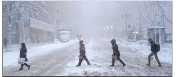
'ଫ୍ଲାଇଂ ଆସାର' ଏ ନେଇ ସୂଚନା ଦେଇଛି। ଜାତୀୟ ପାଣିପାଗ ସେବା ଦେଖିଥିବା ସୂଚନା ଅନୁଯାୟୀ, ରୋଡ଼ ଆଇଲଣ୍ଡ ଓ ମାୟୁରୁସେଣ୍ଟ ପୃଷ୍ଠା-୭

■ ଦୁଧର୍ମ, ୨୫ 1୨ (ଏସିଆ): ଆମେରିକାରେ ଦେଖାଦେଇଥିବା ଭୟଙ୍କର ବରଫ ଝଡ଼ କାରଣରୁ ଜନଜୀବନ ଅସ୍ତବ୍ୟସ୍ତ ହୋଇପଡ଼ିଛି। ଦୁଷ୍ଟାର ଝଡ଼ କାରଣରୁ ବିଭିନ୍ନ ବିମାନବନ୍ଦର ରେନଡେ ବନ୍ଦ ରହିଛି। ବହୁ ଅଞ୍ଚଳରେ ■ ୧୧,୦୦୦ ବିମାନ ବାଟିଲ, ଅନ୍ଧାରରେ ୫ ଲକ୍ଷରୁ ଅଧିକ ପରିବାର ■ ୧୫୩ ବର୍ଷ ପରେ ପ୍ରଥମଥର ପାଇଁ ଖବରକାଗଜ ଛପା ହେଲା