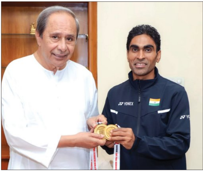
ବାହାରିନେଇ ଅନୁଷ୍ଠିତ ବିଶ୍ୱ ପାଠ୍ୟ ବିଦ୍ୟାଳୟର ଶ୍ରେଣୀଗତ ଉତ୍ତମ କ୍ରୀଡ଼ାକାରୀଙ୍କୁ ପୁରସ୍କାର କରାଯାଇଛି।

■ ଗସ୍ତକୁ ପିକନିକ୍ କହି ସମାଲୋଚନା କଲା ମହାନଦୀ ବନ୍ଧାଓ ଆନ୍ଦୋଳନ ■ ମଧ୍ୟବର୍ତ୍ତୀକାଳୀନ ରାୟଦ୍ୱାରା ଆବଶ୍ୟକ ପାଣି ଛାଡ଼ିବାକୁ ଦାବି ■ ୧୦ ସ୍ଥାନରେ ସତ୍ୟାଗ୍ରହ କରିବ ମହାନଦୀ ବନ୍ଧାଓ ଆନ୍ଦୋଳନ