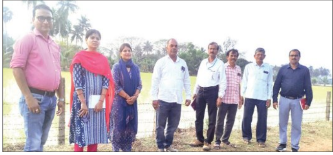
ଚାଷୀ ସେମାନେ କରୁଥିବା ବିଭିନ୍ନ ପ୍ରସଙ୍ଗର ରୋଗପୋକ ଓ ହାହାର ନିରାକରଣ ଉପରେ କିଭଳି ଗୁରୁତ୍ଵ ଦେବା ସମ୍ପର୍କରେ