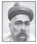
ଧର୍ମ ହିଁ ଜୀବନର ବାସ୍ତବତା, କିନ୍ତୁ ଦେବ ପୂଜା ପୂର୍ବରୁ ପ୍ରାମାଣ୍ୟ ମାନବ ସମାଜର ସେବା ହିଁ ଆମର କର୍ତ୍ତବ୍ୟ । -ଲୋକମାନ୍ୟ ବାଲୁ ଗଙ୍ଗାଧର ତିଳକ