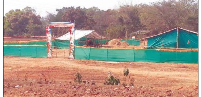
ପ୍ରକଳ୍ପକୁ ହସ୍ତାନ୍ତର କରାଯାଇଥିବା ବେଳେ ବାଡ଼ି ପଡ଼ିଆର ବନମାଳା ଅଂଶକୁ ଏକାଧିକ ସ୍ଥାନକୁ ସ୍ଥାନାନ୍ତର ଗ୍ରାମର ଜବରଦଖଲକାରୀ ବାଡ଼ି କରି ନିଜ ନିଜ ଅଧିକାରରେ