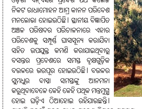
ଓଡ଼ିଶା ବିଜ୍ଞାପିତ ଅଞ୍ଚଳ ପରିଷଦ ପରିଚାଳନାରେ ଏହାର ପରିବେଶକୁ ସୁସ୍ୱୀକ୍ଷ୍ୟ କରାଯିବ। ସହିତ ଉପଯୁକ୍ତ କମିଟି କରାଯାଇଥିବାରୁ ବସନ୍ତର ପ୍ରଦେଶରେ ସମସ୍ତ କୃଷକଙ୍କୁ ବଜାରରେ ଭରପୁର ହୋଇଉଠିବ। ବଜାରର ସୁମଧୁର ବାସ୍ନା ସମସ୍ତଙ୍କୁ ଆନନ୍ଦନା କରୁଥିବାବେଳେ କେହି କେହି ପଥକ ମନ୍ତ୍ରମୁଗ୍ଧ ହୋଇ ଘଡ଼ିଏ ଠିଆହୋଇ ରହିପାରନ୍ତି। ଯାହାକି ଓଡ଼ିଶା ସହର ମଧ୍ୟକୁ ପ୍ରଦେଶ ନିମନ୍ତେ ସମସ୍ତଙ୍କୁ ଆକର୍ଷଣ କରିବା ପରି ମନେ ହେଉଛି। ଅନ୍ୟପକ୍ଷରେ ସାରା ଓଡ଼ିଶା ତଥା ଭାରତ ବର୍ଷର ଅନେକ ରାଜ୍ୟରେ ପରିଚିତ ଲାଭ କରିଥିବା ଏହି ସମସ୍ତ ସମସ୍ତ କର୍ମଚାରୀଙ୍କୁ ପ୍ରମୋଦିତ କରିବା ପାଇଁ ଉଦ୍ଦେଶ୍ୟ ରଖି ଓଡ଼ିଶା ବିଜ୍ଞାପିତ ଅଞ୍ଚଳ ପରିଷଦର ଉଦ୍ଦେଶ୍ୟ ପଥକରେ ରହିଥିବା ରାମ ସାଗର ପାର୍କକୁ ବୁଲି ବାକୁ କେହି

କରାଯାଇଛି। ସତର କୁଣ୍ଡ ମାନଙ୍କରେ ବିଭିନ୍ନ ପ୍ରକାରର ପୁଲଗଛ ଦର୍ଶକ ମାନଙ୍କୁ ଅଧିକ ଆକୃଷ୍ଟ କରିବାରେ ସହାୟକ ହୋଇପାରିବ। ଏବେ ପ୍ରତ୍ୟହ ରାଜ୍ୟର ବିଭିନ୍ନ କ୍ଷେତ୍ରରୁ ପର୍ଯ୍ୟଟକ ମାନେ ଭ୍ରମଣରେ ବାହାରି ଓଡ଼ିଶା