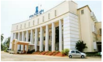
କାଳିଠୁ ବିଧାନସଭାର ବଜେଟ୍ ଅଧିବେଶନ