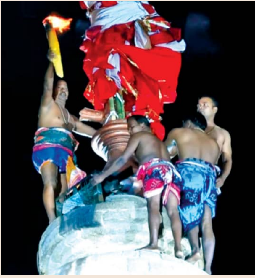
ସଅଳ ଉଠିଲା ଶ୍ରୀଲିଙ୍ଗରାଜଙ୍କ ମହାଦୀପ