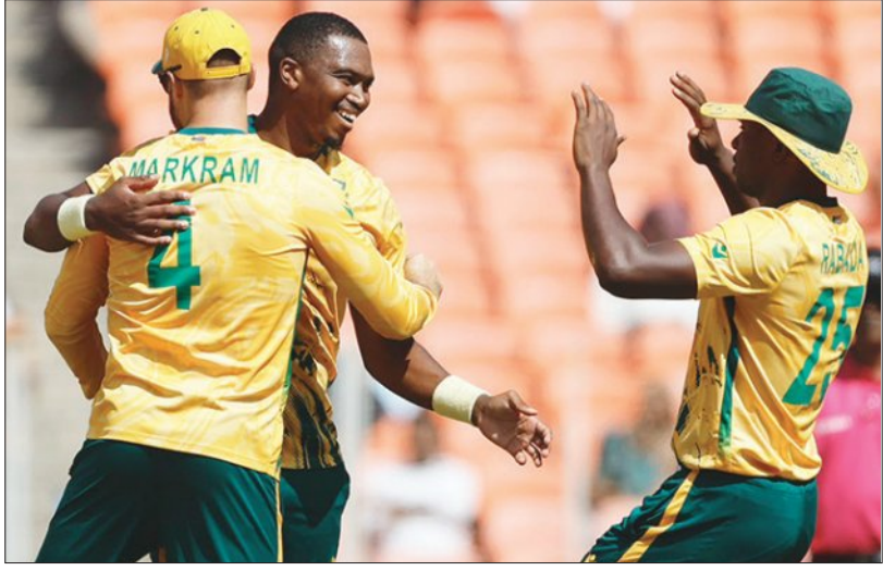
ଅହମ୍ମଦାବାଦ, ୧୧/୧୨ (ଏକେଡି)

ଟି-୨୦ ବିଶ୍ୱକପ ଇତିହାସର ସବୁଠାରୁ ରୋମାଞ୍ଚକ ମ୍ୟାଚ୍ ରୂପରେ ଅହମ୍ମଦାବାଦର ନରେନ୍ଦ୍ର ମୋଦୀ ଷ୍ଟାଡ଼ିୟମରେ ଦେଖିବାକୁ ମିଳିଛି । ଗୁପ୍-ଡି-୧ ଏହି ମ୍ୟାଚରେ ଦକ୍ଷିଣ ଆଫ୍ରିକା ରୋମାଞ୍ଚକ ଭାବେ ଦ୍ୱିତୀୟ ସ୍କୂପର୍ ଓଭରରେ ଏସିଆ ମହାଦେଶର ଉପାନ୍ତମାନଙ୍କ ଆଫଗାନିଷ୍ଟାନକୁ ପରାସ୍ତ କରିଛି । ଏହି ମ୍ୟାଚ ପ୍ରଥମେ ଟାଇ ରହିଥିଲା । ଏହାପରେ ପ୍ରଥମ ସ୍କୂପର୍ ଓଭର ମଧ୍ୟ ଟାଇରେ ସମାପ୍ତ ହୋଇଥିଲା । ଶେଷରେ ଚିତାକର୍ଷକ ୨ୟ ସ୍କୂପର୍ ଓଭରରେ ଦକ୍ଷିଣ ଆଫ୍ରିକା ମାତ୍ର ୪ ରନରେ ଆଫଗାନିଷ୍ଟାନକୁ ମାର୍ ବେଇଥିଲା । ଆଫଗାନିଷ୍ଟାନର ରହମାନ୍ନୁଲ୍ଲା ଗୁରବାଜ୍ ୨ୟ ସ୍କୂପର୍ ଓଭରରେ ହାତୀକ ଛକା ମାରିଥିଲେ ମଧ୍ୟ ଦକ୍ଷିଣ ଆଫଗାନିଷ୍ଟାନ ୨ଟି ବଲ୍ ପୂର୍ବରୁ ସମାନ ୧୮ ଓ ୨ ରନ କରି ଜିତିପାରି ନ ଥିଲେ । ଲୁନଗି ଏନଗିତିକୁ ଗାଟି ଓଏକେଟ୍ ହୋଇଥିଲେ । ପୂର୍ବରୁ ପ୍ରଥମ ମ୍ୟାଚରେ କାନାଡାକୁ ହରାଇଥିବା ଆଫ୍ରିକା ଏହା ୨ୟ ବିଜୟ ହୋଇଛି ।