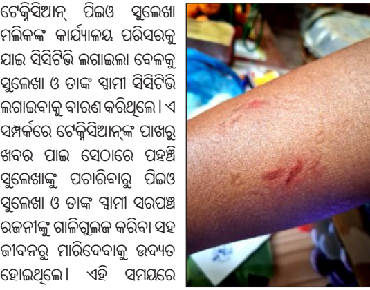
ପିଇଓଙ୍କ କାମୁଡ଼ାରେ ସରପଞ୍ଚ ଆହତ ହୋଇଥିଲେ। ଏହି ସମୟରେ ଡାକ୍ତରୀ ଚିକିତ୍ସା କରାଯାଇଥିଲା।

ଛୋଟି ସରପଞ୍ଚ ରଜନୀ ମିଲିକ ଅଭିଯୋଗ ଅନୁଯାୟୀ, ସରକାରୀ ନିୟମ ଅନୁସାରେ ପଞ୍ଚାୟତ କାର୍ଯ୍ୟାଳୟରେ ଆଜି ସିପିଏଲି ଲଗାଯାଇଥିଲା।