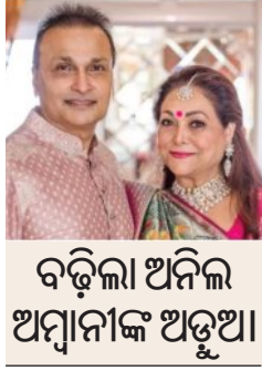
ବଡ଼ିଲା ଅନିଲ ଅମ୍ବାନୀଙ୍କ ଅଭିଯୋଗ