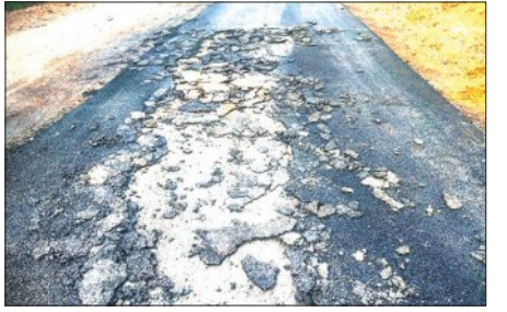
ସକାଳୁ ପିତୁ ଉଠିଯିବାରୁ କାମର ମାନ ନେଇ ପ୍ରଶ୍ନ ଉଠିଛି। ଗ୍ରାମବାସୀ ବିଭାଗୀୟ ଅଧିକାରୀଙ୍କ ଉପସ୍ଥିତିରେ କାର୍ଯ୍ୟ କରିବା

ଚମ୍ପୁଆ, ୧୯/୨(ସମ୍ପାଦକ): ଚମ୍ପୁଆ ଗ୍ରାମ୍ୟ ଉନ୍ନୟନ ବିଭାଗ ପକ୍ଷରୁ ଜାମୁଦଳକ ପଞ୍ଚାୟତର କାମୁଦଳକଠାରୁ କକଟାପାଟ ଗାଆଁ ରାତି ଅଧୁଆ। ପିତୁ ହେଉଥିବା ବେଳେ ସକାଳୁ ପିତୁ ଉଠିଯିବାକୁ ନେଇ ଗ୍ରାମବାସୀଙ୍କ ମଧ୍ୟରେ ଅସନ୍ତୋଷ ବେଖବାକୁ ମିଳିଛି। ମଙ୍ଗଳପୁରଠାରୁ କକଟାପାଟ ପର୍ଯ୍ୟନ୍ତ ଯାଇଥିବା ମୁଖ୍ୟମନ୍ତ୍ରୀ ସଡ଼କ ଯୋଜନା କାର୍ଯ୍ୟ ଅଧିକାରିଆ ଅବସ୍ଥାରେ ପଡ଼ି ରହିଥିବା ବେଳେ ଏହାର କାର୍ଯ୍ୟ ଏବେ ଆରମ୍ଭ କରାଯାଇଛି। ମାତ୍ର ଠିକାଦାର ଜଣକ ବିଭାଗୀୟ ଅଧିକାରୀଙ୍କୁ ଅନୁପସ୍ଥିତିରେ ରାତି ଅଧୁଆ। ପିତୁ କାମ କରି କାର୍ଯ୍ୟ ଶେଷ କରିବାକୁ ଚେଷ୍ଟା କରୁଥିବା ବେଳେ ଗ୍ରାମବାସୀ କାର୍ଯ୍ୟକୁ ବିରୋଧ କରିଥିଲେ। ଉକ୍ତ ପିତୁ ହୋଇଥିବା ଗାଆଁଟି