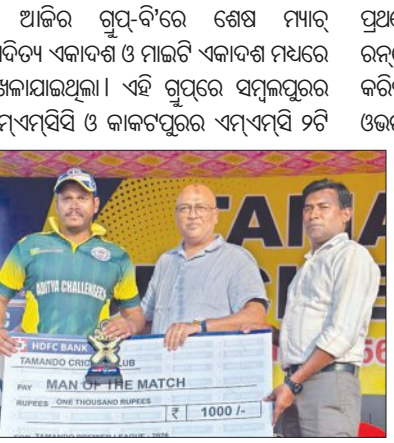
ଲେଖାଏଁ ମ୍ୟାଚ୍ ଜିତି ପ୍ରଥମ ଦୁଇଟି ସ୍ଥାନରେ ରହିଥିଲେ । ଆଜି ମ୍ୟାଚ୍‌ରେ ସେମିକୁ ଯିବାକୁ ପୁରସ୍କାର ଅର୍ଥରେ ୧୦୦୦ ଟଙ୍କା ପ୍ରାପ୍ତ ହୋଇଥିଲା । ଏହି ମ୍ୟାଚ୍‌ରେ

ଭୁବନେଶ୍ୱର, ୧୯/୧୨ (ସମିସ୍): ତମକୁର ବିଜୟ ସହ ଭୁବନେଶ୍ୱର ଆଦିତ୍ୟ ଏକାଦଶ ଏଠାରେ ଚାଲିଥିବା ଡ଼ିମାଣ୍ଡୋ ପ୍ରମିୟର ଲିଗ୍ କ୍ରିକେଟ୍ ଟୁର୍ଣ୍ଣାମେଣ୍ଟର ଚତୁର୍ଥ ତଥା ଶେଷ ଦଳ ଭାବେ ସେମିଫାଇନାଲରେ ପ୍ରବେଶ କରିଛି । ପୂର୍ବରୁ ଗୁପ୍ତ-୯ରୁ ଆୟୋଜିତ ଡ଼ିମାଣ୍ଡୋ କ୍ରିକେଟ୍ ଟୁର୍ଣ୍ଣାମେଣ୍ଟର ଚତୁର୍ଥ ତଥା ଶେଷ ଦଳ ଭାବେ ସେମିଫାଇନାଲରେ ପ୍ରବେଶ କରିଥିଲେ । ଆଜି ଆଦିତ୍ୟ ଏକାଦଶ ବିଜୟ ଓ ଗୁପ୍ତରେ ପ୍ରଥମ ସ୍ଥାନ ଅଧିକାର କରିବା ପାଇଁ ସେମିଫାଇନାଲ ଲାଇଟ୍‌ଅପ୍ ଟୁଟାନ୍ତ ହୋଇଯାଇଛି । ଆସନ୍ତାକାଲି ତଥା ଶୁକ୍ରବାର ଖେଳାଯିବାରୁ ଥିବା ପ୍ରଥମ ସେମିଫାଇନାଲରେ ଡ଼ିମାଣ୍ଡୋ କ୍ରିକେଟ୍ କ୍ଲବ୍ ସହ ସମ୍ବଲପୁର ଏମ୍‌ଏସ୍‌ସିଏସ୍ ଓ ଶନିବାର ଦ୍ୱିତୀୟ ସେମିଫାଇନାଲ ଆଦିତ୍ୟ ଏକାଦଶ ସହ ଯୁବି ରକ୍ଷଣରେ ମୁକାବିଲା ହେବ । ରବିବାର ପାଇନାଲ ଖେଳାଯିବ ।