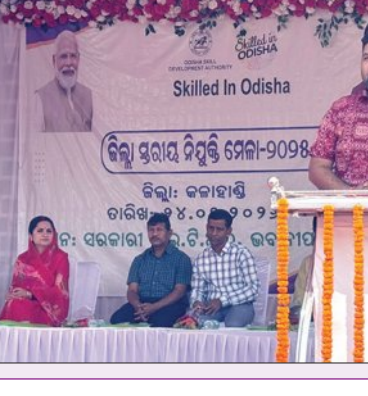
କଳାହାଣ୍ଡି, ୨୫ 1୨ (ସମିପ): କଳାହାଣ୍ଡି ଜିଲ୍ଲା ପ୍ରଶାସନ ଆନୁକୂଲ୍ୟରେ ଏକ ଜିଲ୍ଲାସ୍ତରୀୟ ନିୟୁକ୍ତି ମେଳା ଅନୁଷ୍ଠିତ ହୋଇଯାଇଛି।

କଳାହାଣ୍ଡି, ୨୫ 1୨ (ସମିପ): କଳାହାଣ୍ଡି ଜିଲ୍ଲା ପ୍ରଶାସନ ଆନୁକୂଲ୍ୟରେ ଏକ ଜିଲ୍ଲାସ୍ତରୀୟ ନିୟୁକ୍ତି ମେଳା ଅନୁଷ୍ଠିତ ହୋଇଯାଇଛି। ଏହି ଜିଲ୍ଲାସ୍ତରୀୟ ନିୟୁକ୍ତି ମେଳାକୁ କଳାହାଣ୍ଡି ସଂସଦ ମାଳବିକା ଦେବୀ ଉଦ୍ଘାଟନ କରିଥିଲେ। ଏହି ମେଳାରେ ଅତିରିକ୍ତ ଜିଲ୍ଲାପାଳ ଚନ୍ଦ୍ରମୁଖ ଦାସ, ସରକାରୀ ଶିକ୍ଷା ଡାକ୍ତରୀ ଅନୁଷ୍ଠାନ ଏବଂ ସରକାରୀ ବହୁକୃତ ପ୍ରଶିକ୍ଷଣ ପ୍ରତିଷ୍ଠାନର ଅଧ୍ୟକ୍ଷ ଉପସ୍ଥିତ ଥିଲେ।