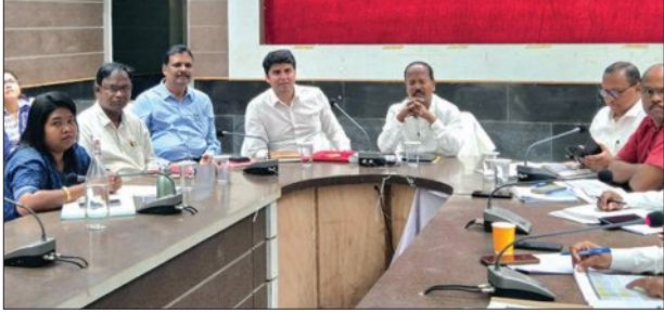
ଜିଲ୍ଲାପାଳ ନିର୍ଦ୍ଦେଶ ଦେଇଥିଲେ। ଏହାସହ ନୂଆପଡ଼ା ସହରର ରାଜପଥର ଉନ୍ନତ ପାଇଁ ପ୍ରତିଷ୍ଠା ଦେବା ପାଇଁ ଯୋଗ୍ୟ ଆଶାଯାକୁ ଉନ୍ନତ ପୂର୍ବକ ଶୀଘ୍ର ତାରିଖ ଆରମ୍ଭ କରିବାକୁ ଜିଲ୍ଲା ନିର୍ଦ୍ଦେଶକ ଅଧିକାରୀଙ୍କୁ ନିର୍ଦ୍ଦେଶ ଦିଆଯାଇଥିଲା।

ଗ୍ରାମ୍ୟ ଜଳ ଯୋଗାଣ ଓ ପରିମଳ, ପ୍ରାଣୀ ସମ୍ପଦ, ପରିବହନ, ଶିକ୍ଷା, ସ୍ୱାସ୍ଥ୍ୟ, ଜଳ, ଖଣି ଓ ପର୍ଯ୍ୟଟନ, ବିଜ୍ଞାପିତ ଅଞ୍ଚଳ ପରିଷଦ ସମେତ ସମସ୍ତ ବିଭାଗର କାର୍ଯ୍ୟକ୍ରମରେ ବିସ୍ତୃତ ସମୀକ୍ଷା କରାଯାଇଥିଲା। ତତ୍ପରିଚାଳନାମାନଙ୍କ ଦ୍ୱାରା ବିଭିନ୍ନ କାର୍ଯ୍ୟକ୍ରମ ଶିକ୍ଷାନୁଷ୍ଠାନ, ଚିକିତ୍ସାଳୟ, ପ୍ରାଣୀ ଚିକିତ୍ସାଳୟ, ଅଙ୍ଗନବାଡ଼ି କେନ୍ଦ୍ର, ଖେଳପଡ଼ିଆ ପାଇଁ ଜମି ପତ୍ର ଯୋଗାଇବା ସହ ନୂତନ କୋଠା ନିର୍ମାଣ ବିଷୟରେ ମଧ୍ୟ ଆଲୋଚନା ହୋଇଥିଲା। ବୟୋ ସମ୍ମତ କାର୍ଯ୍ୟକ୍ରମକୁ ଶୀଘ୍ର ଆରମ୍ଭ ନେବା ପାଇଁ ଜିଲ୍ଲାପାଳ ସମସ୍ତ ଅଧିକାରୀଙ୍କୁ ତାରିଖ କରିଥିଲେ।