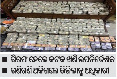
■ ଗିରଫ ହେଲେ କଟକ ଖଣି ଉପନିର୍ଦ୍ଦେଶକ ■ ଗଣିଗଣି ଅଧିକାରୀଙ୍କ ଭିଜିଲାନ୍ସ ଅଧିକାରୀ