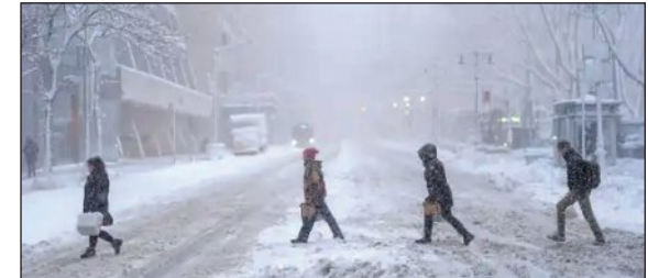
'ଫ୍ଲାଇଂ ଆଉଟର' ଏ ନେଇ ସୂଚନା ଦେଇଛି। ଜାତୀୟ ପାଣିପାଗ ସେବା ଦେଇଥିବା ସୂଚନା ଅନୁଯାୟୀ, ରୋଡ଼ ଆଇଲଣ୍ଡ ଓ ମାସ୍ସାଚୁସେଟ୍ସ୍ ପୃଷ୍ଠା-୭

■ ନ୍ୟୁୟାର୍କ, ୨୫ 1୨ (ଏକେଡି): ଆମେରିକାରେ ଦେଖାଦେଇଥିବା ଭୟଙ୍କର ବରଫ ଝଡ଼ କାରଣରୁ ଜନଜୀବନ ଅସ୍ତବ୍ୟସ୍ତ ହୋଇପଡ଼ିଛି। ଦୁଷ୍ଟାର ଝଡ଼ କାରଣରୁ ବିଭିନ୍ନ ବିମାନବନ୍ଦର ରେନଫେ ବନ୍ଦ ରହିଛି। ବହୁ ଅଞ୍ଚଳରେ