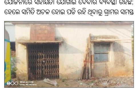
ବୁଣାକାରମାନେ ବାହାର ବେପାରୀଙ୍କ ଶୋଷଣର ଶିକାର ହେଉଛନ୍ତି । ଗ୍ରାମରେ ବସବାସ କରୁଥିବା ପ୍ରାୟ ୨୦୦୦ ଅଧିକ ବୁଣାକାର ପରିବାର ବାର୍ଦ୍ଧ ୧୯ ବର୍ଷ ହେବ ସବୁ ସରକାରୀ

ସରକାର ବୁଣାକାରମାନଙ୍କ ଉନ୍ନତ ପାଇଁ ଅନେକ ଯୋଜନା ପ୍ରଣୟନ କରୁଛନ୍ତି । ଏଥିପାଇଁ ବାର୍ଷିକ କୋଟି ଟଙ୍କା ଖର୍ଚ୍ଚ ହେଉଛି; ହେଲେ ବିଭାଗୀୟ ଅଧିକାରୀଙ୍କ ଆନ୍ତରିକତାର ଅବହେଳା ଯୋଗୁଁ ବୁଣାକାରମାନେ ମୌଳିକ ସୁବିଧାରୁ ବଞ୍ଚିତ ହେଉଥିବା ଦେଖିବାକୁ ମିଳିଛି । ବୌଦ୍ଧ ଜିଲ୍ଲା କଣ୍ଠାମାଳ ବ୍ଲକ୍ ଗୁଡ଼ିକରେ ପ୍ରାୟ ୨୫୦୦ ବୁଣାକାର ଡକ୍ତରୀୟ ସମିତି ବାର୍ଦ୍ଧ ୧୯ ବର୍ଷରୁ ଅଧିକ ହେବ ଅଟଳ ହୋଇ ପଡ଼ି ରହିଛି । ସମିତି ଅଟଳ ହେବା ପରେ ବୁଣାକାରମାନେ ସରକାରଙ୍କ ସମସ୍ତ ଯୋଜନାରୁ ବଞ୍ଚିତ ହେଉଥିବା ଅଭିଯୋଗ ହୋଇଛି । ବୁଣାକାରମାନେ ଆବଶ୍ୟକୀୟ ସରକାରୀ ସୁବିଧା ସୁଯୋଗରୁ ବଞ୍ଚିତ ହେଉଥିବା ବେଳେ ବାହାର ମାଲିକମାନଙ୍କ ନିକଟରେ ନିର୍ଭର କରିବାକୁ ପଡ଼ିଛି । ସମିତି ମାଧ୍ୟମରେ ବୁଣାକାରମାନଙ୍କୁ