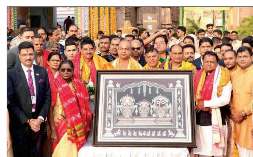
୨୦୧୫ରେ ଘୋଡ଼ଗଢ଼ାରେ ପିଣ୍ଡଦାନ କଲେ ରାଷ୍ଟ୍ରପତି ଶ୍ରୀମତୀ ଦ୍ରୌପଦୀ ମୁର୍ମୁ।

ପୁରୀ, ୪୯ (ସମ୍ବିଧାନ): ପୁରୀ ଗଣ୍ଡ ଶେଷ କରି ଘୋଡ଼ଗଢ଼ାରେ ପିଣ୍ଡଦାନ କଲେ ରାଷ୍ଟ୍ରପତି ଶ୍ରୀମତୀ ଦ୍ରୌପଦୀ ମୁର୍ମୁ। ଏହି ଗଣ୍ଡ ଅବସରରେ ରାଷ୍ଟ୍ରପତି ଶ୍ରୀମତୀ ଦ୍ରୌପଦୀ ମୁର୍ମୁ ଅନ୍ୟତମ ଘୋଡ଼ଗଢ଼ା ଚାଷୀଙ୍କ ପିଣ୍ଡଦାନ ଦେବା ସହ ଗର୍ଭଗୃହକୁ ଯାଇ ଉପସ୍ଥାପନ ନିକଟରେ ଉପସ୍ଥିତ ରହିଥିଲେ। ଘୋଡ଼ଗଢ଼ା ଚାଷୀଙ୍କୁ ଧ୍ୟାନ ଦେବା ପାଇଁ ରାଷ୍ଟ୍ରପତି ଶ୍ରୀମତୀ ଦ୍ରୌପଦୀ ମୁର୍ମୁ ଏହାକୁ ଉଚ୍ଚାଦେଇଥିଲେ।