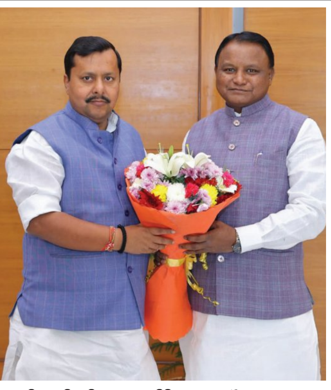
ପୁଅବିଲାରେ ବିଜେଡି ରାଷ୍ଟ୍ରୀୟ ଅଧ୍ୟକ୍ଷ ନିତ୍ୟ ନବୀନଙ୍କୁ ସୌଜନ୍ୟମୂଳକ ସାକ୍ଷାତ କରୁଛନ୍ତି ମୁଖ୍ୟମନ୍ତ୍ରୀ ମୋହନ ଚରଣ ମାଝା

ଭୁବନେଶ୍ୱର, ୨୭/୧୨(ସମ୍ପାଦକ): ଆସନ୍ତା ଷ୍ଟ ଓଡ଼ିଶାରେ କେନ୍ଦ୍ର ଗୃହ ତଥା ସମବାୟ ମନ୍ତ୍ରୀ ଅମିତ ଶାହା ୨ ଦିନିଆ ଗସ୍ତରେ ଓଡ଼ିଶା ଆସୁଛନ୍ତି। ମିଳିଥିବା ସୂଚନା ଅନୁଯାୟୀ, କେନ୍ଦ୍ରମନ୍ତ୍ରୀ ଷ୍ଟ ଓଡ଼ିଶାରେ ପହଞ୍ଚିବେ। ୬ ଓଡ଼ିଶା ପୂର୍ବାହରେ କଟକ ମୁଖ୍ୟମନ୍ତ୍ରୀ ସିଆଲସିଂହପାଟଣା ପ୍ରତିଷ୍ଠା ଦିବସ କାର୍ଯ୍ୟକ୍ରମରେ ଯୋଗଦେବେ। ଅପରପକ୍ଷରେ ଖୋର୍ଦ୍ଧା ଜଟଣୀଠାରେ କାତାୟ ଫୋରେନ୍ସିକ୍ ବିଜ୍ଞାନ ବିଶ୍ୱବିଦ୍ୟାଳୟ (ଏନଏସଏସଏ) ଏବଂ କେନ୍ଦ୍ରୀୟ ଫୋରେନ୍ସିକ୍ ବିଜ୍ଞାନ ପରୀକ୍ଷାଗାର (ଏସଏସଏଏଏସଏ), ଭୁବନେଶ୍ୱର କ୍ୟାମ୍ପସ ପାଇଁ ଭୂମି ପୂଜନ କରିବା ସହ ଆଗାମୀ ମାଧ୍ୟମରେ ଏନଏସଏସଏସଏସଏ କ୍ୟାମ୍ପସର ଶୁଭଉଦ୍ଘାଟନ କରିବେ। ସେହିଦିନ ଅପରାହ୍ନରେ କେନ୍ଦ୍ରମନ୍ତ୍ରୀ ଶାହା ଭୁବନେଶ୍ୱରସ୍ଥିତ ଇଡକୋ ପ୍ରଦର୍ଶନୀ ପଡ଼ିଆରେ ନବୀନ ନାୟକ ସହିତ ପ୍ରଦର୍ଶନୀର ଉଦ୍ଘାଟନ କରିବା ସହ ସମବାୟ ଏବଂ ଅନ୍ୟ ବିଭିନ୍ନ ବିଭାଗ ପ୍ରକଳ୍ପଗୁଡ଼ିକର ଶିଳାନ୍ୟାସ ଓ ଉଦ୍ଘାଟନ କରିବାର କାର୍ଯ୍ୟକ୍ରମ ରହିଛି।