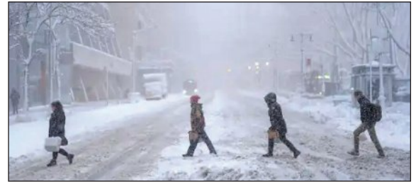
ଏ ନେଇ ସୂଚନା ଦେଇଛି । ଜାତୀୟ ପାଣିପାଗ ସେବା ଦେଇଥିବା ସୂଚନା ଅନୁଯାୟୀ, ରୋଡ଼ ଆଇଲଣ୍ଡ ଓ ମାସୁରୁସେଟ୍ ରାଜ୍ୟରେ ୩୬

■ ଦୁଧର୍ମ, ୨୫ 1୨ (ଏକେନ୍ଦ୍ର): ଆମେରିକାରେ ଦେଖାଦେଇଥିବା ଭୟଙ୍କର ବରଫ ଝଡ଼ କାରଣରୁ ଜନଜୀବନ ଅସ୍ତବ୍ୟସ୍ତ ହୋଇପଡ଼ିଛି । ଦୁଷ୍ଟାର ଝଡ଼ କାରଣରୁ ବିଭିନ୍ନ ବିମାନ ବନ୍ଦରରେ ରେନଡେ ବନ୍ଦ ରହିଛି । ବହୁ ଅଞ୍ଚଳରେ ବିମାନ