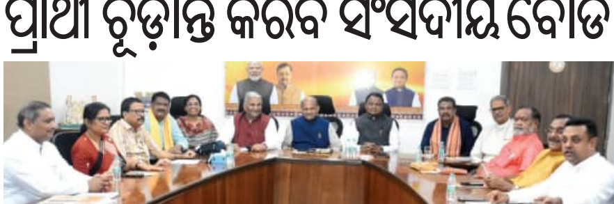
ବୋର୍ଡ, ନିର୍ବାଚନ ନିୟୁକ୍ତ ବିଜେପି ନେତା ବୈଠକରେ ଉଦ୍‌ବେଗ !

■ ଭୁବନେଶ୍ୱର, ୨୨ ୧୨ (ସମିସ): ରବିବାର ଅନୁଷ୍ଠିତ ହୋଇଛି ରାଜ୍ୟ ବିଜେପିର ଗୁରୁତ୍ୱପୂର୍ଣ୍ଣ କୋର୍ କମିଟି ବୈଠକ । ପ୍ରାୟ ଅଢ଼େଇ ଘଣ୍ଟା ଧରି ଚାଲିଥିବା ଏହି ମାରାଥନ ବୈଠକରେ ମୁଖ୍ୟମନ୍ତ୍ରୀ ବୋର୍ଡ, ନିର୍ବାଚନ ନିୟୁକ୍ତ, ରାଜ୍ୟସଭା ନିର୍ବାଚନ, ଆଗାମୀ ପଞ୍ଚାୟତ ନିର୍ବାଚନ ପ୍ରସ୍ତୁତି ସମ୍ପର୍କରେ ବିଶଦ ଭାବରେ ଆଲୋଚନା ହୋଇଛି । ରାଜ୍ୟସଭା ନିର୍ବାଚନ ସଂକ୍ରାନ୍ତ ସମ୍ବନ୍ଧୀୟ ନାମ ସୂଚୀ ରାଜ୍ୟ ପକ୍ଷରୁ ଦିଲ୍ଲୀ ପଠାଯିବ ଏବଂ ସଂସଦୀୟ ବୋର୍ଡ ଏ ସଂକ୍ରାନ୍ତରେ ତୃତୀୟ ନିଷ୍ପତ୍ତି ନେବ । ଏହା ସହିତ ଉଭୟ ସଂଗଠନ ଏବଂ ସରକାରରେ କେତେଗୁଡ଼ିଏ ପରିବର୍ତ୍ତନ ସହ ନୂଆ ନିୟୁକ୍ତ ଦେଖିବାକୁ ମିଳିବ ବୋଲି ବିଜେପିର କର୍ତ୍ତବ୍ୟ ନେତା ସୂଚନା ଦେଇଛନ୍ତି । ରାଜ୍ୟରେ ବିଜେପି ସରକାର ଗଠନ କରିବାକୁ ୨୦ ମାସ ବିତିଯାଇଛି । ମାତ୍ର ଏଯାବତ୍ ଅଧାରଟି ମନ୍ତ୍ରୀମଣ୍ଡଳକୁ ନେଇ ସରକାର ଚାଲୁଛି । ଫଳରେ ସରକାର ଚାଲିବା ବେଳେ ବେଶି ଝୁଣୁଛନ୍ତି । ମୁଖ୍ୟ-୯