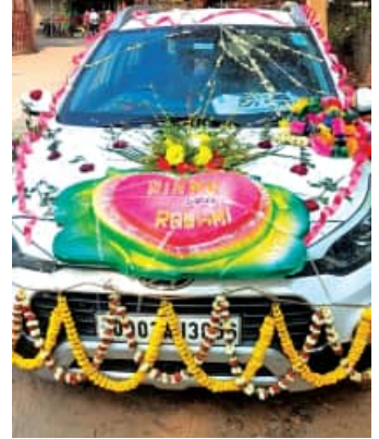
ସରିଥିଲା । ସକାଳ ୫ଟାରେ ବରକନ୍ୟାକୁ ଧରି ଆସୁଥିବା ଗାଡ଼ିଟି ତରଭା ବଡ଼ବନ୍ଧୁ ମୋଡ଼ ନିକଟରେ ପହଞ୍ଚି ସାରିଥିଲା । ଆଉ ୨୨

■ ବଲାଙ୍ଗିର/ତରଭା/କଣ୍ଟାମାଳ, ୨୨ ୧୨ (ସମିସ): ବାହାଘର ସରିଲା । ନବବଧୂକୁ ସାଙ୍ଗରେ ଧରି ବର ଗାଁ ଅଭିମୁଖେ ବାହାରିଲା । ହେଲେ ଶଶୁର ଘରେ ପହଞ୍ଚିବା ଆଗରୁ ବାଟରୁ ଅପହରଣ ହୋଇଗଲେ ନବବଧୂ । ଆଜି ବାଟରେ ବନ୍ଧୁକ ଦେଖାଇ କିଛି ସୁବକ୍ତା ନବବଧୂକୁ ଉଠାଇ ନେଇଛନ୍ତି । ସୁବକ୍ତାକୁ ଜିଲ୍ଲା ତରଭା ନିକଟରେ ରବିବାର ଏକ ଧର୍ମାତ୍ମକ ଘଟଣା ଘଟିଛି । ଅପହରଣ ନବବଧୂ ହେଲେ, ବୌଦ୍ଧ ଜିଲ୍ଲା କଣ୍ଟାମାଳ ଥାନା ବନ୍ଧପାଲିର ସର୍ଜନ ପୁଟେଲକ୍ ବିଚାର ଝିଅ ରଞ୍ଜି । ବୋଧ ହେଲେ ତରଭା ଥାନାରେ ଏକ ମାମଲା ରୁକୁ ହୋଇଛି । ତରଭା ପୁଲିସ କଣ୍ଟାମାଳ ଯାଇ ତଦନ୍ତ ଚଳାଇଛି । ଏହି ଅପହରଣ ପଛରେ ରଞ୍ଜିଙ୍କୁ ଭଲ ପାଉଥିବା