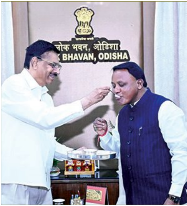
ବିଧାନସଭାରେ ରାଜ୍ୟ ବଜେଟ୍ ଉପସ୍ଥାପନ କରିବା ପୂର୍ବରୁ ରାଜ୍ୟପାଳ ଡ. ହରିବୀର କୁମ୍ଭାର ପାଟି ମୁଖ୍ୟମନ୍ତ୍ରୀ ମୋହନ ଚରଣ ମାଝୀଙ୍କୁ ଦହି କୁଆଇଛନ୍ତି