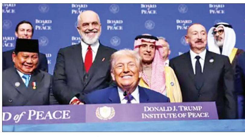
ନ ହୁଏ, ତେବେ ଆମେରିକା ସାମରିକ କାର୍ଯ୍ୟାନୁଷ୍ଠାନ ଗ୍ରହଣ କରିବ ବୋଲି ସେ ଚେତାବନୀ ଦେଇଛନ୍ତି। ଏହି ବୈଠକରେ ମୋର୍ ୫୦ଟି ଦେଶର ପ୍ରତିନିଧି ସାମିଲ ହୋଇଥିଲେ। ଏହି ବୈଠକରେ ପାକିସ୍ତାନ ପ୍ରଧାନମନ୍ତ୍ରୀ ଶାହବାଜ୍ ସରିଥିଲେ। ହିତ୍ତା ହୋଇ ତାଙ୍କ କଥା ଶୁଣିବାକୁ ନିର୍ଦ୍ଦେଶ ଦେଇଥିଲେ। ବୋଲକରା ତଥା ଆନୁଗତ୍ୟକ ଭଳି ସରିତ ମଧ୍ୟ ତାହା କରିଥିଲେ। ଟ୍ରମ୍ପଙ୍କ ଆଖିଧାନ ହୋଇଥିଲେ ବି ତାଙ୍କୁ ଗୁପ୍ତରେ ସବୁଠାରୁ ପଛରେ ଛିଡ଼ାହେବାକୁ ପଡ଼ି ଥିଲା। ଏହାକୁ ନେଇ ସାମାଜିକ ଗଣମାଧ୍ୟମରେ ସେ ପରିହାସର ପାତ୍ର ହୋଇଛନ୍ତି। ଶାହବାଜ୍‌ଙ୍କ ଚିତ୍ରିତ ଖୁବ ଭାଇଭାଇ ହେବାରେ ଲାଗିଛି। ଇସ୍ରାଏଲ, ସାଉଦି ଆରବ, ୟୁଏଇ, ପାକିସ୍ତାନ, ତୁର୍କୀ ଓ ଭଲିପ୍ ସମେତ ୨୭ଟି ଦେଶ ଏହି ବୋର୍ଡରେ ସାମିଲ ହୋଇଛନ୍ତି। ଭାରତ ବର୍ତ୍ତମାନ ଏହି ବୋର୍ଡରେ ପୂର୍ଣ୍ଣକାଳୀନ ସଦସ୍ୟ

ୱାଶିଙ୍ଗଟନ, ୨୦ ୧୨ (ଏକେଡି): ଗାଜାରେ ଶାନ୍ତି ପ୍ରତିଷ୍ଠା ସହ ପୁନର୍ନିର୍ମାଣ ପାଇଁ ଆମେରିକା ରାଷ୍ଟ୍ରପତି ଡୋନାଲ୍ଡ ଟ୍ରମ୍ପଙ୍କ ଦ୍ୱାରା ଗଠିତ 'ବୋର୍ଡ ଅଫ ପିସ୍' ପ୍ରଥମ ବୈଠକ ଅନୁଷ୍ଠିତ ହୋଇଯାଇଛି। ଗୁରୁବାର ୱାଶିଙ୍ଗଟନ ଗୁରୁବାର ଅନୁଷ୍ଠିତ ଏହି ବୈଠକରେ ଭାରତ ଏକ ପର୍ଯ୍ୟବେକ୍ଷକ