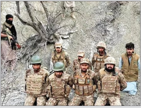
ବୋଲି ବିଏଲଏଫ ତେରବନ୍ଦୀ ଦେଇଛି। ତେବେ ପାକିସ୍ତାନ ସେନା ପକ୍ଷରୁ କୁହାଯାଇଥିଲା ଯେ ସେମାନଙ୍କର କୌଣସି ସୈନିକ ଆତଙ୍କବାଦୀ ଗୋଷ୍ଠୀର ହେପାଜତରେ ନାହାନ୍ତି। ଚିତ୍ର ଓରେ ସୈନିକମାନେ ସେମାନଙ୍କ ଅସିଦ୍ଧିଆଳ ସର୍ଭିସ କାର୍ଡ କ୍ୟାମେରା ସମ୍ମୁଖରେ ଦେଖାଇଛନ୍ତି। ତେଣୁ ପାକ୍ ସେନାର ଦାବି ମିଥ୍ୟା ବୋଲି ପ୍ରମାଣିତ ହେଉଛି।

ଏହି ଚିତ୍ର ଓ ପାକ୍ ସେନାର ସେହି ଦାବିକୁ ମିଥ୍ୟା ପ୍ରମାଣିତ କରିଛି, ଯେଉଁଥିରେ କୁହାଯାଇଥିଲା ଯେ ସେମାନଙ୍କର କୌଣସି ସୈନିକ ନିଷ୍ପାତ ହୋଇନାହାନ୍ତି। ଏହି ଚିତ୍ର ଓରେ ୬-୮ ଜଣ ସୈନିକ ଆକ୍ରମଣ ବସିଥିବା ଦେଖାଯାଇଛି। ପାକିସ୍ତାନ ସେନା ଆମକୁ ନିଜର ଭାବୁନାହିଁ ଓ ସେମାନେ ପାକିସ୍ତାନ ଆମର ପରିଚୟକୁ ବୈଧ ବୋଲି ଭାବୁନାହିଁ। ଫେବୃଆରୀ ୧୪ରେ ବିଏଲଏଫ ଏହି ସୈନିକଙ୍କୁ ଅପହରଣ କରିଥିଲା। ବିଏଲଏଫ ସରକାରକୁ ଫେବୃଆରୀ ୨୨ ପର୍ଯ୍ୟନ୍ତ କଣ୍ଠ ଦେଇଛି। ଯଦି ବନ୍ଦୀ ବିନିମୟ (ବେଲୁର୍ ବନ୍ଦୀଙ୍କ ମୁକ୍ତି) ନେଇ ଆଲୋଚନା ନଳ ହୁଏ, ତେବେ ଏହି ସୈନିକମାନଙ୍କୁ ପାଖା ଦିଆଯାଇପାରେ।