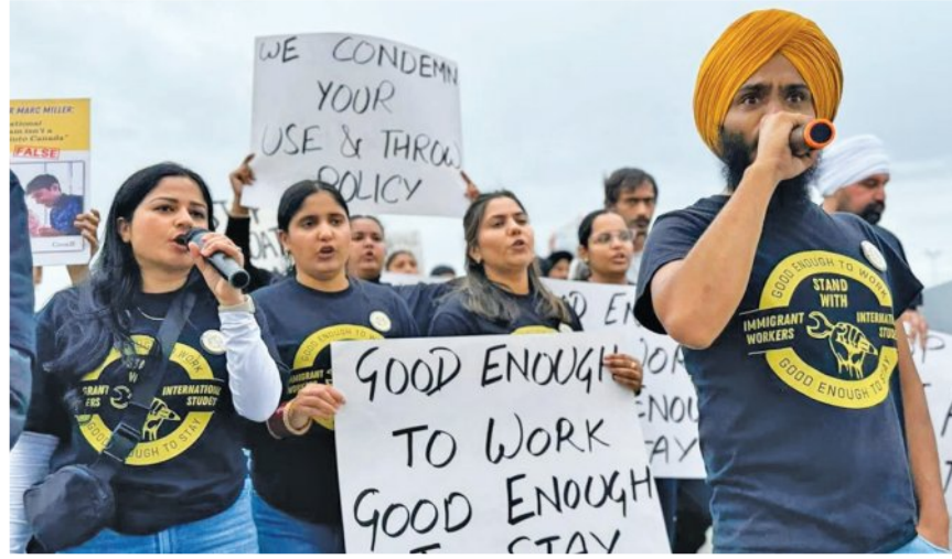
୨୦୧୯, ୧୮ (ଏକେନ୍ଦ୍ର): କାନାଡ଼ା ସରକାର ୨୦୨୫ର ପ୍ରଥମ ୧୦ମାସରେ ୨.୮୩୯ ଲକ୍ଷ ଭାରତୀୟ ନାଗରିକଙ୍କୁ ଦେଶାନ୍ତର କରିଛନ୍ତି। କାନାଡ଼ା ବର୍ତ୍ତର ସର୍ବୋଚ୍ଚ ନିର୍ଦ୍ଦେଶ ଦାମ୍ (ସିବିଏସ୍) ଦ୍ୱାରା ପ୍ରକାଶିତ ତଥ୍ୟକୁ ଏହି ସୂଚନା ମିଳିଛି।

ତଥ୍ୟ ଅନୁଯାୟୀ, କାନାଡ଼ାକୁ ମୋଟ ୧୮.୩୯ ଲକ୍ଷ ବାହାର କରାଯାଇଛି। ଦେଶାନ୍ତର ନେଇ ପ୍ରକାଶିତ ତାଲିକାରେ ଭାରତ ବିତାଡ଼ି ଘ୍ନାନରେ ରହିଛି। ସର୍ବାଧିକ ୩.୯୭୨ ଲକ୍ଷ ମେକ୍ସିକୋ ନାଗରିକଙ୍କୁ ଦେଶାନ୍ତର କରାଯାଇଛି। ବର୍ତ୍ତମାନ ଏଥିପାଇଁ ୩ ପ୍ରକାରର ଆଦେଶ ଦିଆଯାଇଛି।