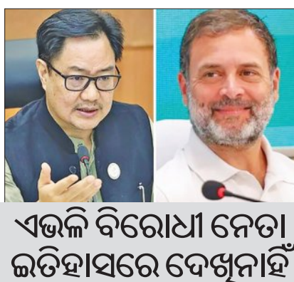
ଏଭଳି ବିରୋଧୀ ନେତା ଇତିହାସରେ ଦେଖିନାହିଁ

ଧିରେ ଧିରେ କଂଗ୍ରେସ ରାହୁଲଙ୍କ ଭଳି ହୋଇଗଲାଣି। ରାହୁଲଙ୍କ ପାଖରେ ଯିବ ରହୁଛନ୍ତି ସେ ବି ତାଙ୍କ ପରି ହୋଇଯାଇଛନ୍ତି। ସମର୍ଥକ ମଧ୍ୟ ତାଙ୍କୁ ଗମ୍ଭୀରତାର ସହ ନେଉନାହାନ୍ତି। କାରଣ ରାହୁଲ ଚିନ୍ତା ନ କରି କହିଆନ୍ତି। ଯଦି ପ୍ରଧାନମନ୍ତ୍ରୀ କାରଣ ରାହୁଲ କେହିଛନ୍ତି କିମ୍ବା କୌଣସି ଦଳର ଅଧିକାରୀ, ତେବେ ରାହୁଲ ତାହାକୁ ଉପହାସନ କରିବା କଥା। ସେ ବିନା ଆଧାରରେ ପ୍ରଧାନମନ୍ତ୍ରୀଙ୍କ ନାମ ନେଉଛନ୍ତି। ଲୋକସଭାରେ ରାହୁଲ ନିରର୍ଥକ ଟିପ୍ପଣୀ କରୁଥିଲେ। ବିରୋଧୀ ଦଳ ନେତା ନିମନ୍ତଠାରୁ ଉନ୍ନତ ନୁହେଁ ବୋଲି ସେ ଜାଣିବା ଉଚିତ। ପ୍ରଧାନମନ୍ତ୍ରୀ ଭାରତର ସ୍ୱର୍ଣ୍ଣ ପାଇଁ କାମ କରୁଛନ୍ତି। ଆମେରିକା ସହ ବାଣିଜ୍ୟ ବୃଦ୍ଧିରେ ତାହା, ଶ୍ରମିକ, ବୟନ ଶିଳ୍ପ କର୍ମଚାରୀ କିମ୍ବା କ୍ଷୁଦ୍ର ଉଦ୍ୟୋଗୀଙ୍କ କଥା ଚିନ୍ତା କରିବାର ଆବଶ୍ୟକତା ନାହିଁ। କାରଣ ପ୍ରଧାନମନ୍ତ୍ରୀ ସମସ୍ତଙ୍କ ଧ୍ୟାନ ରଖୁଛନ୍ତି। ମାତ୍ର ରାହୁଲ ନିଜ ବ୍ୟବସ୍ଥାରେ କାମ କରୁଥିବା ଦେଖାଯାଇଛି। ରିଜିଷ୍ଟ୍ରା ଦାବି କରିଛନ୍ତି ଯେ ଭାରତର ୧୫-୨୦% ଲେଭୁ ଲକ୍ଷ୍ୟବିହୀନ ରାଷ୍ଟ୍ରବାଦକୁ ବିରୋଧ କରୁଛି।