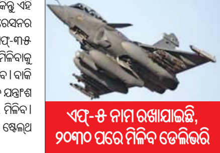
ଏସ୍-୫ ନାମ ରଖାଯାଇଛି, ୨୦୩୦ ପରେ ମିଳିବ ଡେଲିଭରି

ରହିଛି । ଏଗୁଡ଼ିକ ୪-୫ ଜେନେରେସନ ଅର୍ଥାତ ପ଼ିଠିର । କିନ୍ତୁ ଏହି ନୂଆ ଏସ୍-୫ ବିମାନଗୁଡ଼ିକ ୫ମ କିମ୍ବା ୬ଷ୍ଠ ଜେନେରେସନର ବୋଲି କୁହାଯାଉଛି । ଏହି ବିମାନଗୁଡ଼ିକ ଆମେରିକାର ଏସ୍-୩୫ ଓ ରୁଷର ସୁଖୋଇ-୫୦ଠାରୁ ମଧ୍ୟ ଅଧିକ ଶକ୍ତିଶାଳୀ । ମିଳିବାକୁ ଥିବା ୧୧୪ଟି ବିମାନରୁ ୧୮ଟି ସମ୍ପୂର୍ଣ୍ଣ ପ୍ରସ୍ତୁତ ହୋଇ ଆସିବ । ବାକି ୯୬ଟି ଭାରତରେ ତିଆରି ହେବ । ଏଥିରେ ୬୦ ପ୍ରତିଶତ ଯନ୍ତ୍ରମଣ ସ୍ୱଦେଶୀ ହେବ । ଏସ୍-୫ ବିମାନଗୁଡ଼ିକ ୨୦୩୦ ପରେ ମିଳିବ । ଏହି ସୁପର ରାଫେଲ ବିମାନଗୁଡ଼ିକରେ ଅତ୍ୟାଧୁନିକ ସ୍ତେଲ୍ୟ କ୍ଷମତା ଓ ପରମାଣୁ ଅସ୍ତ୍ର ନିକ୍ଷେପ କରିବାର ଶକ୍ତି ରହିବ ।