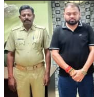
ନିୟମର ଉଲ୍ଲଙ୍ଘନ ଧରାଯିବ ବୋଲି ମଧ୍ୟ ସରକାର ନିର୍ଦ୍ଦେଶ ଦେଇଛନ୍ତି। ଗତ ୧୪ ତାରିଖ ରାତି ପ୍ରାୟ ୧୨ଟା ୧୫ରେ ସହିଦନଗରର ଓଡ଼ି-୦୨ ବାର୍ ବାହାରେ ବହୁ ସଂଖ୍ୟାରେ ଗାଡ଼ି ପାକି

ଅବକାରୀ ବିଭାଗ ପକ୍ଷରୁ ନିର୍ଦ୍ଦେଶ ଦିଆଯାଇଛି। ୧୨ଟା ୩୦ ପରେ କୌଣସି ବି ଲୋକ ବାର୍ରେ ଦେଖାଦେଲେ, ଏହା ଚଢ଼ଉ ସମୟରେ ଅବକାରୀ ଅଧିକାରୀଙ୍କୁ ଠେଲାପେଲା ଓ ଆକ୍ରମଣ ହୋଇଥିବା ଅଭିଯୋଗ ହୋଇଛି। ବାର୍ କର୍ମଚାରୀମାନେ ଅବକାରୀ କର୍ମଚାରୀଙ୍କ କଲର ଧରି ଧକ୍କା ମାରିବା ସହ ନାଲି ଆଖି ଦେଖାଇଛନ୍ତି। ପୁଲିସ ଉପସ୍ଥିତିରେ 'ଆମ ଇଚ୍ଛାରେ ଆମେ ବାର୍ ଚଳାଇବୁ' ବୋଲି ବାର୍ କର୍ମଚାରୀଙ୍କ ଧମକ ଅବକାରୀ ଅଧିକାରୀଙ୍କୁ ଚାଲୁ କରିଛି। ଏ ସଂକ୍ରାନ୍ତରେ ଅବକାରୀ ବିଭାଗ ପକ୍ଷରୁ ଖାରବେଳନଗର ଥାନାରେ ଅଭିଯୋଗ ପରେ ପୁଲିସ୍ ବାଧ୍ୟ ହୋଇ ବାର୍ ସିଲ୍ କରିଛି ଓ ମ୍ୟାନେଜର ଅବକାରୀ ସାହୁଙ୍କୁ ଗିରଫ କରିଛି। ରାତି ୧୨ଟା ସୁଦ୍ଧା ରାଜଧାନୀରେ ସମସ୍ତ ବାର୍ ବନ୍ଦ କରିବା ନିମନ୍ତେ