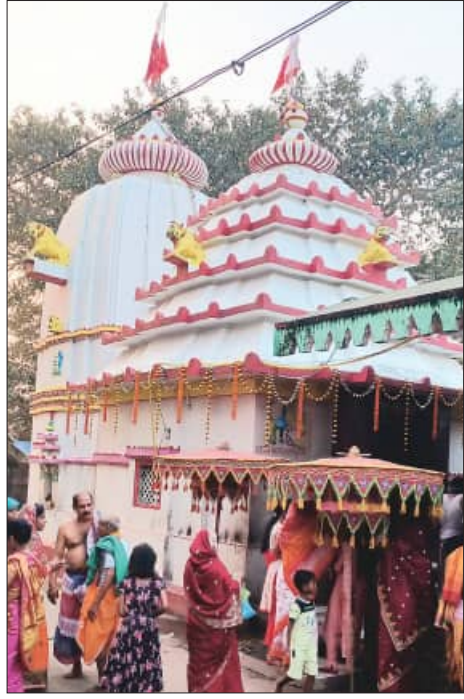
ନିର୍ଦ୍ଦିଷ୍ଟକୋଳ, ୧୫୨୨ (ସମିପ)

ଆକାଶରେ ଶିବମୟ ଅନୁଭୂତି ଏବଂ ବାୟୁରେ ଶୁଭ୍ର କର୍ପୁରର ସୁବାସ । ପବିତ୍ର 'ମହାଶିବରାତ୍ରୀ' ଅବସରରେ କଟକ ଜିଲ୍ଲାର ଆଧ୍ୟାତ୍ମିକ ପରିବେଶ ଆଜି ଏକ ଭବ୍ୟ ରୂପ ଧାରଣ କରିଛି । କେଉଁଠି ବାବା ଧବଳେଶ୍ୱରଙ୍କ ଜଳବେଷ୍ଟିତ ପୀଠରେ ଶ୍ରଦ୍ଧାଳୁଙ୍କ ଆକୁଳ ନିବେଦନ ଓ ପୁଣି କେଉଁଠି ପରମହଂସନାଥଙ୍କ ମନ୍ଦିରରେ ମହାଦେବଙ୍କ ରୁଦ୍ରାଭିଷେକ । ମହାନଦୀ କୁଳଠାରୁ ଆରମ୍ଭ କରି କାଠଯୋଡ଼ିର ଶାନ୍ତ ପରିବେଶ ପର୍ଯ୍ୟନ୍ତ, ପ୍ରତିଟି ଶୈବପୀଠ ଆଜି ଶିବ-ଶକ୍ତିଙ୍କ ଅପୂର୍ବ ମିଳନର ସାକ୍ଷୀ ପାଲଟିଛି । ହାତରେ ଜଳଥାଳି ଏବଂ ମନରେ ଅତୁଟ ବିଶ୍ୱାସ ନେଇ ଭକ୍ତଟିଏ ବର୍ଷକର ଅପେକ୍ଷା ପରେ ଆଜି ପ୍ରଭୁଙ୍କ ମହାଦାପ ଦର୍ଶନ ପାଇଁ ଉଜାଗର ରହିଛି । ଶଙ୍ଖ, ଘଣ୍ଟ ଏବଂ "ଓଁ ନମଃ ଶିବାୟ" ମନ୍ତ୍ରର ଗୁଞ୍ଜରଣରେ ସାରା ଜିଲ୍ଲା ଏବେ କୈଳାସପୁରୀର ଭ୍ରମ ସୃଷ୍ଟି କରୁଛି ।