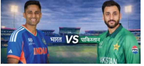
ଠାରେ ଭେଟାଭେଟି ହୋଇଥିବା ବେଳେ ଏଥିମଧ୍ୟରୁ ଭାରତ ଓ ପାକିସ୍ତାନ ମୋଟ ଦୁଇଟି ଟାଇଟଲ୍ ହାସଲ କରିଛନ୍ତି ।

■ କଲମ୍ବୋ, ୧୪/୨ (ଏକେନି): ଶ୍ରୀଲଙ୍କାରେ କଲମ୍ବୋସ୍ଥିତ ରଣସିଂହେ ପ୍ରୋମୋସନ୍ସ ଷ୍ଟାଡିୟମରେ ୨୦୨୬ ଟି-୨୦ ବିଶ୍ୱକପ୍ରେ ମହାମୁକାବିଲା ଭାରତ ଓ ପାକିସ୍ତାନ ମଧ୍ୟରେ ଆସନ୍ତାକାଲି ଅନୁଷ୍ଠିତ ହେବ । ଗୁପ୍ତ-ଏରେ ଖେଳାୟିତାକୁ ଥିବା ଏହି ଗୁରୁତ୍ୱପୂର୍ଣ୍ଣ ମୁକାବିଲା ପୂର୍ବରୁ ଉଭୟ ଦଳ ୨ଟି ଲେଖାଏଁ ମ୍ୟାଚ୍ ଜିତି ମହାଲକ୍ଷ୍ମେ ଲାଗି ପ୍ରସ୍ତୁତ ହୋଇଯାଇଛନ୍ତି । କଲମ୍ବୋର ମଝର ପଡ଼ରେ ଭାରତର ତାରକା ବ୍ୟାଟର ଓ ପ୍ରଭାବ ବିସ୍ତାର କରିଥିବା ପାକିସ୍ତାନୀ ସ୍ପିନରଙ୍କ ମଧ୍ୟରେ ଜୋରଦାର ଲଢ଼େଇ ହେବାର ସମ୍ଭାବନା ରହିଛି । ଏହି ମ୍ୟାଚ୍ରେ ନେଇ ସାରା ବିଶ୍ୱର କ୍ରୀଡ଼କର୍ତ୍ତା ପ୍ରୋମୋସ୍ତ ମଧ୍ୟରେ ଉତ୍ସାହ ଭରି ରହିଛି । ତେବେ ଏହି ମ୍ୟାଚ୍ରେ ବର୍ଷା ବାଧା ସୃଷ୍ଟି କରିପାରେ ବୋଲି ପାଣିପାଗ ବିଭାଗ ଆକଳନ କରିଛି । ଟି-୨୦ ବିଶ୍ୱକପ୍ରେ ବର୍ତ୍ତମାନ ସୁଦ୍ଧା ଭାରତ ଓ ପାକିସ୍ତାନ ମୋଟ