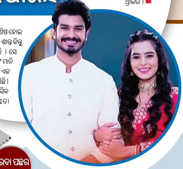
ପରଦା ପଛର କାହାଣୀ