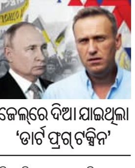
କେଲରେ ଦିଆଯାଇଥିଲା 'ଡାର୍ଟ' ପ୍ରାଣୀ ବିଷ

■ ଲଣ୍ଡନ, ୧୪/୨ (ଏକେନି): ତାନ ଓ ଭଗତ କୋରିଆରେ ବିରୋଧୀ ଦଳ ନେତାମାନଙ୍କୁ ରାଷ୍ଟ୍ରରୁ ହଟାଇବା ପାଇଁ ଏକକଳ୍ପବଦ୍ଧ ନେତା ଯୋଗେ ଉପାୟ ଅବଲମ୍ବନ କରିଛନ୍ତି । ରୁଷ୍ଟିଆରେ ମଧ୍ୟ ରାଷ୍ଟ୍ରପତି ପୁଡ଼ିନ ଠିକ୍ ସେହି ପଦ୍ଧତି ଆରମ୍ଭ କରିଛନ୍ତି । ରୁଷ୍ଟିଆରେ ବିରୋଧୀ ଦଳ ନେତା ଆଲେକ୍ସି ନଭଲେନିଙ୍କୁ ରାଷ୍ଟ୍ରପତି ପୁଡ଼ିନ କେଲରେ ବିଷ ଦେଇ ହତ୍ୟା କରାଇବା ଘଟଣାରୁ ଏହାର ପ୍ରମାଣ ମିଳୁଛି । ନଭଲେନିଙ୍କୁ ମାରିବା ପାଇଁ କେଲରେ ତାଙ୍କୁ ଏକ ବିଷ ଇଞ୍ଜେକ୍ସନ୍ ଦିଆଯାଇଥିଲା । ଏହି ବିଷକୁ ଦକ୍ଷିଣ ଆମେରିକାରେ ଦେଖା ଯାଉଥିବା ବିଷାକ୍ତ 'ଡାର୍ଟ' ପ୍ରାଣୀ ବିକଶିତ କରାଯାଇଥିଲା । ବ୍ରିଟେନ ଏବଂ ଏହାର ୟୁରୋପୀୟ ସହଯୋଗୀ ରାଷ୍ଟ୍ରଙ୍କ ପକ୍ଷରୁ ଏଭଳି ଦାବି କରାଯାଇଛି । ଏହା ରୁଷ୍ଟିଆ ରାଷ୍ଟ୍ରପତିଙ୍କୁ କ୍ରମ ରୂପେ ପଦରେ ପକାଇ ଦେଇଛି ବୋଲି କୁହାଯାଉଛି । ନଭଲେନିଙ୍କ ମୃତ୍ୟୁର ଦୁଇ ବର୍ଷ ପରେ ପୁଣି ଏହି ପ୍ରସଙ୍ଗ ଚାଲି ହୋଇଯାଇଛି । ନିଜ ବିରୋଧୀଙ୍କୁ ରୁଷ୍ଟିଆ ରାଷ୍ଟ୍ରପତି କେମିତି ରାଷ୍ଟ୍ରରୁ ହଟାଇ ଦିଅନ୍ତି ଏହା ଚାହାର କୁଳଜ୍ଞ ଉଦାହରଣ ।