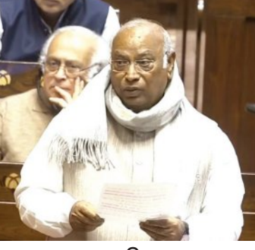
ରାଜ୍ୟସଭାରେ ଉଠାଇ ରାଜନଗର ଅଜ୍ଞାନବାଦି ଭେଦଭାବ ପ୍ରସଙ୍ଗ

ଭୁବନେଶ୍ୱର, ୧୩୧୨ (ସମ୍ବିଧ): କେନ୍ଦ୍ରାପଡା ରାଜନଗର ଅଞ୍ଚଳରେ ଏକ ଅଜ୍ଞାନବାଦି କେନ୍ଦ୍ରରେ ଜାତି ଆଧାରରେ ଭେଦଭାବ କଥା ରାଜ୍ୟସଭାରେ ଉଠିଛି। ରାଜ୍ୟସଭାରେ ବିରୋଧୀ ଦଳ ନେତା ତଥା ଏଆଇସିସି ସଭାପତି ମଲ୍ଲିକାଙ୍କୁ ନେତୃତ୍ୱରେ ଉପରୋକ୍ତ ପ୍ରସଙ୍ଗ ଉଠାଇ ଶେଷ ପ୍ରକାଶ କରିଛନ୍ତି। ଏକବିଂଶ ଶତାବ୍ଦୀରେ ଏପରି ଜାତିଗତ ବର୍ଣ୍ଣବିଷମ, ଭେଦଭାବକୁ ନେଇ ସେ ଚିନ୍ତାବ୍ୟକ୍ତ କରିବା ସହ ଏପରି ଭେଦଭାବ ରହିଲେ ସାଭାବିକ ଭାବେ ଏହା ପିଲାଙ୍କ ବିକାଶ ଉପରେ କୁପ୍ରଭାବ ପକାଇବ ବୋଲି କହିଛନ୍ତି। ଶ୍ରୀ ଖରଗେ କହିଛନ୍ତି ଯେ ଏକବିଂଶ ଶତାବ୍ଦୀରେ ଯେତେବେଳେ ଆମେ ସାମାଜିକ ବିକାଶ, ସଂସ୍କାର କଥା କହୁଛୁ, ହିନ୍ଦୁ ଏକ ହେବାର କଥା କହୁଛୁ, ସେତେବେଳେ ଓଡ଼ିଶାରେ ଏକ ଅଜ୍ଞାନବାଦି କେନ୍ଦ୍ରରେ ଜଣେ ଦଳିତା