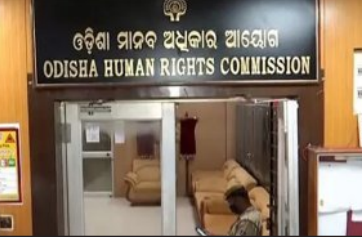
ରାଜ୍ୟରେ ବିଗୁଡ଼ୁଛି ମାନବାଧିକାର ସ୍ଥିତି

ଭୁବନେଶ୍ୱର, ୧୩୧୨ (ସମ୍ବିଧ): ରାଜ୍ୟରେ ମାନବାଧିକାର ସ୍ଥିତି ବିଚିତ୍ରଭାବରେ ଲାଗିଛି। କେନ୍ଦ୍ରାପଡା ଜିଲ୍ଲାରେ ଜଣେ ପାଟିକାଙ୍କୁ ଜାତିଆଣ ଆକ୍ଷେପ କରିବା ଅଭିଯୋଗରେ ସ୍ଥାନୀୟ ଲୋକେ ବହିଷ୍କାର କରୁଛନ୍ତି। ଏକଆରସିଆଳ ମଧ୍ୟ ପ୍ରଶାସନ ବସ୍ତିବାସିଯାଙ୍କ ଘର ଭାଙ୍ଗି ଦେଇଛି। ବିଭିନ୍ନ ପୁଲିସ୍ ଥାନା ଲୋକଙ୍କ ଏତଲା ରଖି ନାହାନ୍ତି; ଓଲଟା ଅତ୍ୟାଚାର କରୁଛନ୍ତି। ହାତପତୁଣ୍ଡ ଭଳି ଜଗନ୍ନାଥ କାଣ୍ଡ ସାମ୍ରାଜ୍ୟ ଆସୁଛି। ପ୍ରଶାସନିକ ଅବହେଳ ଏବଂ ପୁଲିସ୍ ଅତ୍ୟାଚାର ବିରୋଧରେ ଆଇନଗତ ଭାବେ କାର୍ଯ୍ୟାନୁଷ୍ଠାନ ଗ୍ରହଣ କରୁଥିବା ରାଜ୍ୟ ମାନବାଧିକାର କମିସନ ବିରୋଧରେ ଆରମ୍ଭ