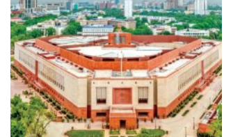
ଲୋକସଭାରେ 'ହରଦୀପ ପୁରା ଇନ୍ଦ୍ରାପା' ଦିଅ ସ୍ୱାଗାତ

ମହିଳା ସହାୟକାଳ ଦ୍ୱାରା ପ୍ରସ୍ତୁତ ଭୋଜନକୁ ଏକ ବିଶେଷ ସମ୍ପ୍ରଦାୟର ଲୋକେ ନିଜ ପିଲାଙ୍କୁ ଖାଇବାକୁ ଦେଉନାହାନ୍ତି। ବିଗତ ୩ ମାସ ହେଲାଣି ଏହି ଅଜ୍ଞାନବାଦି ସେଣ୍ଡରକୁ କେହି ଯାଉନାହାନ୍ତି। ଅଜ୍ଞାନବାଦି ସେଣ୍ଡର ପିଲାଙ୍କ ଶାରୀରିକ ଓ ମାନସିକ ବିକାଶର ମୂଳଦୁଆ ପକାଇଥାଏ। ମାତ୍ର ଯଦି ଏହିପରି ଜାତିଗତ ଭେଦଭାବ ରହିବ, ତାହେଲେ ସାଭାବିକ ଭାବେ ଏହା ପିଲାଙ୍କ ବିକାଶ ଉପରେ କୁପ୍ରଭାବ ପକାଇବ। ଏଭଳି ଜାତିଗତ ବର୍ଣ୍ଣବିଷମ ସମ୍ବନ୍ଧୀୟ ଧାରା ୨୧(ଏ) ଦ୍ୱାରା ପ୍ରଦତ୍ତ ଶିକ୍ଷାର ଅଧିକାରକୁ ସିଧାସଳଖ ପ୍ରଭାବିତ କରୁଛି ବୋଲି ସେଣ୍ଡର ପ୍ରକାଶ କରିଥିଲେ। ସୂଚନାମୋଚ୍ୟ ଯେ କେନ୍ଦ୍ରାପଡା ରାଜନଗର ଅଞ୍ଚଳର ନୂଆଗାଁ ଅଜ୍ଞାନବାଦି କେନ୍ଦ୍ରରେ ୨୦୨୫ ନଭେମ୍ବର ୨୦ରେ ଜଣେ ଅନୁସୂଚିତ ଜାତିର ଯୁବତୀଙ୍କୁ ସହାୟକା ଭାବେ ନିଯୁକ୍ତ