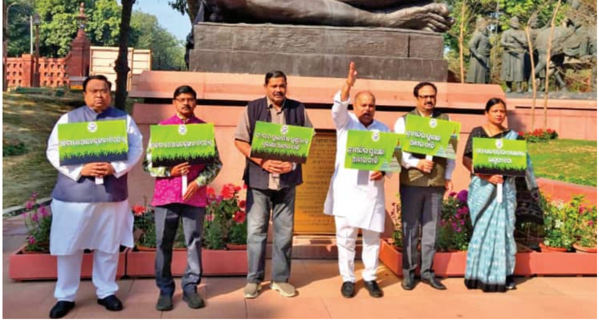
ରାଜ୍ୟରେ ଆଇନଶୁଖିଲା ସ୍ଥିତି ବିପର୍ଯ୍ୟୟ ଅଭିଯୋଗରେ ଗୁରୁବାର ସଂସଦ ଭବନ ପରିସରରେ ଥିବା ଗାନ୍ଧୀ ମୂର୍ତ୍ତି ତଳେ ବିଜେଡି ସାଂସଦଙ୍କ ପ୍ରତିବାଦ

■ ନୂଆଦିଲ୍ଲୀ/ ଭୁବନେଶ୍ୱର, ୧୨/୨ (ସମ୍ପାଦକ): ଦେଶର ୧୦ଟି କେନ୍ଦ୍ରୀୟ ଶ୍ରମିକ ସଂଗଠନ ଓ କୃଷକ ସଂଗଠନ ପକ୍ଷରୁ ଗୁରୁବାର ତାକରା ଦିଆଯାଇଥିବା 'ଭାରତ ବନ୍ଦ' ମିଶ୍ରିତ ପ୍ରତୀକ ଦେଖିବାକୁ ମିଳିଛି। କେନ୍ଦ୍ର ସରକାରଙ୍କ ଶ୍ରମନୀତି, ୪ଟି ନୂଆ ଶ୍ରମକୋଡ୍ ଏବଂ ଭାରତ- ଆମେରିକା ବାଣିଜ୍ୟ ଚୁକ୍ତିକୁ ବିରୋଧ କରି ଏହି ବନ୍ଦ ତାକରା ଦିଆଯାଇଥିଲା। ପଞ୍ଜାବରେ ଶ୍ରମିକ ଓ କୃଷକ ସଂଗଠନଗୁଡ଼ିକ ଧର୍ମଘଟ କରିଥିଲେ। ଠିକା କର୍ମଚାରୀମାନେ କାର୍ଯ୍ୟକ୍ରମରେ କାମ କରି ରଖୁଥିଲେ। ପଞ୍ଜାବରେ ସରକାରୀ ବିଭାଗରେ କାର୍ଯ୍ୟ ଆଣିକ ପ୍ରଭାବିତ ହୋଇଛି। ବନ୍ଦ ସାଥୀରେ ବ୍ୟାଙ୍କ ଖୋଲା ରହିଥିଲା ଓ ସାଧାରଣ ଦିନ ଭଳି କାର୍ଯ୍ୟ ଜାରି ରହିଥିଲା। ଅଲ ଇଣ୍ଡିଆ ପାଠ୍ୟ ପଢ଼ା ଲଞ୍ଜିନିୟର୍ସ ଫେଡେରେସନ୍ ଶ୍ରମକୋଡ୍ ଏବଂ ଭାରତ- ଆମେରିକା ବାଣିଜ୍ୟ ଚୁକ୍ତିକୁ ବିରୋଧ କରି ଏହି ବନ୍ଦ ତାକରା ଦିଆଯାଇଥିଲା। ପଞ୍ଜାବରେ ଶ୍ରମିକ ଓ କୃଷକ ସଂଗଠନଗୁଡ଼ିକ ଧର୍ମଘଟ କରିଥିଲେ। ଠିକା କର୍ମଚାରୀମାନେ କାର୍ଯ୍ୟକ୍ରମରେ କାମ କରି ରଖୁଥିବା ବେଳେ ନିୟମିତ