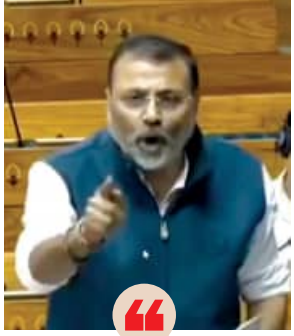
ରାହୁଲ ଗାନ୍ଧୀ ମିଥ୍ୟା ଓ ମନଗଢ଼ା ଅଭିଯୋଗ ଆଣି ଦେଶରେ ଅସ୍ଥିରତା ସୃଷ୍ଟି କରିବାକୁ ଉଦ୍ୟମ କରୁଛନ୍ତି

■ ନୂଆଦିଲ୍ଲୀ, ୧୨/୨ (ଏକେନ୍ଦ୍ର): ଭାରତ-ଆମେରିକା ବାଣିଜ୍ୟ ଚୁକ୍ତିକୁ ନେଇ କାତାୟ ରାଜନୀତିରେ ହଟ୍ଟତମ ସୃଷ୍ଟି ହୋଇଥିବା ବେଳେ ଲୋକସଭାରେ ବିରୋଧୀ ଦଳର ନେତା ରାହୁଲ ଗାନ୍ଧୀଙ୍କର ସାଂସଦ ପଦ ରଦ୍ଦ କରିବା ଲାଗି ବିଜେପି ସାଂସଦ ନୋଟିସ୍ ଦେଇଛନ୍ତି। ବିଜେପିର ଏହି ସାଂସଦ ହେଉଛନ୍ତି ନିଶିତା ଚାନ୍ଦେ। ବାଣିଜ୍ୟ ଚୁକ୍ତି ଓ ପୂର୍ବଦିନ ସେନା ଅଧ୍ୟକ୍ଷ ଜେନେରାଲ ନରବାଣେଙ୍କ ଅପକୀର୍ଣ୍ଣ ପୃଷ୍ଠକ ଠାରୁ ଆରମ୍ଭ କରି ବିଭିନ୍ନ ବିବାଦୀୟ ପ୍ରସଙ୍ଗ ନେଇ ରାହୁଲ ଏବଂ ବିଜେପି ସାଂସଦ ମୁହାଁମୁହିଁ ଅବସ୍ଥାରେ ଥିବାବେଳେ ଦୁବେ ଆଜି ଏଭଳି ନୋଟିସ୍ ଦେଇଛନ୍ତି। ସେ ଅଭିଯୋଗ କରିଛନ୍ତି ଯେ ରାହୁଲ ଗାନ୍ଧୀ ଓ