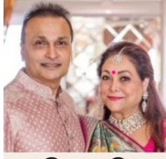
ବଡ଼ିଲା ଅନିଲ ଅମ୍ବାନୀଙ୍କ ଅଭିଯୋଗ

■ ନୂଆଦିଲ୍ଲୀ, ୧୦/୨ (ଏକେନ୍ସି): ବଡ଼ିବାରେ ଲାଗିଛି ଅନିଲ ଅମ୍ବାନୀ ଏବଂ ତାଙ୍କ ପରିବାର ପାଇଁ ସମସ୍ୟା। ମନି ଲଣ୍ଡର ମାମଲାରେ ପତରାଉତରା ପାଇଁ ପ୍ରବର୍ତ୍ତନ ନିର୍ଦ୍ଦେଶାଳୟ (ଇଡି) ଖୁବ୍ ଶୀଘ୍ର ରିଲାଏଣ୍ଟ ଗୁପ୍ତ ଅଧିକାରୀଙ୍କୁ ଅନୁମୋଦିତ ପତ୍ର ଟିନା ଅମ୍ବାନୀଙ୍କୁ ନୂତନ ସମନ ଜାରି କରିବ। ୬୮ ବର୍ଷୀୟ ପୂର୍ବତନ ଅଧିକାରୀ ଟିନା ଅମ୍ବାନୀଙ୍କୁ ଫେବୃଆରୀ ୯ ତାରିଖରେ ଚପକ୍ଷକାରୀ ସଂସ୍ଥା ସମ୍ମୁଖରେ ହାଜର ହେବାର ଅଛି, କିନ୍ତୁ ସେ ହାଜର ହୋଇ ନ ଥିଲେ। ଅଧିକାରୀଙ୍କ ଅନୁମୋଦିତ ପତ୍ର ଟିନା ଅମ୍ବାନୀଙ୍କୁ ନୂତନ ସମନ ଜାରି କରିବ। ଏହି ମାମଲା ନ୍ୟୁଜିଲାଣ୍ଡରେ ଏକ ବିକାସପୂର୍ଣ୍ଣ ଆପାର୍ଟମେଣ୍ଟ କ୍ରୟ ସହିତ