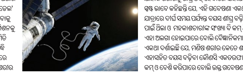
ଯାହାକି ଶରୀରକୁ ଶାନ୍ତ ଠିକ୍ ହେବାରେ ସାହାଯ୍ୟ କରେ। ତେବେ ବୈଜ୍ଞାନିକମାନେ ସ୍ପଷ୍ଟ ଭାବେ କହିଛନ୍ତି ଯେ, ଏହି ଗବେଷଣା ଏକଥା ପ୍ରମାଣିତ କରି ନାହିଁ ଯେ, ମହାକାଶ ଯାତ୍ରାରେ ବାର୍ଦ୍ଧି ସମୟ ପର୍ଯ୍ୟନ୍ତ ବୟସ ଶାନ୍ତ ବଢ଼ିଥାଏ। କାରଣ ଉଚ୍ଚ ମିଶନ ବେଶ୍ ସ୍ୱଳ୍ପ ସମୟ ପାଇଁ ଥିଲା ଓ ମହାକାଶଚାରୀଙ୍କ ଫର୍ମା ବି କମ୍ ଥିଲା। ତେଣୁ ବାର୍ଦ୍ଧିକାଳୀନ ମହାକାଶ ଯାତ୍ରାରେ ଏହା ଅଲଗା ହୋଇପାରେ ବୋଲି ବୈଜ୍ଞାନିକମାନେ ମତ ଦେଇଛନ୍ତି। ଏହାବାଦ୍ ଏହି ଗବେଷଣା ଏକଥା ଦର୍ଶାଇଛି ଯେ, ମଣିଷ ଶରୀର କେତେ ଶାନ୍ତ କିପରି ପରିସ୍ଥିତି ଅନୁସାରେ ନିଜକୁ ପରିବର୍ତ୍ତନ କରିଥାଏ। ଏହାସହିତ ବୟସ ବଢ଼ିବା କୌଣସି ଏକତରଫୀ ପ୍ରକ୍ରିୟା ନୁହେଁ। ପରିବେଶ ଏବଂ ପରିସ୍ଥିତି ବୟସ ବଢ଼ିବା ଗତିକୁ ଜମ୍ପ ଓ ବେଶ୍ କରିପାରେ ବୋଲି ଉଚ୍ଚ ଗବେଷଣା ଏକପ୍ରକାର ସ୍ପଷ୍ଟ କରିଛି।

ଏକପ୍ରକାର ସ୍ତେୟ ମୋଡ଼କୁ ଗତି କରେ। ଏହାର ଅର୍ଥ ଏହା ନୁହେଁ ଯେ, ମହାକାଶଚାରୀ ସତରେ କୁଡ଼ା ହୋଇଯାନ୍ତି। ଅବଶ୍ୟ ଏଭଳି ପରିବର୍ତ୍ତନ ଅସ୍ଥାୟୀ ହୋଇଥାଏ। ପରିବେଶ ବଦଳିବା ମାତ୍ରେ ହିଁ ଶରୀର ଏହାକୁ ସମାଜି ନିଏ। ସେହିପରି ଉଚ୍ଚ ଗବେଷଣାରେ ୪ ଜଣ ମହାକାଶଚାରୀଙ୍କୁ ସାମିଲ କରାଯାଇଥିଲା। ଏହି ମହାକାଶଚାରୀମାନେ ଇଣ୍ଡୋନେସିଆର ସ୍ତେୟ ସ୍ତେୟରେ ୯ ଦିନ ଅଭିବାହିତ କରିଥିଲେ। ବୈଜ୍ଞାନିକମାନେ ସେମାନେ ମହାକାଶକୁ ଯିବା ପୂର୍ବରୁ, ମିଶନ ସମୟରେ ଏବଂ ପୃଥିବୀପୃଷ୍ଠ ଫେରିବା ପରେ ସେମାନଙ୍କର ରକ୍ତ ନମୁନା ଫର୍ଗୁସ୍ କରିଥିଲେ। ଏହାଦ୍ୱାରା ବାସ୍ତବିକ ସମୟ ମଧ୍ୟରେ ଶରୀରରେ ହେଉଥିବା ପରିବର୍ତ୍ତନକୁ ଜାଣିବା ପାଇଁ ଦେଖି କରାଯାଇଥିଲା। ଅନ୍ୟପକ୍ଷେ ଏହି ଗବେଷଣାରେ ବୟସ୍କ କ୍ୟାଲେଣ୍ଡର ଅଧାରରେ ନୁହେଁ, ବରଂ ଏପିକେନେଟିକ୍ ଘଣ୍ଟା ଦ୍ୱାରା ମପାଗଲା। ଏହି ଘଣ୍ଟା ଡିଏନ୍ଏରେ ହେଉଥିବା ପରିବର୍ତ୍ତନ ଅଧାରରେ ଶରୀରର ଜୈବିକ ବୟସ ବାଦ୍ଦରେ ଜଣାଏ। ଏହା ଚାପ ଏବଂ ପରିବେଶ ଯୋଗୁଁ ପ୍ରଭାବିତ ହୋଇପାରେ। ମହାକାଶରେ ରହିବା ସମୟରେ ଏହି ଘଣ୍ଟାରେ ଅସ୍ଥାୟୀ ବୃଦ୍ଧି ଦେଖିବାକୁ ମିଳିଲା। ଗୁରୁତ୍ୱପୂର୍ଣ୍ଣ କଥାଟି ହେଲା, ଏହା ପ୍ରତ୍ୟେକ ମହାକାଶଚାରୀଙ୍କଠାରେ ଅଲଗା ଅଲଗା ଭାବରେ ଥିଲା। ସେହିପରି ପୃଥିବୀପୃଷ୍ଠ ଫେରିବା ପରେ ଅଧିକାଂଶ ମହାକାଶଚାରୀଙ୍କ ଜୈବିକ ବୟସ ପୂଣି ଥରେ ପୂର୍ଣ୍ଣ ଭଳି ହୋଇଯାଇଥିଲା। ବୈଜ୍ଞାନିକ ମତରେ, ଏଥିରେ ଇମ୍ୟୁନୋ ସିଷ୍ଟମର ବଡ଼ ଭୂମିକା ରହିଛି।