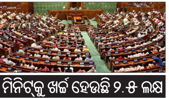
ମିନିଟ୍ କୁ ଖର୍ଚ୍ଚ ହେଉଛି ୨.୫ ଲକ୍ଷ

ନୂଆଦିଲ୍ଲୀ, ୨୨ (ଏକେଡ୍): ସଂସଦରେ ଅଚଳାକାବୟା କାରି ରହିଛି । ବିରୋଧୀଙ୍କ ହଜାମା ଯୋଗୁଁ ଲୋକସଭା ଏବଂ ରାଜ୍ୟସଭା କାର୍ଯ୍ୟ ସୁରୁଖୁରରେ ଚାଲି ପାରୁ ନାହିଁ । ବିରୋଧୀ ପାର୍ଟିର ଦେଖାଇବା ଏବଂ ସ୍ପୋଗାନ ଦେବା ଯୋଗୁଁ ଲୋକସଭାକୁ ପ୍ରଥମେ ଚିନି ମିନିଟ୍ ଏବଂ ପରେ ୬ ମିନିଟ୍ ପର୍ଯ୍ୟନ୍ତ ଚାଲି ପାରିଥିଲା । ଏହା ପରେ ନିମ୍ନ ସଦନକୁ ସୋମବାର ପର୍ଯ୍ୟନ୍ତ ମୁଲତବା ରଖାଯାଇଥିଲା । ଏ ପର୍ଯ୍ୟନ୍ତ ଲୋକସଭାରେ ୧୯ ଘଣ୍ଟା ୧୩ ମିନିଟ୍ ବରବାଦ ହୋଇଛି । ଅନ୍ୟପକ୍ଷେ ରାଜ୍ୟସଭାରେ ମଧ୍ୟ ସମାନ ସ୍ଥିତି ରହିଛି । ଆଜି ଉଚ୍ଚ ସଦନ ମାତ୍ର ଦୁଇ ଘଣ୍ଟା ପାଇଁ ଚାଲିବା ପରେ ସୋମବାର ଯାଏଁ ମୁଲତବା ରହିଛି । ପ୍ରଶ୍ନକାଳ ସମୟରେ କେନ୍ଦ୍ରମନ୍ତ୍ରୀ ରବନାତ ବିଜୁଙ୍କୁ ନେଇ ଲୋକସଭା ବିରୋଧୀ ଦଳ ନେତା ରାହୁଲ ଗାନ୍ଧୀ ଦେଖାଯାଇ ବିପକ୍ଷକୁ ନେଇ କଂଗ୍ରେସ ଅଧ୍ୟକ୍ଷ ମଲ୍ଲିକାର୍ଜୁନ ଖଟ୍ଟେ ଏବଂ ରେଳମନ୍ତ୍ରୀ ଅଶ୍ୱିନୀ ଦେବିଙ୍କୁ ମଧ୍ୟରେ କୋରଦାର ବିତର୍କ ହେଇ ଥିଲା । ସେହିପରି ପ୍ରତ୍ୟେକ ଚାଷୀଙ୍କ ଏକକ ପରିଚୟ ପତ୍ର ପ୍ରଦାନ କରାଯିବ ବୋଲି କୃଷିମନ୍ତ୍ରୀ ଶିବରାଜ ସିଂହ ଚୈହାନ ସୂଚନା ଦେଇଥିଲେ । ସବୁ ରାଜ୍ୟରେ ଚାଷୀ ଚେଷ୍ଟେଇଁ କାରି ରହିବ ବୋଲି କହିଥିଲେ ।