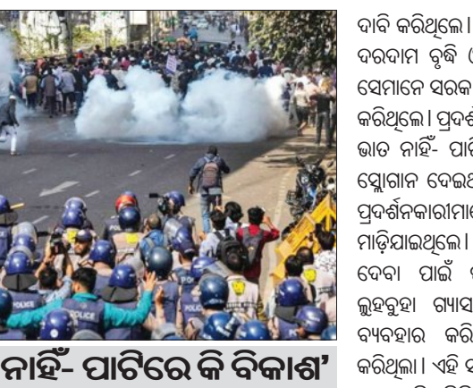
'ପେଟରେ ଭାତ ନାହିଁ- ପାଟିରେ କି ବିକାଶ'

ଡାକା, ୨୨ (ଏକେଡ୍): ବାଂଲାଦେଶରେ ସାଧାରଣ ନିର୍ବାଚନ ହେବାକୁ ଆଉ ମାତ୍ର ୬ ଦିନ ବାକି ରହିଛି । ଏପରି ସମୟରେ ରାଜଧାନୀ ଡାକାରେ ଶୁକ୍ରବାର ଦିନ ଭୟଙ୍କର ହିଂସାକାଣ୍ଡ ଘଟିଛି । ଅନ୍ତରାଳ ସରକାରଙ୍କ ମୁଖ୍ୟ ଉପଦେଷ୍ଟା ମହମ୍ମଦ ଯୁନୁସଙ୍କ ସରକାରୀ ବାସଭବନ 'ଯମୁନା' ବାହାରେ ବହୁ ଧରଣର ସଂଘର୍ଷ ଦେଖିବାକୁ ମିଳିଛି । ୯ମ ଜାତୀୟ ବେତନ ସ୍କେଲ କାର୍ଯ୍ୟକାରୀ କରିବା ଦାବିରେ ସରକାରୀ କର୍ମଚାରୀମାନେ ବିରୋଧ ପ୍ରଦର୍ଶନ କରିଥିଲେ । ଫଳରେ ପୁଲିସ ସହ ସେମାନଙ୍କର ସଂଘର୍ଷ ହୋଇଥିଲା । ଏଥିରେ ଅନେକ ଆହତ ହୋଇଛନ୍ତି । ୨୦୨୫ ଅଗଷ୍ଟରେ ହୋଇଥିବା ହିଂସା ପରେ ଶେଷ ହେବା ସରକାରକୁ ଗାଦିଚ୍ୟୁତ କରାଯାଇଥିଲା । ଏହାପରେ ପ୍ରଥମଥର ପାଇଁ ସରକାର ଗଠନ ନିମନ୍ତେ ଆସନ୍ତା ୧୨ ତାରିଖରେ ନିର୍ବାଚନ ହେବାକୁ ଯାଉଛି । କିନ୍ତୁ ଏହା ପୂର୍ବରୁ ସୃଷ୍ଟି ହୋଇଥିବା ଏହି ଅଶାନ୍ତି ସୁନୁସଙ୍କ ନେତୃତ୍ୱାଧୀନ ଅନ୍ତରାଳ ସରକାରଙ୍କ ପାଇଁ ଏକ ବଡ଼ ଚ୍ୟାଲେଞ୍ଜ ସୃଷ୍ଟି ହୋଇଛି । ସେ ଜାଣିଶୁଣି ନିର୍ବାଚନକୁ