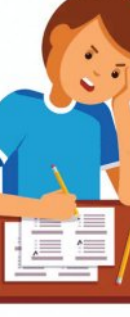
ଗୋବିନ୍ଦପୁର ଉଚ୍ଚ ବିଦ୍ୟାଳୟ ଗୋବିନ୍ଦା, ଗଞ୍ଜାମ