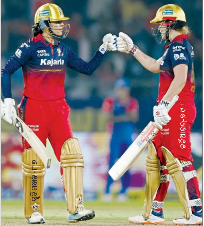
ମ୍ୟାଚ୍‌ରେ ୨୦୪ ରନର ବିଶାଳ ଲକ୍ଷ୍ୟକୁ ଉଭୟ ପ୍ରଥମ ଦଳରେ ବିସ୍ଫୋରକ ପିଛା କରିଥିବା ଦେଖାଯାଇଛି।