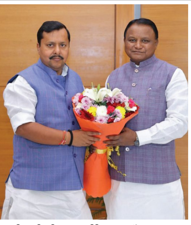
ପୁଅଦିଲ୍ଲୀରେ ବିଜେଡି ରାଷ୍ଟ୍ରୀୟ ଅଧ୍ୟକ୍ଷ ନିତ୍ୟ ନବୀନଙ୍କୁ ସୌଜନ୍ୟମୂଳକ ସାକ୍ଷାତ କରୁଛନ୍ତି ମୁଖ୍ୟମନ୍ତ୍ରୀ ମୋହନ ଚରଣ ମାଝା

ଭୁବନେଶ୍ୱର, ୨୭।୨।୨୬(ସମ୍ପାଦକ): ଆସନ୍ତା ଫେବୃଆରୀ ୨୮ ତାରିଖରେ କେନ୍ଦ୍ର ଗୃହ ତଥା ସମବାୟ ମନ୍ତ୍ରୀ ଅମିତ ଶାହା ୨ ଦିନିଆ ଗସ୍ତରେ ଓଡ଼ିଶା ଆସୁଛନ୍ତି। ମିଳିଥିବା ସୂଚନା ଅନୁଯାୟୀ, କେନ୍ଦ୍ରମନ୍ତ୍ରୀ ଫେବୃଆରୀ ୨୮ ତାରିଖରେ କେନ୍ଦ୍ର ଗୃହ ମନ୍ତ୍ରାଳୟରେ କେନ୍ଦ୍ର ଗୃହ ମନ୍ତ୍ରୀ ଅମିତ ଶାହାଙ୍କୁ ଭେଟିବା ପାଇଁ ଓଡ଼ିଶାରେ ପହଞ୍ଚିବେ। ଓଡ଼ିଶା ପୂର୍ବରୁ କେନ୍ଦ୍ର ଗୃହ ମନ୍ତ୍ରାଳୟରେ ସମ୍ମାନାମା ପ୍ରଦାନ ପ୍ରତିଷ୍ଠା ଦିବସ କାର୍ଯ୍ୟକ୍ରମରେ ଯୋଗଦେବେ। ଅପରପକ୍ଷରେ ଖୋର୍ଦ୍ଧା ଜିଲ୍ଲାରେ କାର୍ଯ୍ୟକ୍ରମ ପାଇଁ ଓଡ଼ିଶାରେ ପହଞ୍ଚିବେ। ଓଡ଼ିଶା ପୂର୍ବରୁ କେନ୍ଦ୍ର ଗୃହ ମନ୍ତ୍ରାଳୟରେ ସମ୍ମାନାମା ପ୍ରଦାନ ପ୍ରତିଷ୍ଠା ଦିବସ କାର୍ଯ୍ୟକ୍ରମରେ ଯୋଗଦେବେ। ଅପରପକ୍ଷରେ ଖୋର୍ଦ୍ଧା ଜିଲ୍ଲାରେ କାର୍ଯ୍ୟକ୍ରମ ପାଇଁ ଓଡ଼ିଶାରେ ପହଞ୍ଚିବେ। ଓଡ଼ିଶା ପୂର୍ବରୁ କେନ୍ଦ୍ର ଗୃହ ମନ୍ତ୍ରାଳୟରେ ସମ୍ମାନାମା ପ୍ରଦାନ ପ୍ରତିଷ୍ଠା ଦିବସ କାର୍ଯ୍ୟକ୍ରମରେ ଯୋଗଦେବେ। ଅପରପକ୍ଷରେ ଖୋର୍ଦ୍ଧା ଜିଲ୍ଲାରେ କାର୍ଯ୍ୟକ୍ରମ ପାଇଁ ଓଡ଼ିଶାରେ ପହଞ୍ଚିବେ।