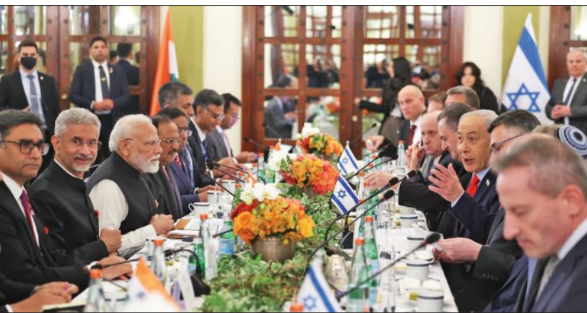
ନରେନ୍ଦ୍ର ମୋଦୀ ଏବଂ ବେଞ୍ଜାମିନ ନେତନ୍ୟାହୁଙ୍କ ମଧ୍ୟରେ ଦ୍ୱିପକ୍ଷୀୟ ବୈଠକ ଅନୁଷ୍ଠିତ ହୋଇଯାଇଛି ।

ଇସ୍ରାଏଲ ପ୍ରଧାନମନ୍ତ୍ରୀ କହିଥିଲେ ଯେ ଏହି ଗସ୍ତ ସଫଳ ରହିଛି । ଏହା ହୃଦୟକୁ ଛୁଇଁ ଯାଇଛି । କାନିସିଗ୍ରେ ମୋଦୀ ଦେଉଥିବା ନିବନ୍ଧନ ହୃଦୟକୁ ଛୁଇଁ ଯାଇଥିଲା । ପୂର୍ବରୁ ଯେଉଁ ସାମାଜିକ ଅନ୍ଧକାର ଥିଲା ଏବେ ତାହା ଆଉ ସମସ୍ୟା ପାଲଟି ନାହିଁ । ନବୋଦ୍ଦେଶ କରୁଥିବା ଦେଶର ଭବିଷ୍ୟତ ହିଁ ଉତ୍ତମ ହେବ । ଏହା ସହିତ ଭାରତରେ ଜିଡିପି ବୈଠକ ଆୟୋଜନ ପାଇଁ ଦୁଇ ନେତା ସହମତି ପ୍ରକାଶ କରିଛନ୍ତି । ସେହିପରି ଇସ୍ରାଏଲ ଆସିବା ମୋ ପାଇଁ ଗର୍ବର ବିଷୟ ବୋଲି ମୋଦୀ କହିଛନ୍ତି । ଏହା ପୂର୍ବରୁ ମୋଦୀ କେନ୍ଦ୍ରକେଳମର ହୋଲୋକାଷ୍ଟ ମେମୋରିଆଲ 'ୟାଦ୍‌ଏସେମ'ରେ ପହଞ୍ଚି ଥିଲେ । ସେଠାରେ ସେ ହିନ୍ଦଲରକ୍ ନାଟି ଶାସନରେ ପ୍ରାଣ ହରାଇଥିବା ୬୦ ଲକ୍ଷ ଇହୁଦୀଙ୍କୁ ଶ୍ରଦ୍ଧାଞ୍ଜଳୀ ଦେଇଥିଲେ ।