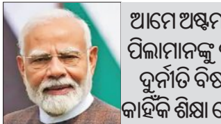
ଆମେ ଅମ୍ବୁନି ଏନ୍‌ସିଇଆରଟି ପିଲାମାନଙ୍କୁ ନ୍ୟାୟିକ ଦୁର୍ନୀତି ବିଷୟରେ କାହିଁକି ଶିକ୍ଷା ଦେଉଛୁ?

ଓ ଏହି ଘଟଣା ପାଇଁ ଦୁଃଖ ପ୍ରକାଶ କରୁଛି । ସେ ଏ ସଂକ୍ରାନ୍ତରେ ସଂଶୋଧନ ପାଇଁ ନିର୍ଦ୍ଦେଶ ଦେଇଥିଲେ । ଏହି ବିବାଦର ଅଧ୍ୟାୟ ପ୍ରସ୍ତୁତ କରିବାରେ ସମ୍ପୃକ୍ତ ନ୍ୟାୟପାଳିକା ପ୍ରତି ସମ୍ମାନ ରହିଛି । ପ୍ରତି ସମ୍ମାନ ରହିଛି । ପ୍ରଧାନମନ୍ତ୍ରୀଙ୍କ ବିରୋଧରେ ଉପଯୁକ୍ତ କାର୍ଯ୍ୟାନୁଷ୍ଠାନ ଗ୍ରହଣ କରାଯିବ ବୋଲି ସେ କହିଛନ୍ତି । ସେ ସ୍ୱେଚ୍ଛା କରୁଛନ୍ତି ଯେ ନ୍ୟାୟପାଳିକାକୁ ଅସମ୍ମାନ କରିବା ସରକାରଙ୍କର କୌଣସି ଉଦ୍ଦେଶ୍ୟ ନଥାନ୍ତା ।