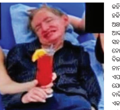
ଏବେ ହକିଙ୍ଗ୍‌ଙ୍କ ପରିବାର ତରଫରୁ ଆନୁଷ୍ଠାନିକ ଭାବେ ସ୍ୱାକ୍ଷରଣ ଦିଆଯାଇଛି । ତାଙ୍କ ପରିବାରର ଜଣେ ପ୍ରତିନିଧି

ଝାନ୍ସି, ୨୬ 1୨ (ଏକେନ୍ଦ୍ର): ବିଶିଷ୍ଟ ପଦାର୍ଥ ବିଜ୍ଞାନୀ ସର୍ଗେ ଷ୍ଟିଫେନ ହକିଙ୍ଗ୍ ପୂର୍ଣ୍ଣସମୟରେ ଚର୍ଚ୍ଚାକୁ ଆସିଛନ୍ତି । ନିକଟରେ ସାର୍ବଜନୀନ ହୋଇଥିବା ଜେପ୍ଟି ଏପଷ୍ଟିନ ପାଇଲୁ କିଛି ଫଟୋ ସାମ୍ନାକୁ ଆସିଛି, ଯେଉଁଥିରେ ହକିଙ୍ଗ୍ ଦୁଇଜଣ ବିକିନି ପରିହିତ ମହିଳାଙ୍କ ସହ ବସିଥିବାର ଦେଖାଯାଇଛି । ତେବେ ଏହି ଘଟଣାକୁ ନେଇ ହକିଙ୍ଗ୍‌ଙ୍କ ପରିବାର ତରଫରୁ କଡ଼ା ପ୍ରତିକ୍ରିୟା ପ୍ରକାଶ ପାଇଛି । 'ଦି ଇଣ୍ଡିପେନ୍ଡେଣ୍ଟ' ଖବର କାଗଜ ଅନୁଯାୟୀ, ହାତରେ କକ୍‌ଲେଟ୍ ଧରି ସନ୍ ଲାଉଞ୍ଜରେ ଶୋଇଥିବା ହକିଙ୍ଗ୍‌ଙ୍କ ଜଣେ ମହିଳା ସ୍ତ୍ରୀ ଭାବେ ଧରିଥିଲେ ଓ ଆଉ ଜଣେ ମହିଳା ପାଖରେ ଅଛନ୍ତି । ଏହି ମହିଳାମାନେ ତାଙ୍କର ଦୀର୍ଘକାଳୀନ ସେବାକାରୀ ଥିଲେ, ଯେଉଁମାନେ ହକିଙ୍ଗ୍‌ଙ୍କୁ ଦିନରାତି ଚିକିତ୍ସା ସହାୟତା ଯୋଗାଇବା ପାଇଁ ରହିଥିଲେ । ଏହି ଫଟୋଟି ୨୦୦୬ ମସିହାର ବୋଲି ଅନୁମାନ କରାଯାଇଛି । ସେତେବେଳେ ହକିଙ୍ଗ୍ ଏକ ବିଜ୍ଞାନ ସମ୍ମିଳନୀରେ ଯୋଗଦେବା ପାଇଁ ସେହି ଥୋପାଏ ଗସ୍ତ କରିଥିଲେ ।