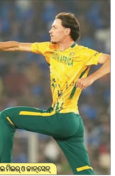
ଦକ୍ଷିଣ ଆଫ୍ରିକାକୁ ଜିତାଇଲେ ମିଲର ଓ ଜାନସେନ୍

କେହି ବେଶି ସମୟ ଚିଷ୍ଟି ନ ଥିଲେ । ସୂର୍ଯ୍ୟକୁମାର ଯାଦବ ଓ ହାର୍ଦ୍ଦିକ ପାଣ୍ଡ୍ୟା ୧୮ ରନ ଲେଖାଏଁ ଏଗ୍ରହ କରିଥିଲେ । ବିଶ୍ୱୋରକ ବ୍ୟାଟିଂ କରୁଥିବା ଇଶାନ କିଶାନ ୪ଟି ବଲରେ ୦ ଓ ହ୍ୟାଟ୍‌ରିକ୍ ଶୂନ୍ୟରେ ଆଉଟ୍ ହୋଇଥିବା ଅଭିଷେକ ଶର୍ମା ଏଠାରେ ୧୨ ବଲରୁ ୧୫ ରନ କରିଥିଲେ । ନିର୍ଦ୍ଧାରଣାତ୍ମକ ଚଳିତ ବର୍ଷ ୧ ରନକୁ ୬ ଓ ୦ ରନରେ ଆଉଟ୍ ହୋଇଥିଲେ । ଦକ୍ଷିଣ ଆଫ୍ରିକା ପକ୍ଷରୁ ମାର୍କୋ ଜାନସେନ୍ ସର୍ବାଧିକ ୪୮ଟି, ବାମହାତୀ ଫିନର କେଶବ ମହାରାଜ ୩୮ଟି ଓ କୋର୍ଟିନ ବୋୟ୍‌ସ୍ ୨୮ଟି ୱିକେଟ୍ ଅଳ୍ପିଆର କରିଥିଲେ ।