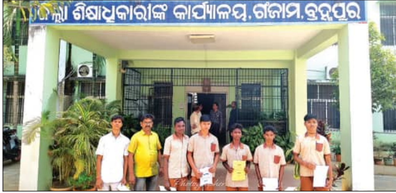
ସୂଚନାଯୋଗ୍ୟ, ସ୍ଥାନୀୟ ପିଏମ୍‌ଗ୍ରା ସିଟି ଉଚ୍ଚବିଦ୍ୟାଳୟର ଦଶମ ଶ୍ରେଣୀ ପରୀକ୍ଷାର୍ଥୀଙ୍କ ସେଣ୍ଟର ବାବାଜୀଚୌଡ଼ା ନିକଟସ୍ଥ ସରକାରୀ ବିନ୍ଦୁ