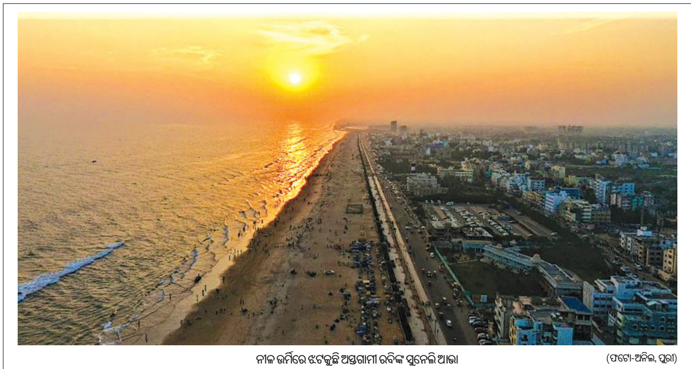
ନାଳ ଭର୍ମିରେ ଟେକୁଛି ଅଷ୍ଟଗାମୀ ରବିକ ସୁନେଲି ଆରା