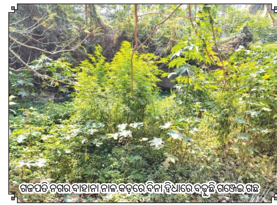
ଗଜପତି ନଗର ବାହାନା ନାଳ କଡ଼ରେ ବିନା ଦ୍ଵିଧାରେ ବଢ଼ୁଛି ଗଞ୍ଜୋଇ ଗଛ