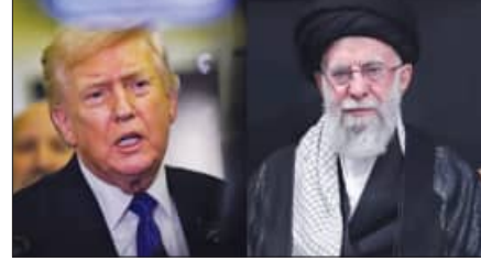
ଟ୍ରମ୍ପ କଟକଣା ହଟାଇଲେ ଚୁକ୍ତି ସମ୍ଭବ ବୋଲି କହିଲେ ଉପ-ବୈଦେଶିକ ମନ୍ତ୍ରୀ

ଓଫିସ୍‌ରେ/ଡେହୋରା, ୧୫ ୧୨ (ଏକେଡି): ଆମେରିକା ସହ ପରମାଣୁ ଚୁକ୍ତିକୁ ନେଇ ଇରାନ ପୁଣିଥରେ ଆଲୋଚନା ପାଇଁ ଇଚ୍ଛା ପ୍ରକାଶ କରିଛି । ଇରାନ ଉପ-ବୈଦେଶିକ ମନ୍ତ୍ରୀ ମଜିଦ୍ ତଖ୍ତ-ରଞ୍ଜି ବିବିଷୟକୁ ଦେଇଥିବା ସାକ୍ଷାତକାରରେ କହିଛନ୍ତି ଯେ, ଯଦି ଆମେରିକା କଟକଣା ହଟାଇବା ବିଷୟରେ ଆଲୋଚନା ପାଇଁ ପ୍ରସ୍ତୁତ, ତେବେ ଇରାନ ପରମାଣୁ କାର୍ଯ୍ୟକ୍ରମ ସହିତ ଜଡ଼ିତ ଅନେକ ପ୍ରସଙ୍ଗରେ କୁଖ୍ୟାତ କରିବାକୁ ରାଜି ଅଛି । ଆସନ୍ତା ମଇମାସର ଦିନ କେବେପାଇଁ ଦୂଳ ଦେଶ ମଧ୍ୟରେ ପରବର୍ତ୍ତୀ ପର୍ଯ୍ୟାୟ ଆଲୋଚନା ହେବ । ଅନ୍ୟପକ୍ଷେ ଆମେରିକା ପକ୍ଷରୁ ବାରମ୍ବାର କୁହାଯାଇଛି ଯେ, ପରମାଣୁ ଆଲୋଚନା ଅଟକିବା ପଛରେ ଇରାନ ହିଁ ଦାୟୀ । ତେବେ ବାଲିଷ୍ଠିକ ମିଆଜଲ ପ୍ରକଳ୍ପ ଉପରେ ଆମେରିକା ସହ କୌଣସି ଆଲୋଚନା ହେବନାହିଁ ବୋଲି ରଞ୍ଜି କହିଛନ୍ତି । ସେ କହିଛନ୍ତି ଯେ, ଯେତେବେଳେ ଇସ୍ରାଏଲ ଓ ଆମେରିକା ଆମ ପକ୍ଷରେ