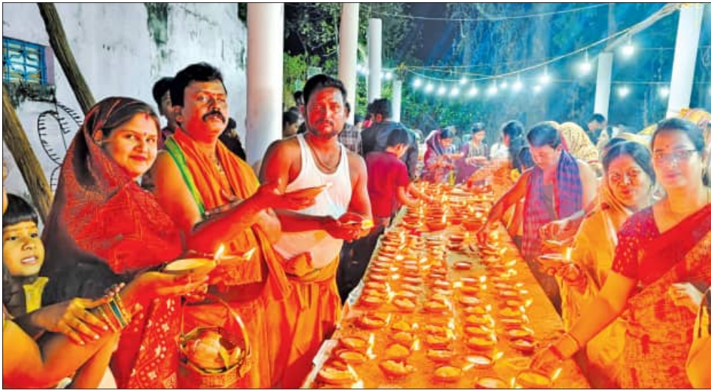
ବେଳଗୁଣ୍ଡା, ୧୫ 1୨ (ସମିପ):

ଶିବରାତ୍ରି ଉପଲକ୍ଷେ ବେଳଗୁଣ୍ଡା ବ୍ଲକ୍ ବିଭିନ୍ନ ଶୈବ ପୀଠ ଚଳଚଞ୍ଚଳ ହେବା ସହିତ ଭକ୍ତଙ୍କ ଗହଳ ଦେଖିବାକୁ ମିଳିଥିଲା । ବ୍ଲକ୍ ଗାଙ୍ଗପୁର ସ୍ଥିତ ସ୍ୱପ୍ନେଶ୍ୱର ମନ୍ଦିର, ବୋରାଗର ସିଦ୍ଧେଶ୍ୱର ମନ୍ଦିର, ପାଳକଣ୍ଠେଶ୍ୱର ନାଳକଣ୍ଠେଶ୍ୱର, କେବିରା ବ୍ରହ୍ମପୁର/ କେ ନୂଆଗଡର ଗୁପ୍ତେଶ୍ୱର, ନାୟକପଡା ବୈଦ୍ୟନାଥ, ବେଳଗୁଣ୍ଡା ଚନ୍ଦ୍ରକଣ୍ଠେଶ୍ୱର, ଗୋବରାଗର ଉତ୍ତେଶ୍ୱର, ମେଲନ ରୋଡ଼ରେ ଥିବା କପିଳେଶ୍ୱର, କେବିରି ବରହମପୁରର ଗୁପ୍ତେଶ୍ୱର, ନୂଆପଡା /ରାଜପଡା ଓ ବେଳଗୁଣ୍ଡାର ବାଲୁକେଶ୍ୱର ସମେତ ବଡ଼ ସାଦରା, ଖଲଦପୁଟି, ଇନ୍ଦନପୁର, ସିଂହପାଟଣା, କ୍ଷତ୍ରିୟବରପୁର, ନୂଆପଡ଼ା, ନାୟକପଡ଼ାର ବୈଦ୍ୟନାଥ, ଗୋଲାପଡ଼ାର ସ୍ୱପ୍ନେଶ୍ୱର ଆଦି ମନ୍ଦିରରେ ଭକ୍ତଙ୍କ ଗହଳ ଦେଖିବାକୁ ମିଳିଥିଲା । ମନ୍ଦିର ଗୁଡ଼ିକରେ ଭୋଗରୁ ନୀତିକାନ୍ତି ସହିତ ମହାଦେବଙ୍କ ଦର୍ଶନ ଆରମ୍ଭ ହୋଇଥିଲା । ସନ୍ଧ୍ୟା ସମୟରେ ମନ୍ଦିର ଗୁଡ଼ିକ ଆଲୋକମାଳାରେ ଝଲସିବା ସହିତ ମନ୍ଦିର ପରିସରରେ ଶହ ଶହ ଭକ୍ତ ଜାଗର ଦାପ ଜାଳି ବସିଥିଲେ । ହଜାର ହଜାର ଭକ୍ତଙ୍କ ପାଇଁ ପ୍ରସାଦ ସେବନ କରୁଥିବା ସହ ସମସ୍ତ ଶିବବାଳୟରେ ମଧ୍ୟ ରାତ୍ରିରେ ମହାଦାସ ଉପିବାର କାର୍ଯ୍ୟକ୍ରମ ରହିଛି ଓ ମହା ଶିବରାତ୍ରି ଉପଲକ୍ଷେ ଜାଗରଯାତ୍ରାରେ ଗାଙ୍ଗପୁର ଗ୍ରାମରେ ପଦରାଜଗୁଣ୍ଡା ଏବଂ ବଦାଡ଼ି ଗ୍ରାମର କଳାକାରଙ୍କ ଦ୍ୱାରା ଦୁଇ ଦଳ ରାମାୟଣ ନାଟକ ପରିବେଷଣ ହୋଇଥିଲା ।