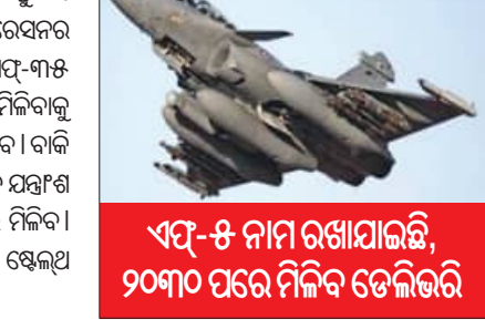
ଏସ୍-୫ ନାମ ରଖାଯାଇଛି, ୨୦୩୦ ପରେ ମିଳିବ ଡେଲିଭରି

ରହିଛି । ଏଗୁଡ଼ିକ ୪-୫ ଜେନେରେସନ ଅର୍ଥାତ ପ଼ିଠିର । କିନ୍ତୁ ଏହି ନୂଆ ଏସ୍-୫ ବିମାନଗୁଡ଼ିକ ୫ମ କିମ୍ବା ୬ଷ୍ଠ ଜେନେରେସନର ବୋଲି କୁହାଯାଇଛି । ଏହି ବିମାନଗୁଡ଼ିକ ଆମେରିକାର ଏସ୍-୩୫ ଓ ରୁଷର ସୁଖୋଇ-୫୦ରୁ ମଧ୍ୟ ଅଧିକ ଶକ୍ତିଶାଳୀ । ମିଳିବାକୁ ଥିବା ୧୧୪ଟି ବିମାନରୁ ୧୮ଟି ସମ୍ପୂର୍ଣ୍ଣ ପ୍ରସ୍ତୁତ ହୋଇ ଆସିବ । ବାକି ୯୬ଟି ଭାରତରେ ତିଆରି ହେବ । ଏଥିରେ ୬୦ ପ୍ରତିଶତ ଯନ୍ତ୍ରମଣ୍ଡଳ ସ୍ୱେଦନା ହେବ । ଏସ୍-୫ ବିମାନଗୁଡ଼ିକ ୨୦୩୦ ପରେ ମିଳିବ । ଏହି ସୁପର ରାଫେଲ ବିମାନଗୁଡ଼ିକରେ ଅତ୍ୟାଧୁନିକ ସ୍ତେଲ୍ୟ କ୍ଷମତା ଓ ପରମାଣୁ ଅସ୍ତ୍ର ନିକ୍ଷେପ କରିବାର ଶକ୍ତି ରହିବ ।