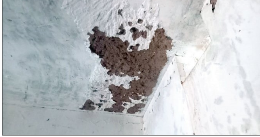
ବିଭିନ୍ନ ଅବ୍ୟବସ୍ଥା ଲାଗି ରହିଥିବା ବେଳେ ଦୀର୍ଘ ବର୍ଷର ପୁରୁଣା ବିଦ୍ୟାଳୟ ଗୃହର କବାଟ ଝରକା ନଷ୍ଟ ହେବା ସହ ଛାତରୁ ସିଲିଂ ଖସୁଥିବାରୁ ଛାତ୍ରଛାତ୍ରୀ ବିପଦପୂର୍ଣ୍ଣ ଭାବରେ ପାଠ ପଢ଼ୁଛନ୍ତି। କେତେବେଳେ କାହା ଉପରେ

ଫିରିଙ୍ଗିଆ ରୁକ୍ମା ପାଠିକରେ ପଞ୍ଚାୟତ ବୃତ୍ତିପତ୍ତା ପ୍ରାଥମିକ ବିଦ୍ୟାଳୟ ବର୍ତ୍ତମାନ ବହୁ ଅବ୍ୟବସ୍ଥା ଦେଇ ଗତିକରୁଛି। ସରକାରଙ୍କ ତରଫରୁ ବର୍ତ୍ତମାନ ଉନ୍ନତମାନର ଶିକ୍ଷା ବ୍ୟବସ୍ଥା ସହ ଉନ୍ନତ ବିଦ୍ୟାଳୟ ଭିତ୍ତିକୁମ୍ଭି, କମ୍ପ୍ୟୁଟରରେ ଶିକ୍ଷା ଓ କ୍ରୀଡ଼ାରେ ବିକାଶ ପାଇଁ ମଧ୍ୟ ଲକ୍ଷ୍ୟ ଲକ୍ଷ୍ୟ ଟଙ୍କା ଯୋଗାଇ ଦେଉଛନ୍ତି। କିନ୍ତୁ ଆଦିବାସୀ ଅଧ୍ୟକ୍ଷିତ ଏବଂ ଉପାଦ୍ର ଅଞ୍ଚଳରେ ଥିବା ପ୍ରାଥମିକ ବିଦ୍ୟାଳୟରେ ଅଧ୍ୟୟନରେ ଛାତ୍ରଛାତ୍ରୀ ଉପଯୁକ୍ତ ସୁବିଧା ପାଇନଥିବା ବେଳେ କେଉଁଠି ବିଦ୍ୟାଳୟ ଗୃହ ଭାଙ୍ଗି ରହିଛି ତ କେଉଁଠି ପାଣି ବ୍ୟବସ୍ଥା ନଥିବାରୁ ପାଣି ପାଇଁ ବହୁ ଦୂରରୁ ପାଣି ଆଣି ପିଲାମାନେ ବ୍ୟବହାର କରୁଛନ୍ତି। ଶୈତଳୀକରଣ ବ୍ୟବହାର ବୃଦ୍ଧି କିନ୍ତୁ କଥା ନିର୍ମାଣ ପରେ ବ୍ୟବହାର ନ ହୋଇ ତାହା ଭାଙ୍ଗି ନଷ୍ଟ ହୋଇ ଲକ୍ଷ୍ୟ ଲକ୍ଷ୍ୟ ଟଙ୍କା କ୍ଷତି ହେଉଛି। ବିଦ୍ୟାଳୟରେ ବର୍ତ୍ତମାନ