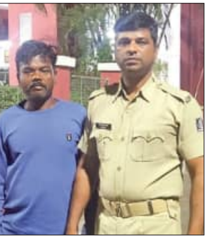
ବୁଦ୍ଧପୁର, ୧୨ (ସମିପ)

ହଳଦିଆପଦର ଓଭରବ୍ରିଜ୍ରେ ଦୁର୍ଘଟଣାରେ ଖଣ୍ଡିତ ହୋଇଥିବା ଯାନବାହାନ ଗୁଡ଼ିକର ସ୍ଥଳିତ ହୋଇଥିବା ଦୃଶ୍ୟ।