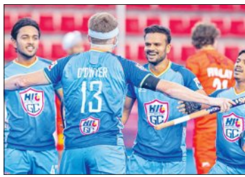
କାଉନସିଲ୍ (କିସି) ବଡ଼ ବିଜୟ ହାସଲ କରିଛି । ୩-୨ ଗୋଲରେ ରାଞ୍ଚି ରୟାଲ୍ସକୁ ପରାସ୍ତ କରିଛି । ଅପରପକ୍ଷରେ ମହିଳା ବିଭାଗରେ ଜେଏସଡବ୍ଲ୍ୟୁ ସୁରମା ହକି କ୍ଲବ୍ ୩-୨ ଶ-୩ ଗୋଲରେ ବଡ଼ ବ୍ୟବଧାନରେ ଶାର୍ଦ୍ଦି ବେଙ୍ଗାଲ ଟାଇଗର୍ସକୁ ପରାସ୍ତ କରିଛି । ବିଜୟ