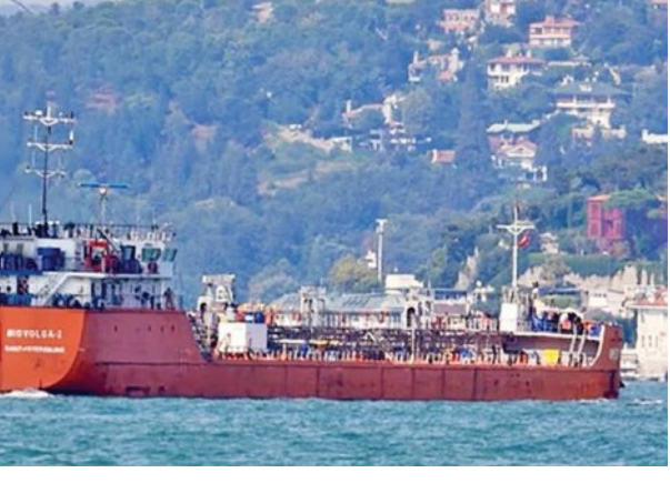
ହେଲିକପ୍ଟରରୁ ଏହି ଜାହାଜରେ ଓହ୍ଲାଇ ଥିଲେ ଏବଂ ସମସ୍ତଙ୍କୁ ବନ୍ଦା କରିଥିଲେ। ଏହି ସମୟରେ ରୁଷର ଜାହାଜ ଉପସ୍ଥିତ ଥିବା ସତ୍ତ୍ୱେ ସାମିଲ ଦେଶକୁ ଏଡ଼ାଇ ଦିଆଯାଇଥିଲା। ଏ ନେଇ ରୁଷ ପକ୍ଷରୁ କୌଣସି ପ୍ରତିକ୍ରିୟା ଦିଆଯାଇ ନାହିଁ। ଏହା ମଧ୍ୟରେ ରୁଷ ଗଣମାଧ୍ୟମ ଜାହାଜ ପାଖରେ ଥିବା ହେଲିକପ୍ଟର ଫଟୋ ଜାରି କରିଛି।

ଅନ୍ୟ କିଛି ପତାକା ଲଗା ଯାଇଥିଲା। ଏହି ଜାହାଜକୁ ରୁଷର ଆନୁଷ୍ଠାନିକ ପଞ୍ଜିକରଣ ଚାଲିକାରେ ସାମିଲ କରାଯାଇଥିଲା। ଆମେରିକା ଭୟରେ ରାଷ୍ଟ୍ର ବଦଳାଇ ଏହି ଜାହାଜକୁ ଆଚଳାଣିକ ଅଭିମୁଖେ ନିଆ ଯାଇଥିଲା। ମାତ୍ର ଆମେରିକା ଏବଂ କ୍ରିଟେନ ସମେତ ଅନେକ ଦେଶ ଏହି ଜାହାଜ ଉପରେ ନଜର ନ ଥିବାରୁ ଆମେରିକା ପ୍ରଥମେ କୌଣସି ପଦକ୍ଷେପ ନେଇ ନ ଥିଲା। ଆମେରିକାର ସୁସ୍ୱୟଚ୍ଛିଦି ମୁନରୋ ଏହାର ପିଛା କରିଥିଲା। ପରେ ଆମେରିକା ସୈନିକ