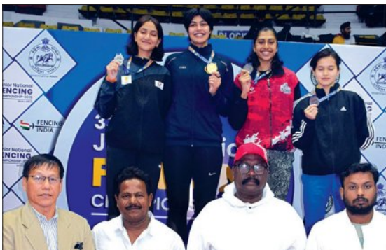
କଟକ, ୭।୧ (ସମିସ): ସ୍ଥାନୀୟ ଜବାହରଲାଲ ନେହେରୁ ସ୍ପୋର୍ଟସ୍ ଷ୍ଟାଡ଼ିୟମରେ ଚାଲିଥିବା ଜାତୀୟ ଚାମ୍ପିଅନସିପରେ ହରିୟାଣା ଦଳ ପ୍ରାଧିକ୍ୟ ବିସ୍ତାର କରି ରଖିଛି । ଫର୍ଷ୍ଟ ଲିଗ୍ରେ