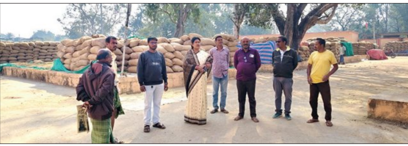
ଦେଖି ସେ ଗର୍ଜିବା ସହ ସରକାରକୁ ଚେତାଇବା ପାଇଁ ସ୍ନେହାଞ୍ଜିନୀ ଗର୍ଜିଲେ। ଯଦି ଶିଳ୍ପ ଚାଷୀଙ୍କ ଧନ ସରକାର ନ ଉଠାନ୍ତି ତେବେ ସାତ ଆଠ ଦିନ ଭିତରେ

ହଜାର କୁଇଣ୍ଟାଲ ଧାନ ପଡ଼ିରହିଥିବା ବେଳେ ଧାନ ଉଠୁନାହିଁ। ପ୍ରଶାସନ ଓ ମିଳିତ ଯତ୍ନରେ ଧାନ ଉଠାଉଛି। ଧାନ ବିକ୍ରି ହୋଇପାରି ନଥିବାରୁ ଲେବରକୁ ଚଳା ଦେଇପାରୁ ନାହିଁ। ଚାଷୀ ବାଧ୍ୟହୋଇ ମହାଜନଠୁ ସୁଧରେ ଚଳା ଉଠାଇ ଲେବରକୁ ପଇଠ କରିଛନ୍ତି। ଏପଟେ ପିଲାଙ୍କ ପାଠପଢ଼ା ତଥା ଦୈନିକ ଖର୍ଚ୍ଚ ତୁଳାଇବାକୁ ଚାଷୀ ହତସ୍ତ ହେଉଛନ୍ତି। କିଛି ପରିସର ଧାନ ଉଠାଣ ପ୍ରକ୍ରିୟା ଚାଲୁଥିବା ବେଳେ ଚାଷୀଙ୍କ ଅଭାବନା ଓ ପ୍ରତିବାଦ ପରେ ବି ସରକାର ଚେତୁ ନ ଥିବାରୁ ଏବେ ଚାଷୀଙ୍କ ମହଲରେ ଅସନ୍ତୋଷ ବୃଦ୍ଧିପାଇଁ ଲାଗିଛି।