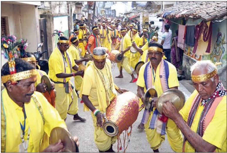
ମଥୁରା ନଗରୀ, ୨୧(ସମ୍ବିଧ)