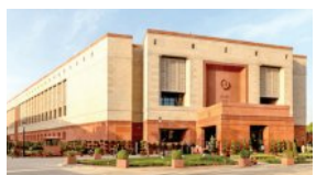
ସଂସଦର ଆନେକ୍ସ ମୁଖ୍ୟ କମିଟି କକ୍ଷରେ ଅନୁଷ୍ଠିତ ହେବ।

ନୂଆଦିଲ୍ଲୀ, ୨୪୧ (ଏକେନ୍ଦ୍ର): ଆସନ୍ତା ୨୮ ତାରିଖରୁ ସଂସଦର ବଜେଟ୍ ଅଧିବେଶନ ଆରମ୍ଭ ହେବାକୁ ଯାଉଛି। ଏହା ପୂର୍ବରୁ ସ୍ଵରାଜ୍ୟରେ ଗୃହ ଚଳାଇବା ପାଇଁ ସରକାର ପ୍ରସ୍ତୁତି ଆରମ୍ଭ କରିଦେଇଛନ୍ତି। ବଜେଟ୍ ଦିନକ ପୂର୍ବରୁ ୨୭ ତାରିଖରେ ସରକାର ସର୍ବଦଳୀୟ ବୈଠକ ଡକାଇଛନ୍ତି। କେନ୍ଦ୍ରମନ୍ତ୍ରୀ କିରନ ରିଜିକୁ ଡକାଇଥିବା ଏହି ବୈଠକ ୨୭ ତାରିଖ ସକାଳ ୧୧ଟାରେ ସଂସଦ ଭବନର ଆନେକ୍ସ ମୁଖ୍ୟ କମିଟି କକ୍ଷରେ ଅନୁଷ୍ଠିତ ହେବ। ଏଥିରେ ବିରୋଧୀ ଏବଂ ସରକାର ଅଧିବେଶନର ଏକେଣ୍ଡା ଉପରେ ନିଜ ନିଜ ରାୟ ରଖିବେ। ସଂସଦର କାର୍ଯ୍ୟପୂର୍ବା ଏବଂ ଅଧିବେଶନର ଉଦ୍ଘାଟନ ହେବାକୁ ଥିବା ବିଭିନ୍ନ ପ୍ରସଙ୍ଗ ଉପରେ ମଧ୍ୟ ଚର୍ଚ୍ଚା କରାଯିବ। ସବୁ ଦଳର ରାୟ ଜାଣିବା ଏବଂ ହଜାମା ବିନା ଗୃହ ଚଳାଇବା ଏହି ବୈଠକର ଉଦ୍ଦେଶ୍ୟ। ମନରେଗା ବଦଳରେ ସରକାର ଆଣିଥିବା ବିକଶିତ ଭାରତ-ଗ୍ୟାରେଣ୍ଡି ଫର ରୋଜଗାର ଆଣ୍ଡ ଆଜିବାଦୀ ମିଶନ (ଭିଏ-ଜି-ରାମ-ଜି)କୁ ନେଇ ବିରୋଧୀ କଂଗ୍ରେସ ସାରା ଦେଶରେ ଅଭିଯାନ ଚଳାଇଥିବା ବେଳେ ଏହି