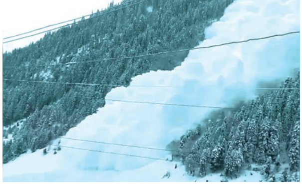
ପେଶାୱାର, ୨୪୧ (ଏକେନ୍ଦ୍ର): ପାକିସ୍ତାନର ଉତ୍ତର-ପଶ୍ଚିମ ଖାଇବର ପଞ୍ଚମୁନଖା ରାଜ୍ୟର ଏକ ପାର୍ବତ୍ୟ ଜିଲ୍ଲାରେ ଶୁକ୍ରବାର ଏକ ଘର ଉପରେ ଅତ୍ୟନ୍ତ ହିମସ୍ଫଳନ ଘଟିଥିଲା। ଏଥିରେ ଅତିକମରେ ଗୋଟିଏ ପରିବାରର ୯ ଜଣ ମୃତ୍ୟୁବରଣ କରିଛନ୍ତି। ଜଣେ ଆହତ ହୋଇଥିବା ଶିଶୁକୁ ଉଦ୍ଧାର କରାଯାଇଛି। ନିମ୍ନ ତିଆରି ଜିଲ୍ଲାର ଆରଣ୍ଡ ଅଞ୍ଚଳରେ ଏହି ଘଟଣା ଘଟିଛି।