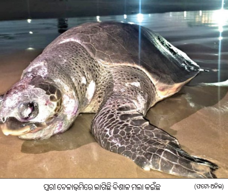
ପୁରୀ ବେଳାଭୂମିରେ ଲାଗିଛି ବିଶାଳ ମଲା କଇଁଛ (ପଟୋ-ଅନିଲ)

ବାଲିକୁଦା/ଅସ୍ତରଙ୍ଗ, ୨୪୧୧ (ସମ୍ପାଦକ): ବଙ୍ଗୋପସାଗର ଦେବାନନ୍ଦା ମୁହାଣ ନଡ଼ିଆଖୁଆ ନିକଟରୁ ଏକ ବିଶାଳ ତିନିମାଛର ମୃତଦେହ ଉଦ୍ଧାର ହୋଇଛି । ମାଛର ଲମ୍ବ ୩୦ ଫୁଟରୁ ଉର୍ଦ୍ଧ୍ଵ ହେବ ବୋଲି ଜଣାଯାଇଛି । ମତ୍ସ୍ୟଜୀବୀମାନେ ତିନିକୁ ଦେଖି ବନ୍ଦର ସାମୁଦ୍ରିକ ଆନା ଓ ବନ ବିଭାଗକୁ ସୂଚନା ଦେଇଥିଲେ । ବନ ବିଭାଗର ୨ ଜଣିଆ ସହସ୍ୟ ଏକ ବୋଟ୍ ଯୋଗେ ଘଟଣାସ୍ଥଳକୁ ଯାଇ ତିନିକୁ ଜରି ରହିଥିଲେ । ଏ ଫର୍ଦ୍ଦରେ ପରେଷ୍ଠର ପ୍ରିୟରୁ ତୃପ୍ତିରୁ ଦୂରକୁ କୁଜଙ୍ଗ ବନାଞ୍ଚଳ ଅଧିକାରୀଙ୍କୁ ଅବଗତ କରାଇଛନ୍ତି । ତିନିର ବ୍ୟବଚ୍ଛେଦ ପାଇଁ ଏକ ଡାକ୍ତରୀ ଦଳ ସହ ନନ୍ଦନକାନନର ଏକ ଟିମ୍ପର ସହାୟତା ନିଆଯାଇଛି । ଦେବାନନ୍ଦାରେ ପାଣି ଛାଡ଼ି ଯାଇଥିବା କାରଣରୁ ଜୁଆର ଆସିବା ପର୍ଯ୍ୟନ୍ତ ଉକ୍ତ ସ୍ଥାନକୁ ଯିବା କଷ୍ଟସାଧ୍ୟ । ଯଦି ଆବଶ୍ୟକ ପଡ଼େ, ମାଂସ ବାହାର କରାଯାଇ କଳାଳକୁ ନନ୍ଦନକାନନ ନେବାର ବ୍ୟବସ୍ଥା ଗ୍ରହଣ କରାଯିବ । ତେବେ ସନ୍ଧ୍ୟା ୭ଟା ପରେ ଜୁଆର ଆସିବା ପରେ ଡାକ୍ତରୀ ଟିମ୍ ଘଟଣାସ୍ଥଳକୁ ଯାଇ ତିନିର ବ୍ୟବଚ୍ଛେଦ କରିବ ବୋଲି ପରେଷ୍ଠର ଶ୍ରୀ ତୃପ୍ତିରୁ ସୂଚନା ଦେଇଛନ୍ତି । ତିନିଟିର ବାର୍ଦ୍ଧକ୍ୟ ଜନିତ ମୃତ୍ୟୁ ନା ଆଘାତ କାରଣରୁ ହୋଇଛି, ବ୍ୟବଚ୍ଛେଦ ରିପୋର୍ଟ ଆସିବା ପରେ ଜଣାପଡ଼ିବ ବୋଲି ସେ କହିଛନ୍ତି ।