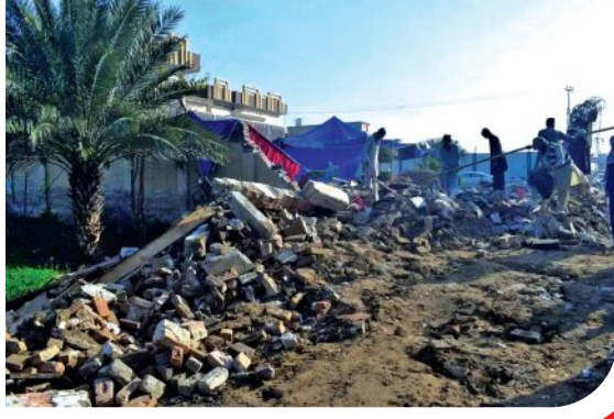
ଡେରା ଲସାଲ ଖାନରେ ଆମ୍ବୁତୀ ବିସ୍ଫୋରଣର ଫଳସ୍ଵରୂପ ଭାବରେ ନିର୍ମୂଳକ ଉତ୍ସବ ସ୍ଥଳରେ ବିଳମ୍ବିତ ରାତିରେ ଏକ ଆମ୍ବୁତୀ ବିସ୍ଫୋରଣ ଘଟିଥିଲା। ଏଥିରେ ଅତିକମରେ ୭ ଜଣ ମୃତ୍ୟୁବରଣ କରିଥିବା ବେଳେ ୨୫ ଜଣ ଆହତ ହୋଇଛନ୍ତି ବୋଲି ଗଣମାଧ୍ୟମ ରିପୋର୍ଟରୁ ଜଣାଯାଇଛି।

ଡେରା ଲସାଲ ଖାନ, ୨୪୧ (ଏକେନ୍ଦ୍ର): ପାକିସ୍ତାନର ଖାଇବର ପଞ୍ଚମୁନଖାରେ ତେରା ଲସାଲ ଖାନ ନିକଟରେ ଶୁକ୍ରବାର ବିଳମ୍ବିତ ରାତିରେ ଏକ ଆମ୍ବୁତୀ ବିସ୍ଫୋରଣ ଘଟିଥିଲା। ଏଥିରେ ଅତିକମରେ ୭ ଜଣ ମୃତ୍ୟୁବରଣ କରିଥିବା ବେଳେ ୨୫ ଜଣ ଆହତ ହୋଇଛନ୍ତି ବୋଲି ଗଣମାଧ୍ୟମ ରିପୋର୍ଟରୁ ଜଣାଯାଇଛି।