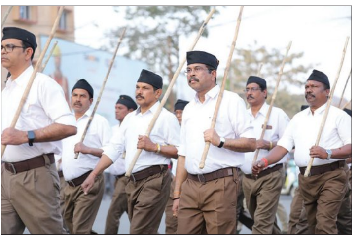
ଆର-ସ୍ୱ-ସ୍ୱର ଶତାବ୍ଦୀ ବର୍ଷ ଅବସରରେ ଆୟୋଜିତ ପଥ ସଞ୍ଚଳନ କାର୍ଯ୍ୟକ୍ରମରେ କେନ୍ଦ୍ର ଶିକ୍ଷାମନ୍ତ୍ରୀ